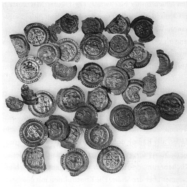
28: Cham, Oberwilerwald. Auswahl der Münzen des Fundes vom Sommer 2004.

Im Gegensatz zum Konstanzer Münzgebiet, in welchem mehrere Münzherren ihr Geld nach Konstanzer Vorbild prägten, finden sich im Zürcher Währungsraum des 13. Jahrhunderts nur drei Münzstätten Zürcher Schlags: jene der Fraumünsterabtei in Zürich sowie die im Vergleich zu dieser unbedeutenden Münzstätten der