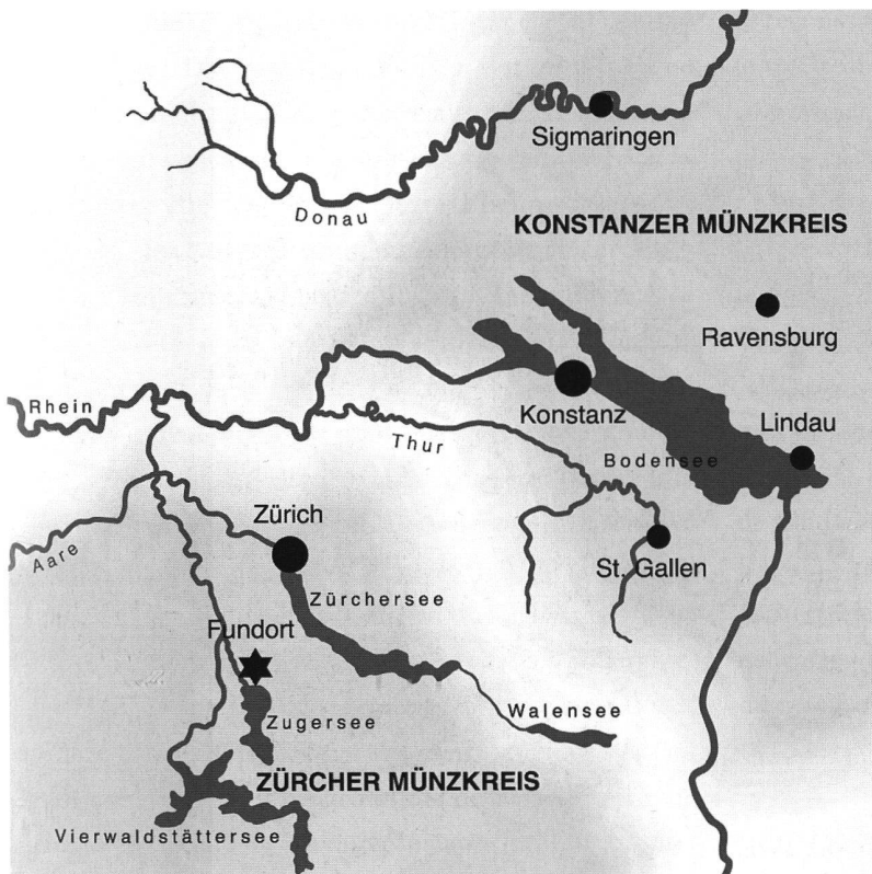
29: Cham, Oberwilerwald. Fundort und die im Fund vertretenen Münzstätten nebst Prägeort der jeweiligen Leitwährung.