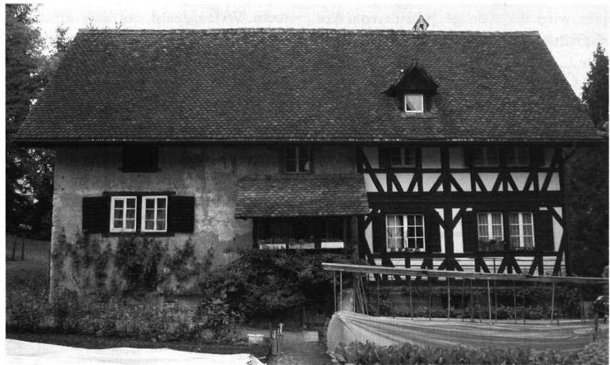
Cham ZG, «Turmhaus» auf der Halbinsel St. Andreas. Ansicht an die Südfassade. Der Ostteil rechts geht auf einen wahrscheinlich um 1490 als Kaplanei erbauten Ständerbau zurück (Heinz Egger).