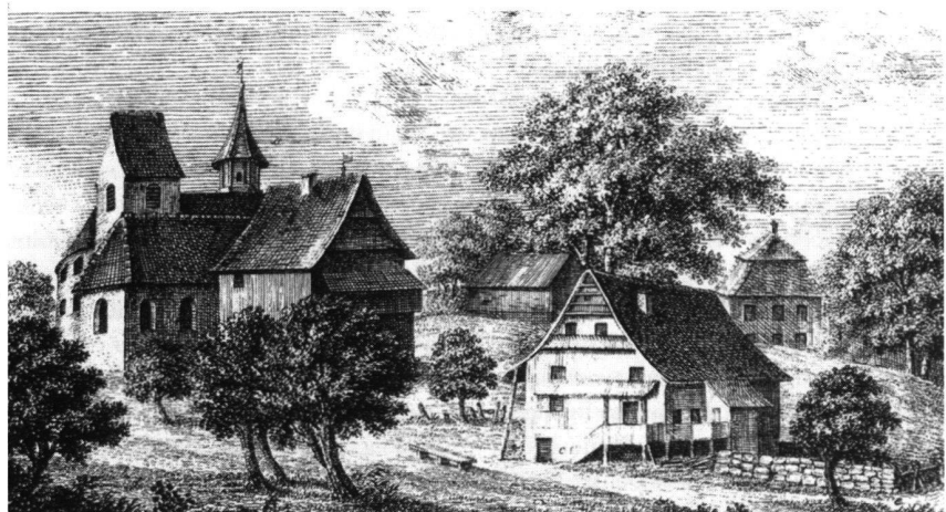
Cham ZG, Halbinsel St. Andreas. Lithographie von Johann Caspar Moos 1819. Legende: «a. Das Schloss. b. Die Kirche c. Das alte Caplanei Haus. d. Das heutige. e. Wo noch anfangs des XVII. Saec. ein starker Thurm stand.»