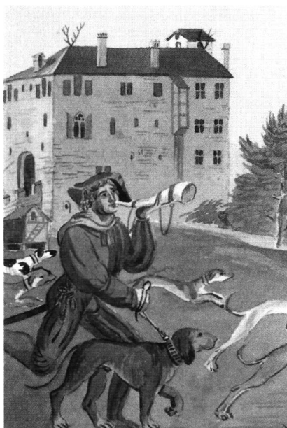
Ansicht von Schloss Buonas kurz nach dem Neubau. Kopie von J. Schwegler 1825 nach der Ausmalung im grossen Saal des Hertenstein-Hauses in der Stadt Luzern vermutlich von Hans Holbein d.J. um 1517.

In einer späteren Phase wurde innen an die Südwestecke der Umfassungsmauern ein im Grundriss quadratischer, ursprünglich vermutlich viergeschossiger Turm gebaut. Der Turm deckt eine Luzidennische zu und sitzt vermutlich auf der Krone der Umfassungsmauer. Zum ursprünglich obersten Geschoss führt eine Rundbogentüre mit Balkenkanal. Zum einstigen Dachstuhl des Turmes könnten leere Löcher für diagonal verlaufende Rundhölzer im obersten Geschoss gehören.