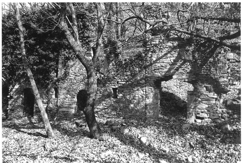
1: Bellinzona-Ravecchia: l'antico nucleo di Prada – Kern der ehemaligen Siedlung Prada.

La morfologia del territorio ticinese è profondamente segnata, nel Sopraceneri, da un rilievo montuoso che non ha comunque impedito all'uomo, in alcuni periodi della storia, di costruire abitazioni non solo ai piedi, ma