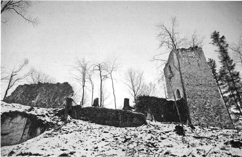
5: Blick vom Fuss des Turmes nach Süden, vor der Sanierung, Januar 2007.

nun auch den Thurgau. 1488 gründete Kaiser Friedrich III. den Schwäbischen Bund, einen Zusammenschluss von schwäbischen Reichsständen. Die Stadt Konstanz bemühte sich vorerst, zwischen der Eidgenossenschaft und dem Schwäbischen Bund neutral zu bleiben. Mit