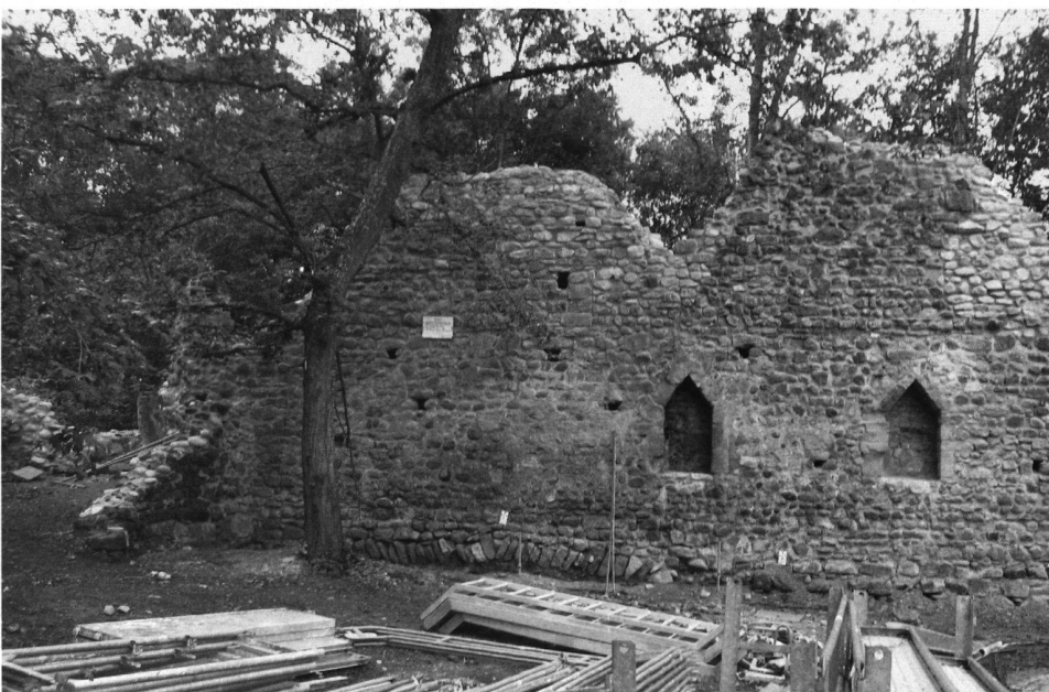
10: Mauer 18 von Norden, nach der Sanierung, Herbst 2007.

der verwendet. Auffällig ist, dass diese Quader innerhalb desselben Eckverbandes und unter den vier Eckverbänden unterschiedlich bearbeitet sind. Auch im Mauerwerk sind Unterschiede in Stein und Mörtel sichtbar. Dies weist auf verschiedene Bauphasen des Turmes hin, auch wegen der Verwendung von Spolien. Dendrochronologische Untersuchungen von Holzresten im Turm brachten leider keine Hinweise. Ursprünglich wurde der Turm wohl über den Hocheingang an der Ostseite betreten; der jetzige Balkon