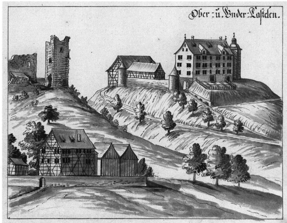
4: Ruine und Schloss Chastel Mitte des 18. Jh. (ZBZ Graph. Slg. PAS 5, fol. 38).