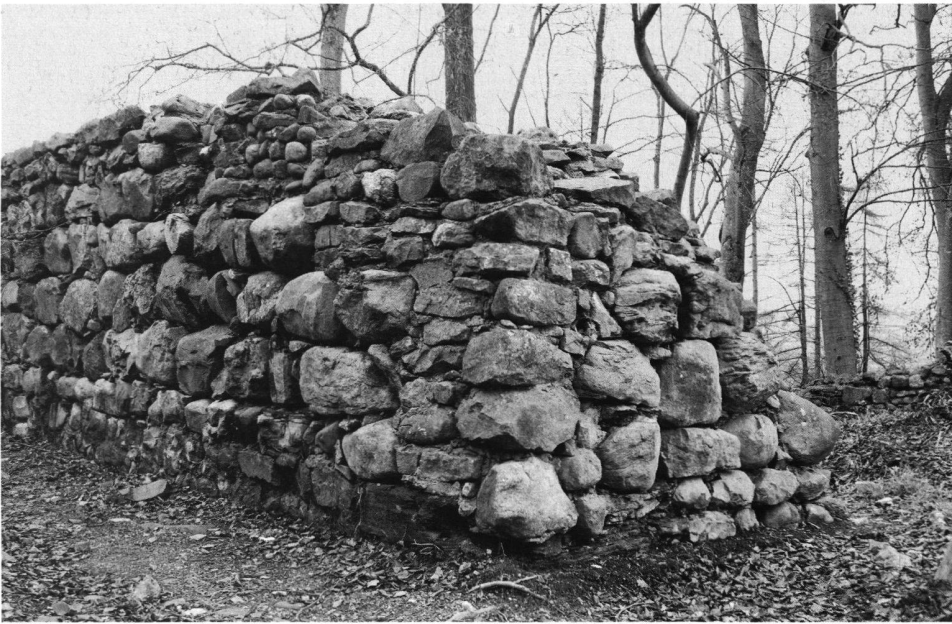
9: Kapelle oder Burgfried? Die Ecke der Mauern 10/11.