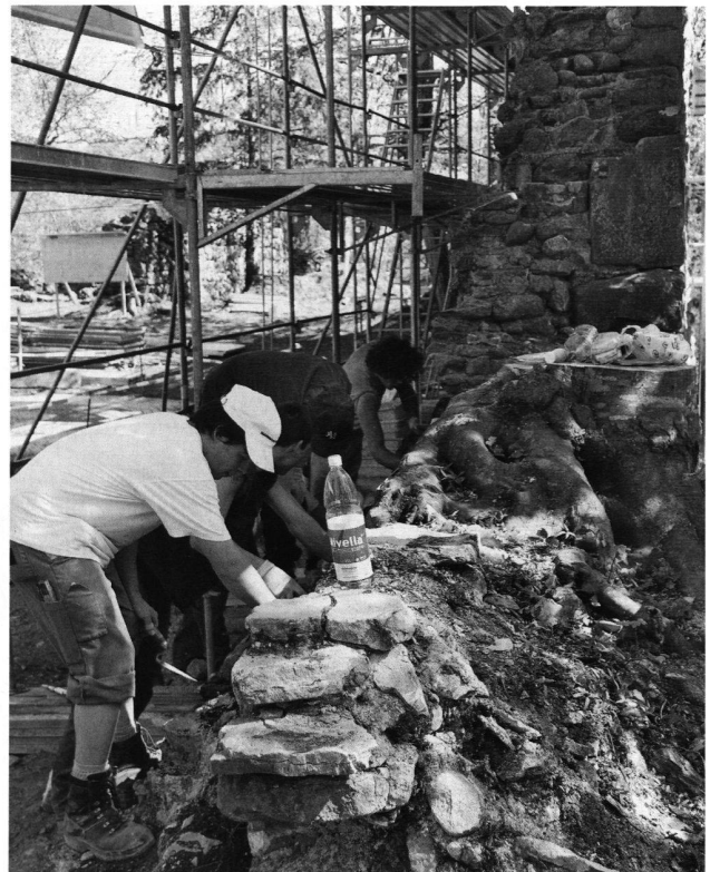
3: Sanierungsarbeiten an den Mauern der Ruine Chastel, Sommer 2007.

Der Nachfolger Bischof Ulrich II. (1127–1138) soll diese Burg schon 1128 wieder zerstört haben, da er befürchtete, dass Graf Rudolf von Bregenz, mit welchem er im Streit lag, Chastel als Rückhalt für eine Belagerung von Konstanz benutzen könnte. 6