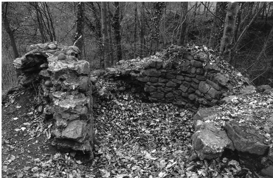
8: Der Rundturm im Osten der Anlage, 2007.

kam. Beide Parteien versuchten, die Güter des Gegners zu plündern. In dieser Zeit wurde am 11. März 1499 die Burg Chastel, die immer noch ein Lehen des Konstanzer Stifts war, von den Eidgenossen in Brand gesetzt und endgültig zerstört.