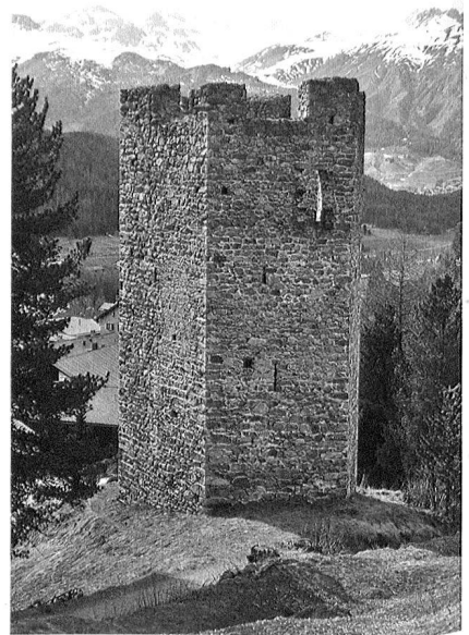
Pontresina GR, Spaniolaturm

Am Weg von San Gian nach Pontresina liegt die Burgstelle Chastlatsch auf einer bewaldeten Felskuppe. Auf dem länglichen, vom Gletscher abgeschliffenen Felskopf sind die Mauerspuren eines schmalen, rechteckigen Gebäudes