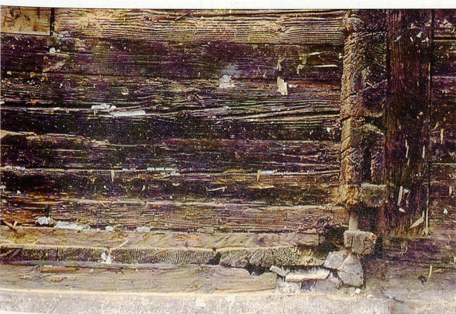
2: Südöstliche Ecke des erhaltenen Teils des Kernbaus. Sichtbar sind die fassadenbündigen Bodenbohlen und das Schwellenschloss. Rechts fügt sich der Anbau des 19. Jh. an. Blick nach Norden.

Die darüberliegende Kammer übernahm den Grundriss derjenigen des Erdgeschosses, hatte aber eine Raumhöhe von mutmasslich 1,75 m. Die 1989 angetroffene Decke