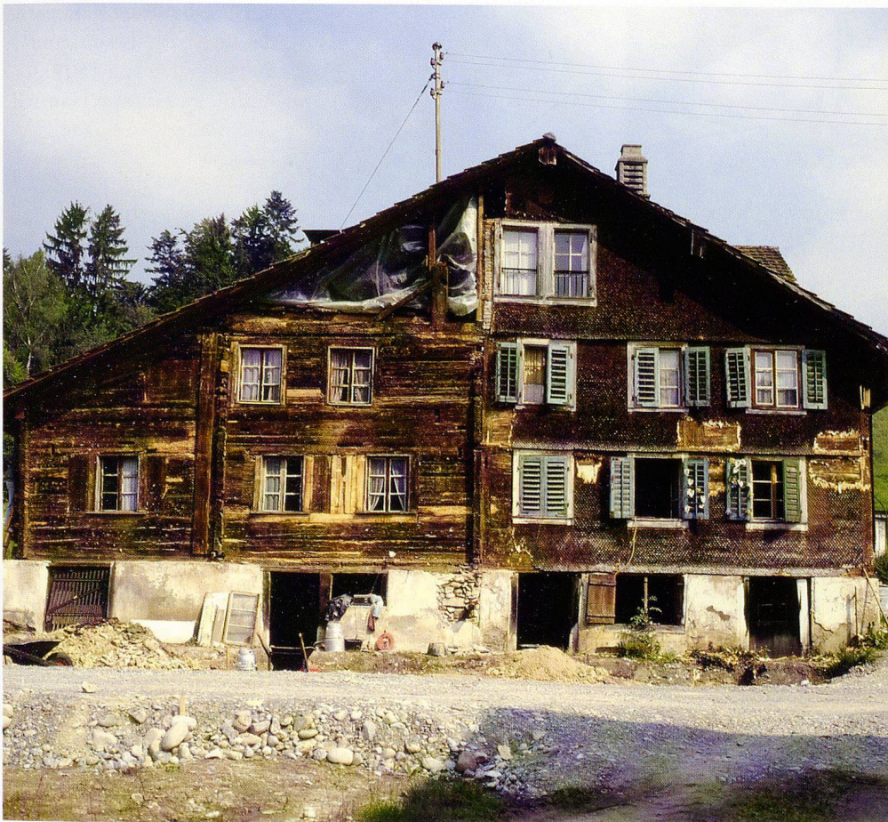
1: Die Südfassade des Hauses «Weid». In der Mitte der Kernbau, links der frühnezeitliche Anbau, rechts der im 19. Jh. erichtete Hausteil.

der Kammer wurde bei späteren Umbauten vollständig ersetzt.