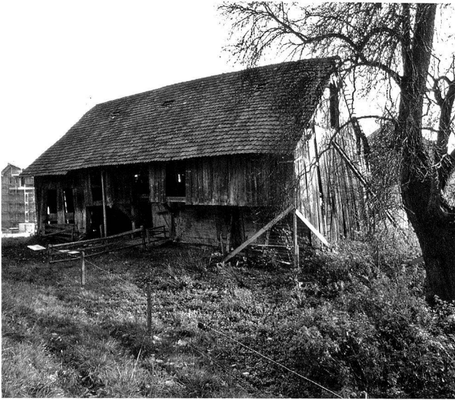
7: Die 1502 erbaute und 1799 umgebaute Scheune «Weid». Blick nach Südosten.

konnte das Schlagdatum Herbst/Winter 1508/09 festgelegt werden. Die restlichen fünf besaßen Endjahre zwischen 1491 und 1500. Der Umbau des 19. Jh. wurde nicht dendrodatiert.