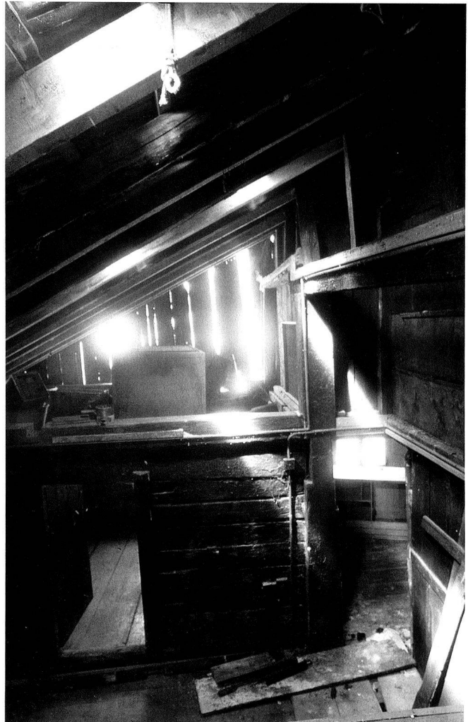
5: 1. Obergeschoss, hinterer Hausteil. Kammer in Ständerbohlenbauweise und Hochstud mit Firstpfette. Blick nach Norden.

Der mittlere und hintere Hausteil übernahm die Westflucht des Kernbaus. Der 3,5 m breite Mittelgang blieb –