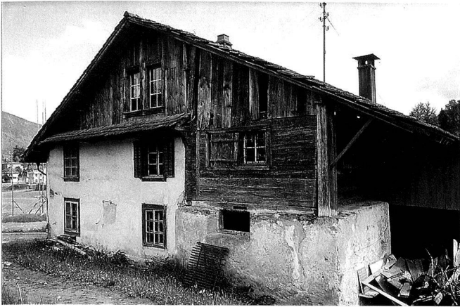
4: Rückansicht des Hauses. Gemauerter Sockel mit darüberliegender Kammer in Ständerbohlenbauweise. Blick nach Südosten.

setzung des Kernbaus im Zusammenhang mit den frühneuzeitlichen Baumassnahmen ist aber aufgrund der Stossfuge in der Sockelmauer auszuschliessen.