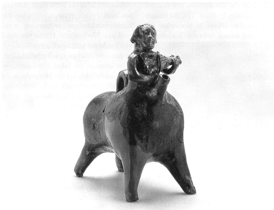
3: Aquamanile in der Form eines die Fidel spielenden Kentauren; gefunden in der Brandschicht von Haus 5. Vermutlich stellt das Aquamanile den Kentauren Chiron dar, der im Unterschied zu seinen barbarisch-wilden Artgenossen der gelehrte Erzieher von Achilles, Jason und anderer antiken Helden war. Er unterrichtete seine Schüler in Musik, Heilkunde, Gymnastik und Weissagung. Offenbar verfügte der Töpfer, der das Aquamanile anfertigte, und vermutlich auch sein Käufer, der Schmied in Haus 5, zumindest über oberflächliche Kenntnisse der griechischen Mythologie, die in der höfischen Dichtung des Mittelalters eine nicht unbedeutende Rolle spielte.

den eingetieftes Holzhaus (Haus 9) mit Wänden in Ständerbauweise und zwei Gruben erfasst worden. Unter den Bewohnern der Siedlung gab es Handwerker. Durch ihre Produktionsabfälle sind Beinschnitzer, Schmiede und Paternostermacher bezeugt. Ausgehend von der Lage der Siedlung auf einer Hügelkuppe und den nachgewiesenen Handwerksbetrieben könnte das präurbane Meienberg ein Herrenhof oder eine burgartige Siedlung, vielleicht auch ein Dorf in atypischer Lage gewesen sein.