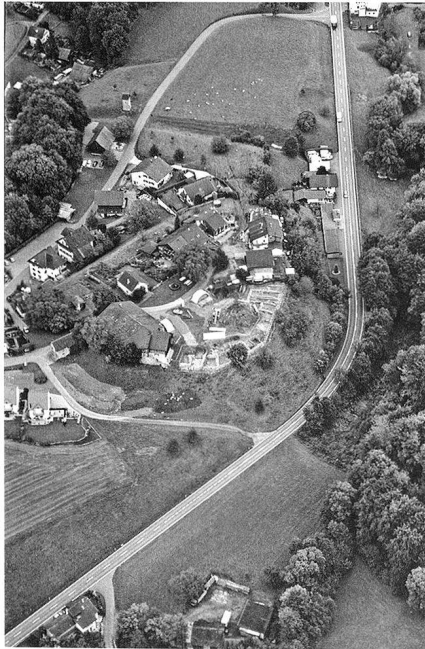
1: Meienberg, Flugaufnahme während der Ausgrabung 2005. Im Vordergrund der nordwestliche, im Hintergrund der östliche Stadtgraben. Im Mittelgrund die Oberstadt mit der ausgegrabenen Stadtmauer und den freigelegten Grundmauern und Kellern der Häuser 1 bis 5 und 10.

Die Stadtwüstung Meienberg bei Sins im oberen Freiamt ist das aargauische Pompeji. Im mittleren 13. Jh. durch die Habsburger gegründet, wurde die Stadt im Sempacherkrieg 1386 durch die Eidgenossen zerstört. So tragisch die Zerstörung der Stadt für ihre Einwohner war, so verdanken wir ihr eine im Boden erhaltene, von späteren Um- und Neubauten verschonte Stadtanlage in ursprünglicher Grundstruktur. Deshalb stellt Meienberg ein wichtiges stadtebauliches und geschichtliches Forschungsobjekt dar. Bauvorhaben innerhalb der Stadtwüstung und in deren nächster Umgebung führen seit 35 Jah-