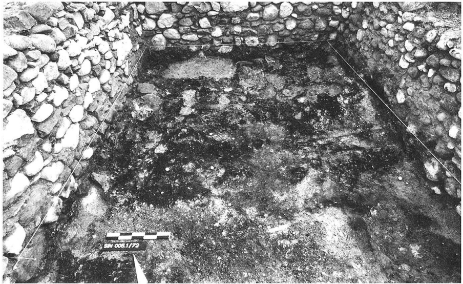
2: Die fundreiche Brandschicht im Keller von Haus 5, einem Holzhaus, das zum Zeitpunkt der Zerstörung 1386 einem wohlhabenden Schmied als Werkstatt und Wohnung gedient hat.