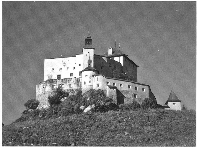
Chastè da Tarasp