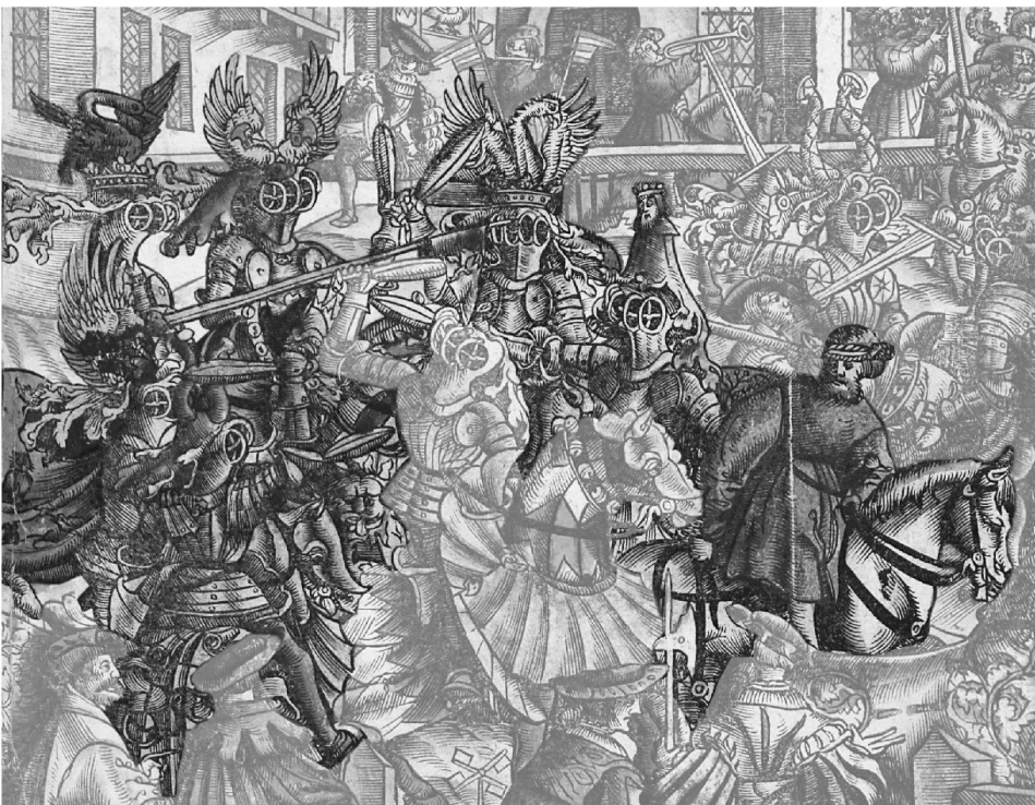
4: Mehrere Edelleute schlagen mit Kolben auf den Missetäter ein. – Ausschnitt aus Abb. 2.