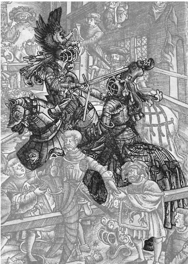
6: Im Nachturnier kämpft jeder gegen jeden und versucht, dem Gegner die Helmzier vom Kopf zu schlagen. – Ausschnitt aus Abb. 2.

Endlich folgt die letzte Phase, das so genannte «Nachturnier» (Abb. 6). Anstatt mit Kolben wird nun mit dem stumpfen Schwert gekämpft. Jeder kämpft gegen jeden. Ziel ist es, dem Gegner die Helmzier vom Kopf zu schlagen.