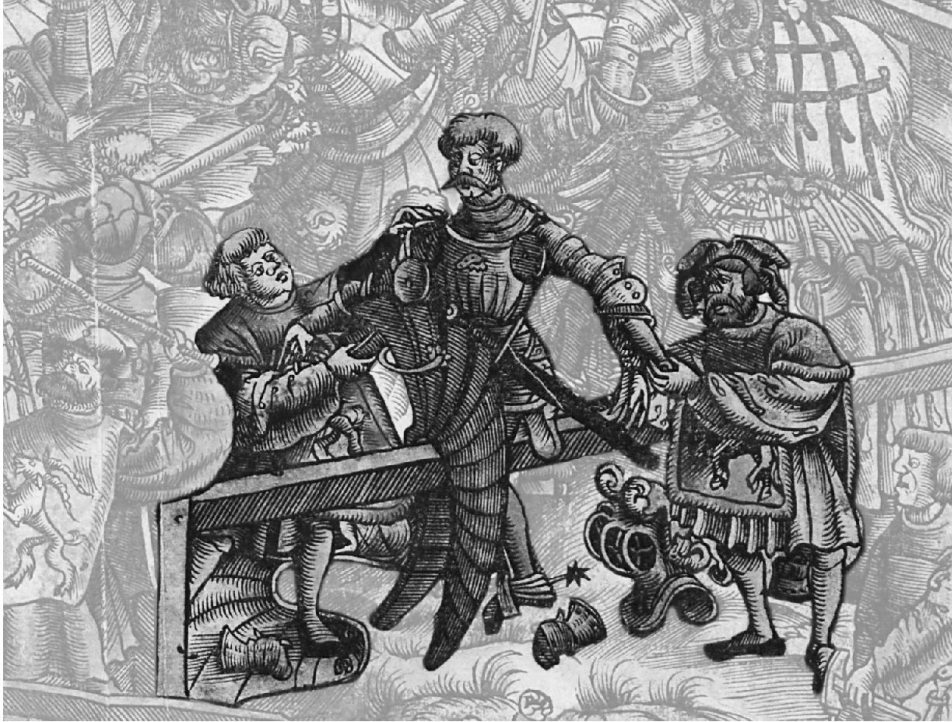
5: Der Bestrafte auf der Schranke verliert sein Pferd und sein Turnierzeug. – Ausschnitt aus Abb. 2.