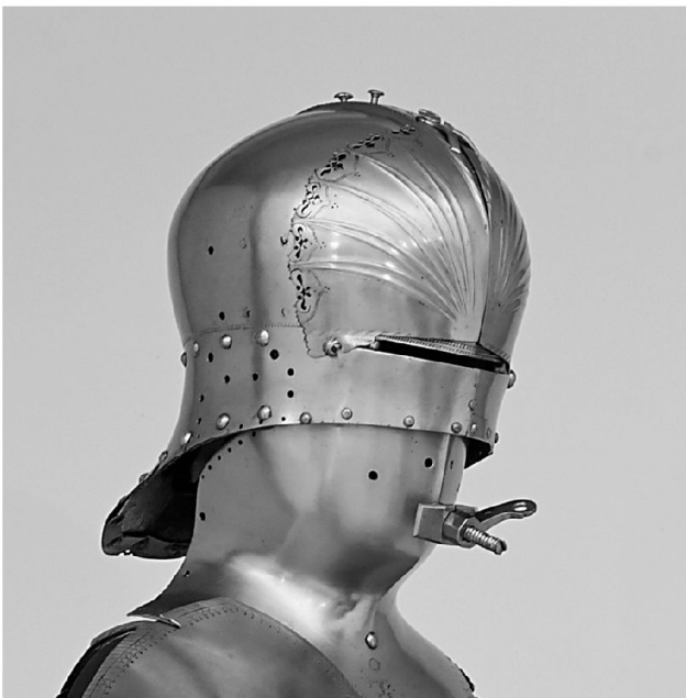
10: Rennhut in der Form einer Schaller mit Bart.