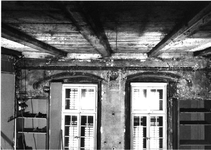
6: Thun, Schloss. Mittlerer Abschnitt des südlichen Schlosstrakts, kleiner Saal im ersten Obergeschoss des Kernbaus. Die Decke dürfte etwa zeitlich parallel zum Dachstuhl um 1566/67 entstanden sein. Die spätbarocke Grisaille-Malerei von 1700 an der Südwand deutet die ehemalige Fenstergliederung an. Blick nach Südwesten.

bild vielleicht suggerieren mag. Entstanden ist er vielmehr wahrscheinlich aus einem kleineren Kernbau im mittleren Abschnitt. Älteres Mauerwerk unter dem Erdgeschossboden könnte auf einen mittelalterlichen Steinbau hinweisen. Dieser mag als Palas oder Wohnbau zu deuten sein.