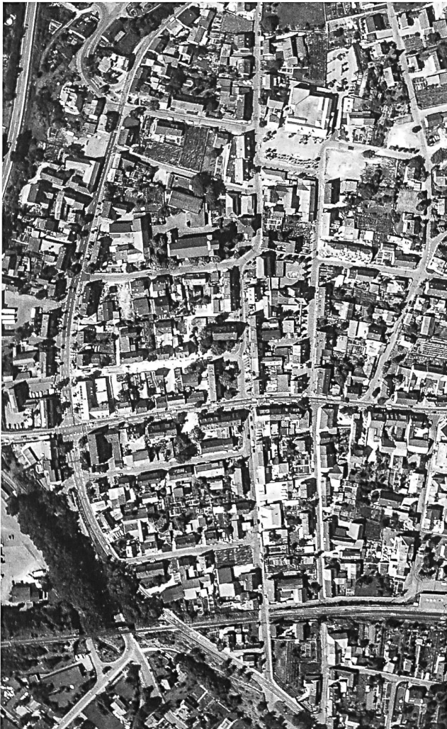
1: Neuenburg am Rhein. Luftbild der ehemaligen Altstadt. Von der mittelalterlichen Stadt hat sich lediglich der Strassenraster erhalten. Am linken Bildrand (Westen) ist die Abbruchkante zum Rhein erkennbar.

Wie kaum eine andere Stadt im Oberrheingebiet litt Neuenburg unter Naturkatastrophen und Kriegen. 1 Die um 1175 von Bertold V. von Zähringen gegründete Stadt prosperierte zunächst. Im 15. und 16. Jh. wurde ihr die verkehrsgünstige Lage am Rhein zum Verhängnis – der Strom riss bei mehreren Hochwassern ein Drittel des Stadtgebietes weg. In den Kriegen des 17. Jh. kam es zu grossen Verwüstungen, so dass die Stadt zwischen 1704 und 1714 nicht bewohnt war. Nach dem Wiederaufbau