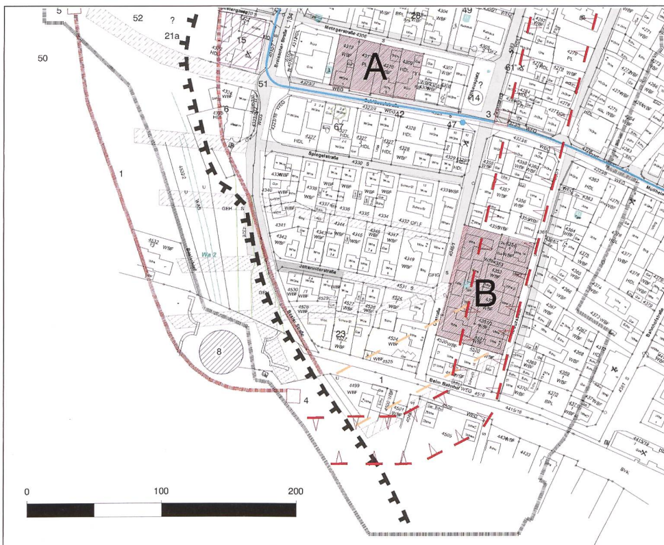
8: Neuenburg am Rhein. Thematisch mit dem neu nachgewiesenen Verlauf der Befestigungsanlage ergänzter Ausschnitt aus der Karte Historische Topographie aus dem Archäologischen Stadtkataster. A Grabung Schlüsselstrasse/Metzgerstrasse, B Grabung Ölstrasse.

Hinter der Stadtmauer ist auf der stadtzugewandten Seite ein angeschütteter Wall erkennbar (Abb. 7). Die kiesigen Schüttschichten legen nahe, dass es sich um Aushub aus dem Stadtgraben gehandelt hat. Dieser als Wehrgang dienende Wallkörper scheint ca. 8 m breit gewesen zu sein. Er wurde von der Ölstrasse begleitet. An seinem Rand