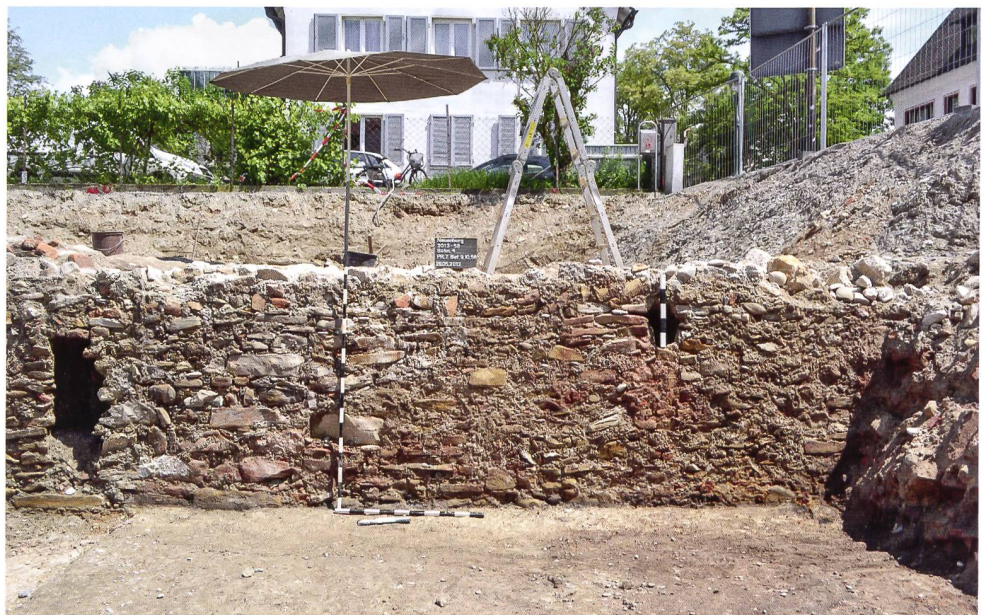
5: Neuenburg am Rhein. Unterfangung der Westwand des ältesten nachgewiesenen Gebäudes mit einer Kellermauer aus der Mitte des 13. Jh.