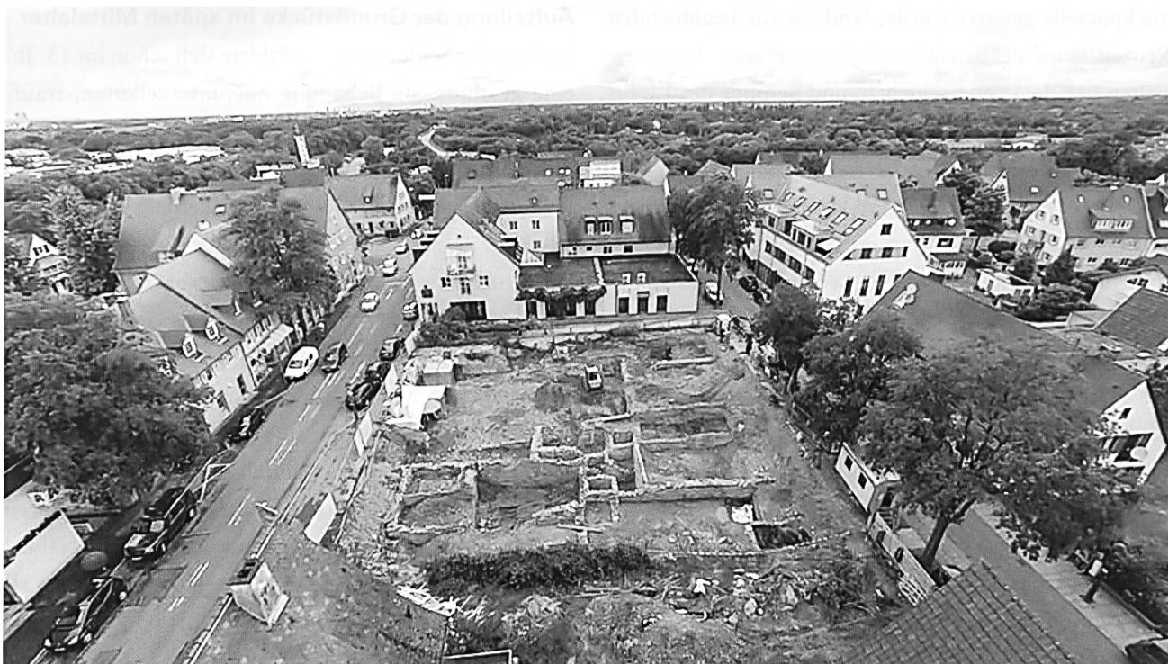
2: Neuenburg am Rhein. Überblick zu Beginn der Grabung Schlüsselstrasse.