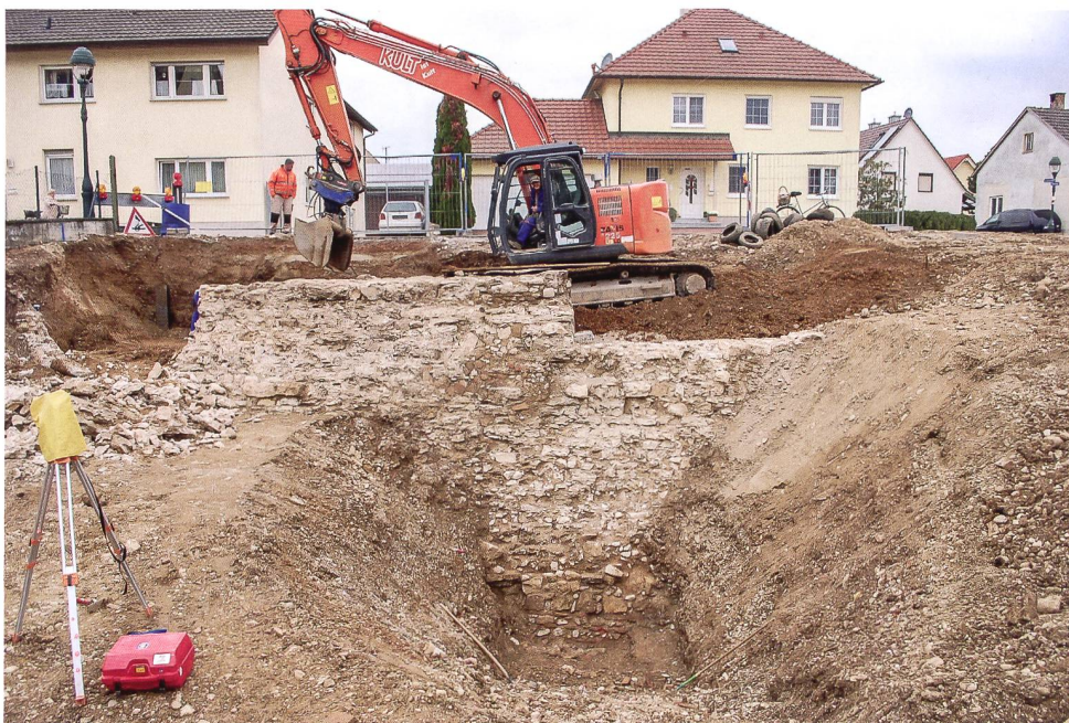
6: Neuenburg am Rhein. Teilstück der an der Ölstrasse erfassten mittelalterlichen Stadtmauer.

Die Stadtmauer war bis in diese Tiefe gleichförmig mit einer Neigung von ca. 15° gegen die Grabenkante gesetzt, so dass bei einer Tiefe von 6 m ein Versatz von ca. 1,30 m zur Ostkante der Mauerkrone bestand (Abb. 7). Die Anlage erinnert so an die zwischen 1120 und 1140 errichtete Freiburger Stadtmauer mit ihrer charakteristischen Mauerschürze. Die Mauer war schalig aufgebaut und an der Aussenfront mit Kalksteinquadern verkleidet, die in der Vorbergzone im Raum Müllheim gebrochen wurden. In den unteren Partien wiesen Reste darauf hin, dass die Mauer verputzt war.