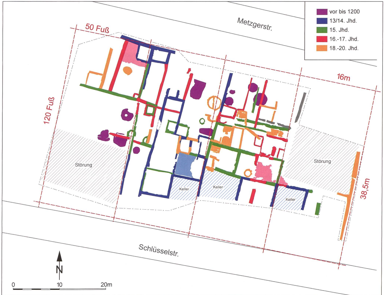
4: Neuenburg am Rhein. Schematisierter Gesamtplan der Grabung Schlüsselstrasse mit den rekonstruierten Hofstätten der ursprünglichen Parzellierung.