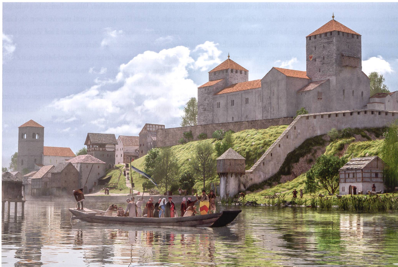
1: Zürich-Lindenhof. Die Königspfalz mit dem zweigeschossigen Saal im Haupttrakt wird im 12. Jh. durch den Einbau von Türmen, das Zumauern der ebenerdigen Eingänge und das Anlegen eines Grabensystems zur Stadtburg befestigt. Links St. Peter, rechts der mutmassliche Verlauf der älteren umfassenden Stadtmauer unmittelbar nördlich des Lindenhofes.

von Claudia Modellmog und Andreas Motschi