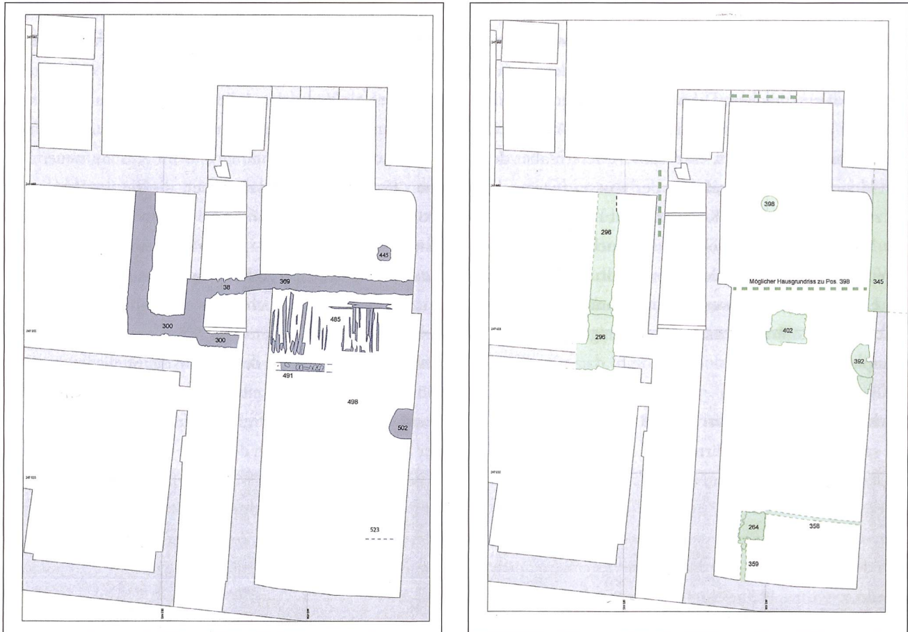
3: Zürich-Mühle gasse 5. Im mittleren 11. Jh. (Siedlungsphase 3, Plan links) entsteht ein eingeschossig gemauerter Steinbau, der bereits die Ausrichtung der spätmittelalterlichen Nachfolgebauten vorwegnimmt. Die älteste, bis heute im Untersuchungsperimeter bestehende Brandmauer stammt aus der 2. Hälfte des 12. Jh. Sie gehört zu einem Steinbau, der die östliche Parzellengrenze festsetzte (Siedlungsphase 8, Plan rechts, Nr. 345).