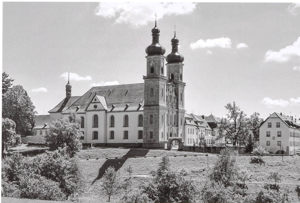
1: Kloster St. Peter im Hochschwarzwald auf einer modernen Aufnahme.

Historische Jubiläen werden gerne dazu genutzt, um das entsprechende Ereignis oder den geschichtlichen Einschnitt mit einer Jubiläumsausstellung zu würdigen. Auch das Jahr 1218, das mit dem Tod Herzog Bertolds V. das Ende der Zähringerherrschaft in Südwestdeutschland und der westlichen Schweiz markiert, dient aktuell als Anlass, um der Geschichte der Dynastie und der Herrschaft der Zähringer zu gedenken. Eine vom Alemannischen Institut in Freiburg i.Br. initiierte und von der Sparkasse Freiburg gesponserte Zähringer-Ausstellung wird ab Herbst 2018 durch verschiedene Zähringerstädte in Deutschland und der Schweiz touren. Diese ganz auf Text-Tafeln reduzierte und ohne Sachexponate auskommende Ausstellung ist in gewisser Hinsicht das Abfallprodukt eines grösseren musealen Projekts, das leider nicht realisiert werden konnte und das in dieser Form wenigstens ansatzweise gerettet werden kann.