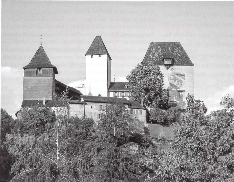
4: Burgdorf, Vorort der zähringischen Herrschaft im Rektorat Burgund.

folgende Präsentation das «Haus» bestimmen müssen: kurze prägnante Texte mit den Grundinformationen, Faksimile einiger bedeutender Urkunden, sehr gute fotografische Reproduktionen von Städten, Gebäuden oder Skulpturen, Karten mit grafischer Aufbereitung, interaktive digitale Animationen und nicht zuletzt kurze oder längere Filmsequenzen.