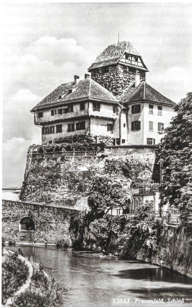
1: Schloss Frauenfeld von der Südostseite her mit Abortanbau von 1834 rechts im Bild. Bauliche Massnahmen begleiteten die Umnutzung Schloss Frauenfelds als Verwaltungsgebäude. Im ostseitigen Anbau befinden sich heute die Büros des Historischen Museums Thurgau.

Der junge und finanziell schwache Kanton musste nach seiner Bildung 1803 eine effiziente Verwaltung aufbauen, welche nach entsprechenden Räumlichkeiten verlangte. Auch die Zahl der Beamten stieg stetig. Da der Kanton bei seiner Gründung nur gerade über 20'000 Gulden, die im Kloster Paradies angelegt waren, sowie über das Schloss Frauenfeld an Liegenschaften verfügte, wurde Letzteres als Verwaltungsgebäude umgenutzt. 1803 hielten Wohnungen sowie das Appellationsgericht im Schloss Einzug, von 1808 bis 1811 diente es als provisorische Arbeits- und Zuchtanstalt. 1812 richtete sich die Finanzkommission im Schloss ein. Östlich am Turm entstand ein mehrgeschossiges Gebäude (Abb. 1), das