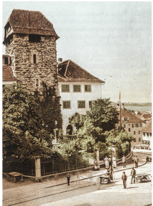
3: Schloss Frauenfeld mit üppigem Vorgarten, um 1900. Seit dem Kauf von Schloss Frauenfeld durch die Familie Bachmann wurde dieses von Bäumen und Sträuchern gesäumt, sogar der Bergfried war bewachsen.