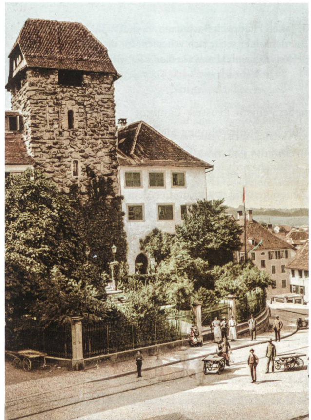
3: Schloss Frauenfeld mit üppigem Vorgarten, um 1900. Seit dem Kauf von Schloss Frauenfeld durch die Familie Bachmann wurde dieses von Bäumen und Sträuchern gesäumt, sogar der Bergfried war bewachsen.