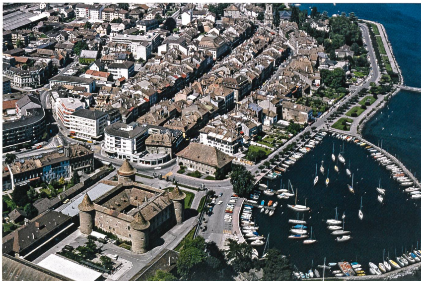
Morges 1975

Dès 1932, le château abrite le Musée militaire vaudois qui possède de riches collections. La visite comportera deux volets: l'une se concentrant sur le monument historique lui-même, l'autre sur l'exposition temporaire dédiée à «La fille du pape», Marguerite de Savoie. Née en 1420 au château de Morges, elle est la