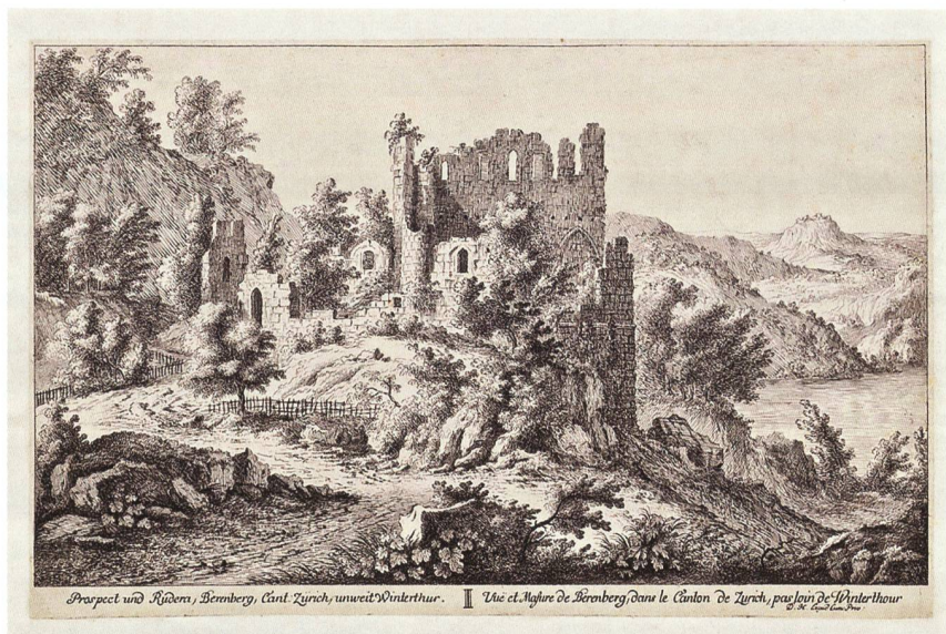
Beerenberg. Stich von Herrliberger, nach einer Vorlage um 1700.