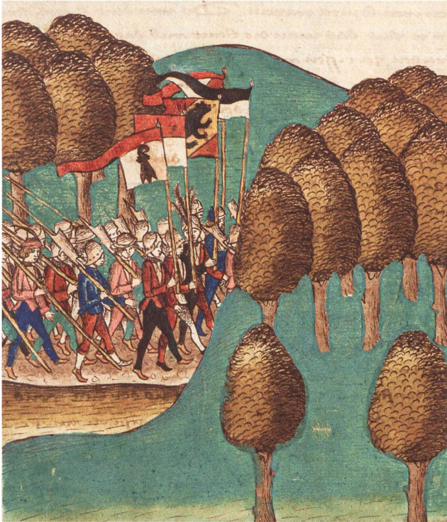
4: Die Bündnisse als Grundlage der militärischen Stärke: Ein vereintes Heer unterwegs im Blamontierzug (Juli/August 1475). Illustration in der Burgunderchronik von Diebold Schilling.

bürgern in Zürich das Bürgerrecht «gratis» als Belohnung für geleistete Kriegsdienste. 10 Umgekehrt stellten gerade finanzkräftige Städte, die nur über ein kleines Territorium verfügten – Basel und Genf zum Beispiel –, schon früh und auf der Basis von auf Lebenszeit geltenden Verträgen auswärtige «Stadtsöldner» ein, die Schutz- und Polizeiaufgaben übernahmen. 11