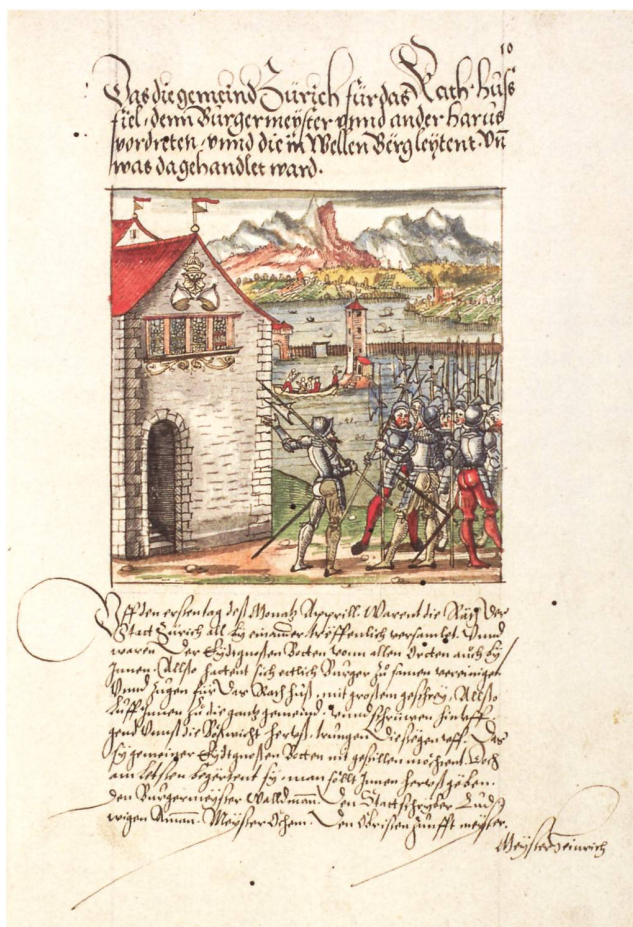
3: Die Stadtgemeinde als Wehrgemeinschaft: Versammlung bewaffneter Bürger im Aufstand gegen Hans Waldmann in der Darstellung der zweiten Hälfte des 16. Jh. Illustration in der Silberysen-Chronik von 1572.

seits den Aufruf zum persönlichen Einsatz. Die beiden Aspekte ergänzten sich gegenseitig. Nur wer physisch dazu fähig war, konnte persönlich Wachdienste übernehmen und in den Krieg ziehen. (Vermögende) Frauen, Kleriker, aber auch Männer, die aus geschäftlichen Gründen abwesend waren, erfüllten ihre «Reispflicht» durch die Ausleihe von Rüstungen und indem sie einen Söldner bezahlten. 5 Zahlreiche Satzungen, die sich von Stadt zu Stadt unterscheiden, formulieren Ausnahmen, etwa, dass ein Mann, dessen Frau vor der Niederkunft stand, von einem aktuellen Aufgebot ausgenommen wurde. 6 Grundsätzlich musste aber auch während eines Kriegs die städtische Wirtschaft weiter funktionieren. Typisch ist deshalb, dass der militärische «Auszug» von Stadtbewohnern in der Regel höchstens einen Drittel der Wehrpflichtigen umfasste und dass die Einsatzzeit be-