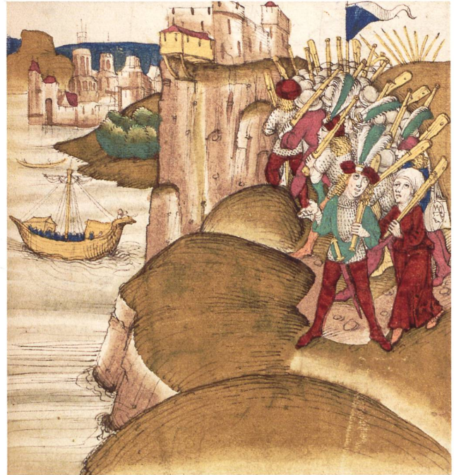
7: Frauen zogen, zumindest bis zur Reformation, mit den städtischen Heeren mit. Illustration in der Spiezer Chronik von Diebold Schilling.

schaftlich fundierte Pflicht hinaus: Gegen Ende des 15. Jh. hatte ein beliebiger Stadtbürger oder Landmann zudem die Wahl, ob er anstelle eines Mitbürgers, als städtischer Söldner ausserhalb des für ihn vorgesehenen Aushebungsdrittels, im Rahmen einer obrigkeitlich gestützten bzw. bewilligten Werbung oder auch auf dem «freien Markt» – mit oder ohne Erlaubnis seiner Obrigkeit – seine Kampfkraft verkaufen wollte. Dieses Geschäft mit der Gewalt als Teil individueller Lebensgestaltung ist über die vom städtischen Rat ausgehende Schriftlichkeit schlecht zu erfassen, 20 wird jetzt aber in einem neu entdeckten, von 1503 bis 1583 reichenden militärischen Verwaltungsbuch der Zürcher Gesellschaft zur Constaffel 21 gut sichtbar: 1512 beispielsweise, vor dem Auszug im Dienst des Papsts zum sogenannten Grossen Pavierzug, zahlte Zürich seinen Leuten im Voraus den Sold von 9 Pfund für zwei Monate. Sollte der Papst aber seinerseits die Leute besolden, so hatten diese bei der Rückkehr zwei Möglichkeiten: Erstens konnten sie das vom Papst erhaltene Geld der Constaffel übergeben und sich somit ihrer bürgerlichen Reispflicht erledigen. Oder sie konnten den Sold des Papstes behalten, dafür jedoch den städtischen Vorschuss der Constaffel zurückgeben. Damit stünde aber