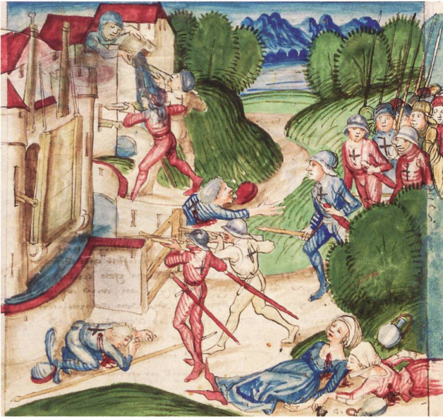
6: Auf eigene Faust wollte ein Trupp Männer und Frauen Schloss Schweighausen im Sundgau plündern. Beim Angriff wurden einige getötet. Illustration in der Berner Chronik von Diebold Schilling.