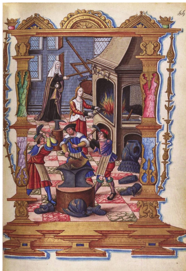
2: Das städtische Gewerbe ist zunehmend auf den Krieg ausgerichtet. Darstellung einer Rüstungsschmiede. Abbildung in einer französischen Chronik des frühen 16. Jh.

werbes auf die Bedürfnisse der Kriegführung aus. Besonders wichtig waren dabei das Metallgewerbe (von den Drahtmachern bis zu den Huf- und Helmschmieden), das Stoff- und Ledergewerbe sowie die Seilerei (u. a. Herstellung von Zelten, Innenfutter von Helmen, Gambeson und anderer aus Stoff gefertigter, «kriegstauglicher» Unterkleidung, Riemen, Seile usw.), zunehmend das Holzverarbeitende Gewerbe und die Giesserei (u. a. für alle Holzteile von Kanonen, Bliden und anderen Wurfmaschinen, Springolfe, Hakenbüchsen und Armbrüste oder auch für Belagerungsleitern oder Transportfässer). Von der Kriegstätigkeit profitierten aber etwa auch Apotheker, die Ingredienzien für Schiesspulver herstellten, dieses veredelten und vermittelten, Lebens-