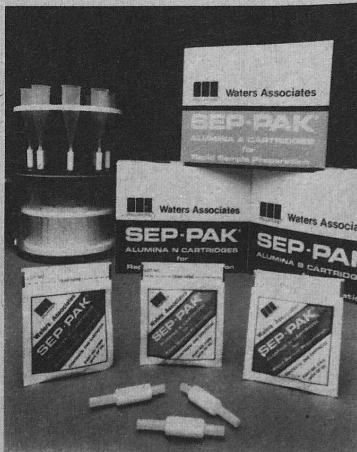
Order Information SEP-PAK Cartridges Boxes of 50

Spectrophotometry: Spectrometry: Chromatography: Chemistry: Biology: