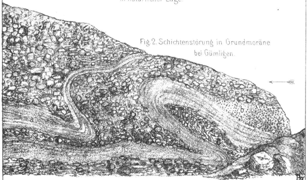
Fig. 2. Schichtenstörung in Grundmoräne bei Gümligen.