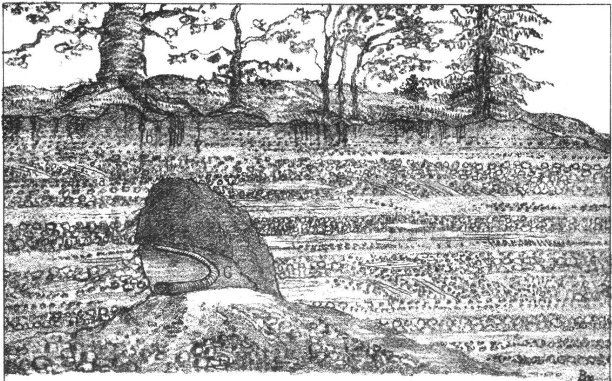
Fig. 1. Kiesgrube am Ramisberg (Emmenthal) mit Mammuthzahn (C) in natürlicher Lage.