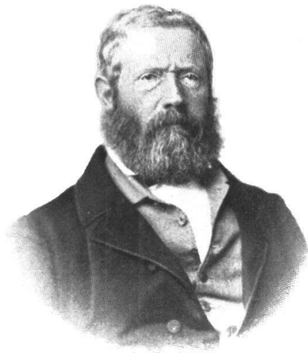
Gustav Otth 1806—1874