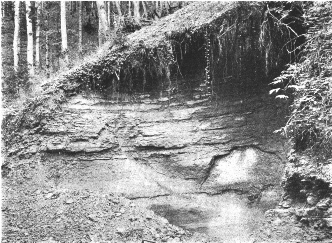
Abb. 2. Hauptansicht.