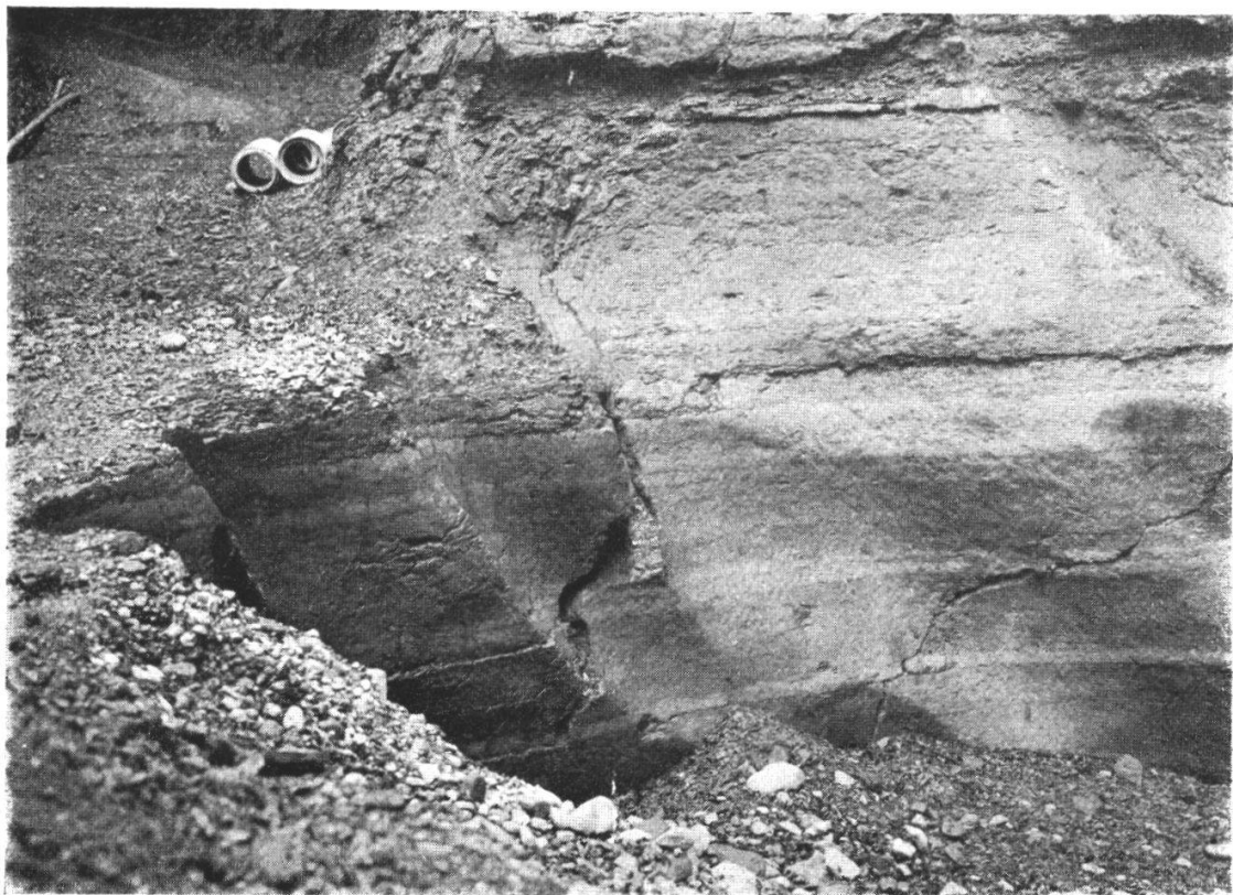
Abb. 3. Linke Seite. Strudelgewinde.