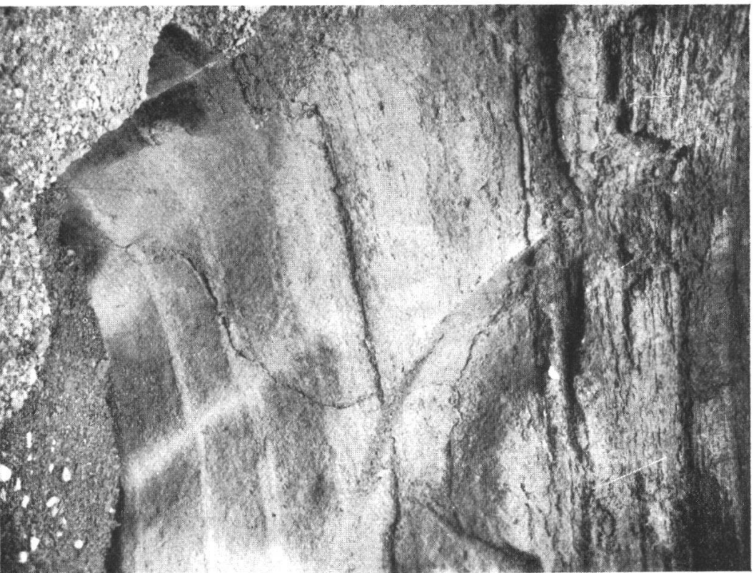
Abb. 4. Linke Seite. Strudelgewinde.