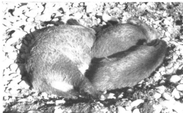
Abb. 2. Beispiel für typisches Kontaktverhalten: Ruhende Wildschweine im Lager; maximale körperliche Berührung.