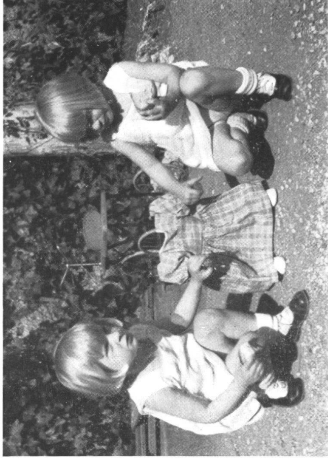
Abb. 3. Kinder (3 \frac{1}{2} jährige Mädchenzwillinge) beim Vermenschlichen eines Fußschemels. Für den Erwachsenen mit seiner gegenüber dem Kinde stark verminderten Vermenschlichungstendenz hat dieses Objekt zunächst nichts Menschenähnliches — erst nach der puppenartigen Verkleidung. (Aufn. Hediger.)