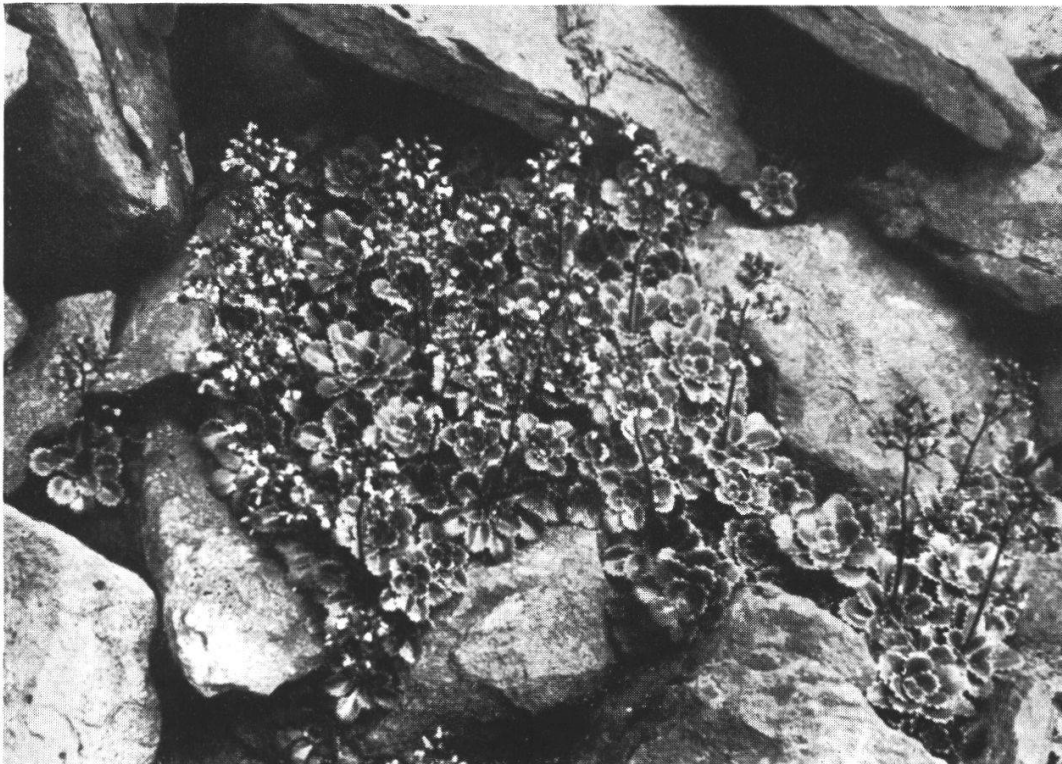
Saxifraga spathularis am Aufstieg zum Carantuohill oberhalb Coomloughra (Co. Kerry, Irland)