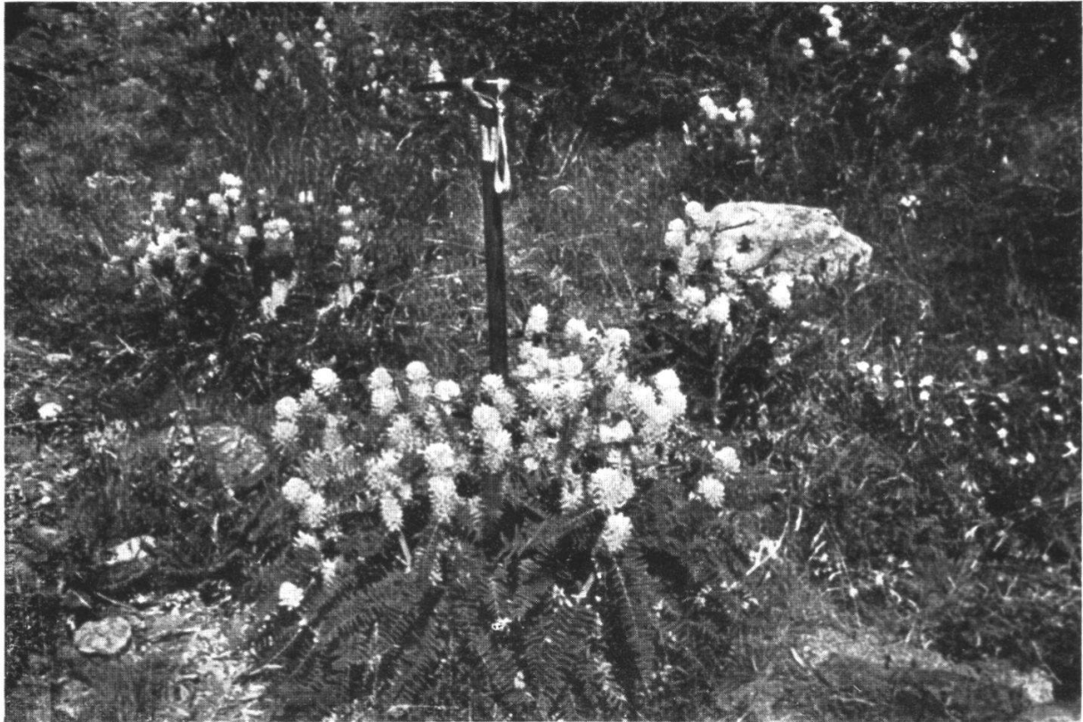
Astragalus alopecuroides L. im Cognetal