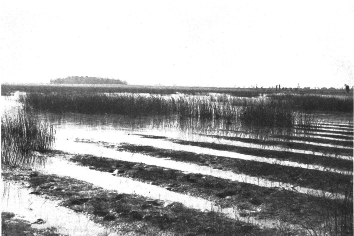
L'Etang du Gd. Birieux

südlich von Villars-les-Dombes im Spätsommer. Der Wasserstand nimmt bereits ab und die Ackerfurchen des Vorjahres tauchen wieder auf.