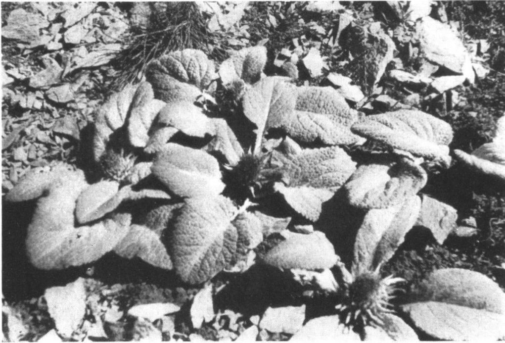
Berardia lanuginosa In Kalkgeröllhalden am Col de la Cayolle, Hautes Alpes. (Zum Referat Seite XLII)