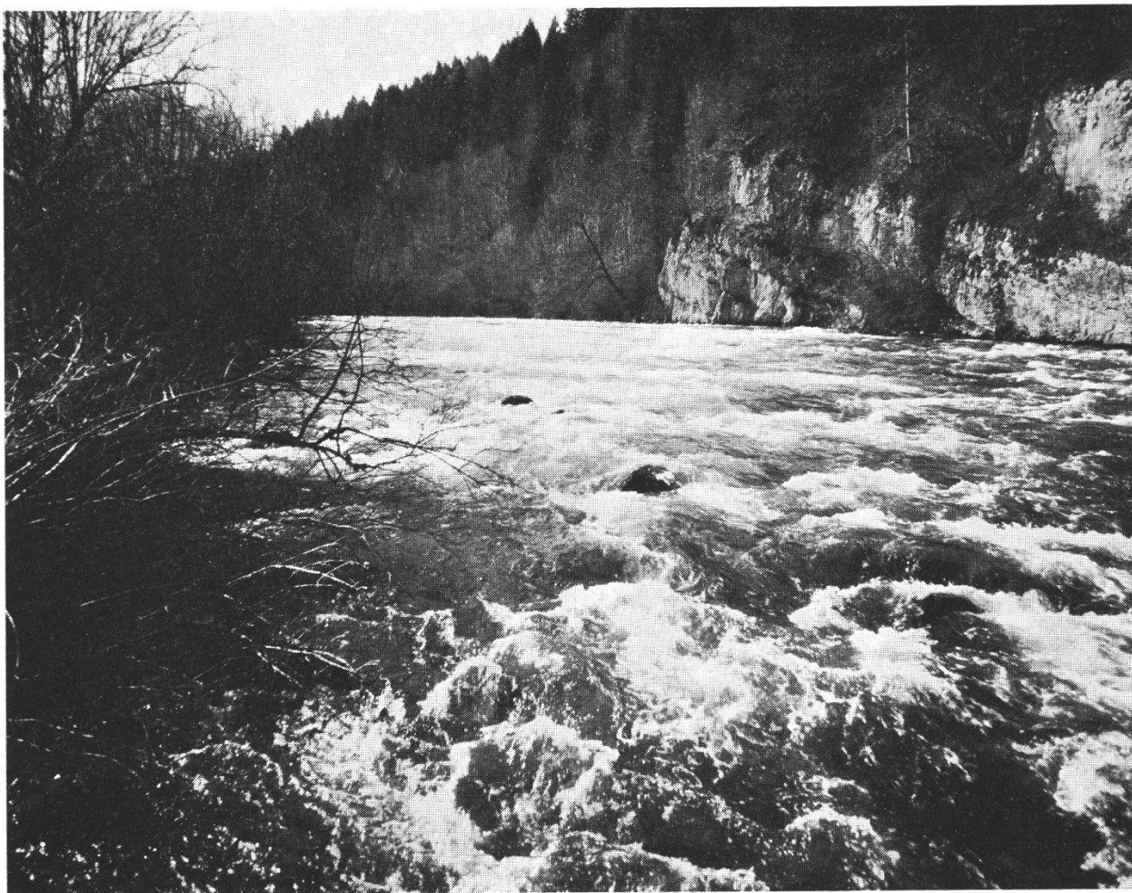
Abb. 2 Während der Doubs auf langen Strecken sanft und ruhig dahinfließt, bietet er unterhalb Soubey ein reizvoll bewegtes Bild. Das hier vorhandene größere Gefälle wäre für die Krafterzeugung vorteilhaft gewesen . . . Heute sind wir dankbar, daß kein Aufstau erfolgt und das lebendige Wasser erhalten geblieben ist.

zugehörigen Ufergelände umfaßt. Dabei sollen einerseits geeignete Gebiete größeren Ausmaßes einbezogen werden, wobei landschaftliche Gründe oder die Rücksicht auf die Flora und den Lebensraum der freilebenden Tierwelt bestimmend sein können; andererseits soll im Bereich der Ortschaften das Schutzgebiet so begrenzt sein, daß eine normale bauliche Entwicklung möglich bleibt.