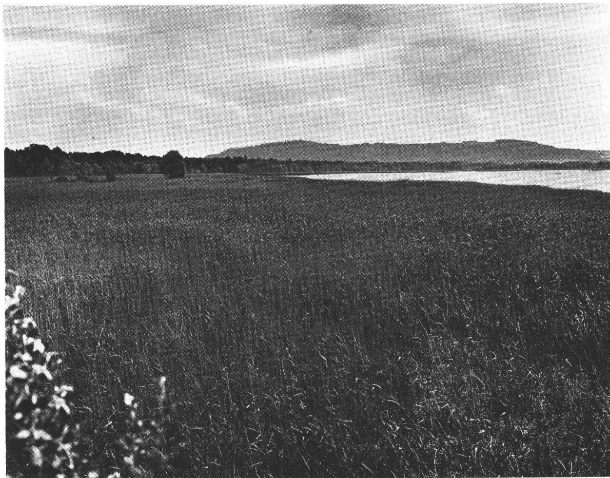
Abb. 1 Das Naturschutzgebiet Fanel. Die Aufnahme zeigt im Vordergrund das große Schilffeld am nordwestlichen Rand, dahinter den Strandwald und im Hintergrund den Wistenlacherberg (Mont Vully). Der große Campingplatz — in der Bildmitte zwischen See und Strandwald — tritt nicht in Erscheinung, weil er durch den unversehrt gebliebenen Ufergehölzgürtel abgeschirmt ist.

der Staat vorher eine kostspielige und äußerst unerfreuliche Säuberungsaktion gegen eine ‚Kulturwüste‘ vornehmen oder entsprechende Vorkehrungen treffen mußte. Lange bevor das Gebiet unter Naturschutz gestellt wurde, haben die Staatsforstverwaltung und der TCS Landschaftsschutz und Naturschutz getrieben im Dienste des Menschen, ohne ihn daraus zu verdrängen.»