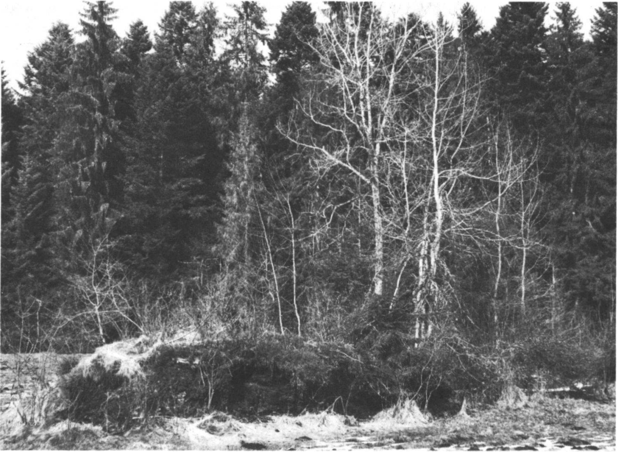
Abbildung 6: Torfsockel im Wacheldornmoos als Zeuge der Vegetationsgeschichte und als spezieller Lebensraum für Pflanzen und Tiere. 4. März 1979