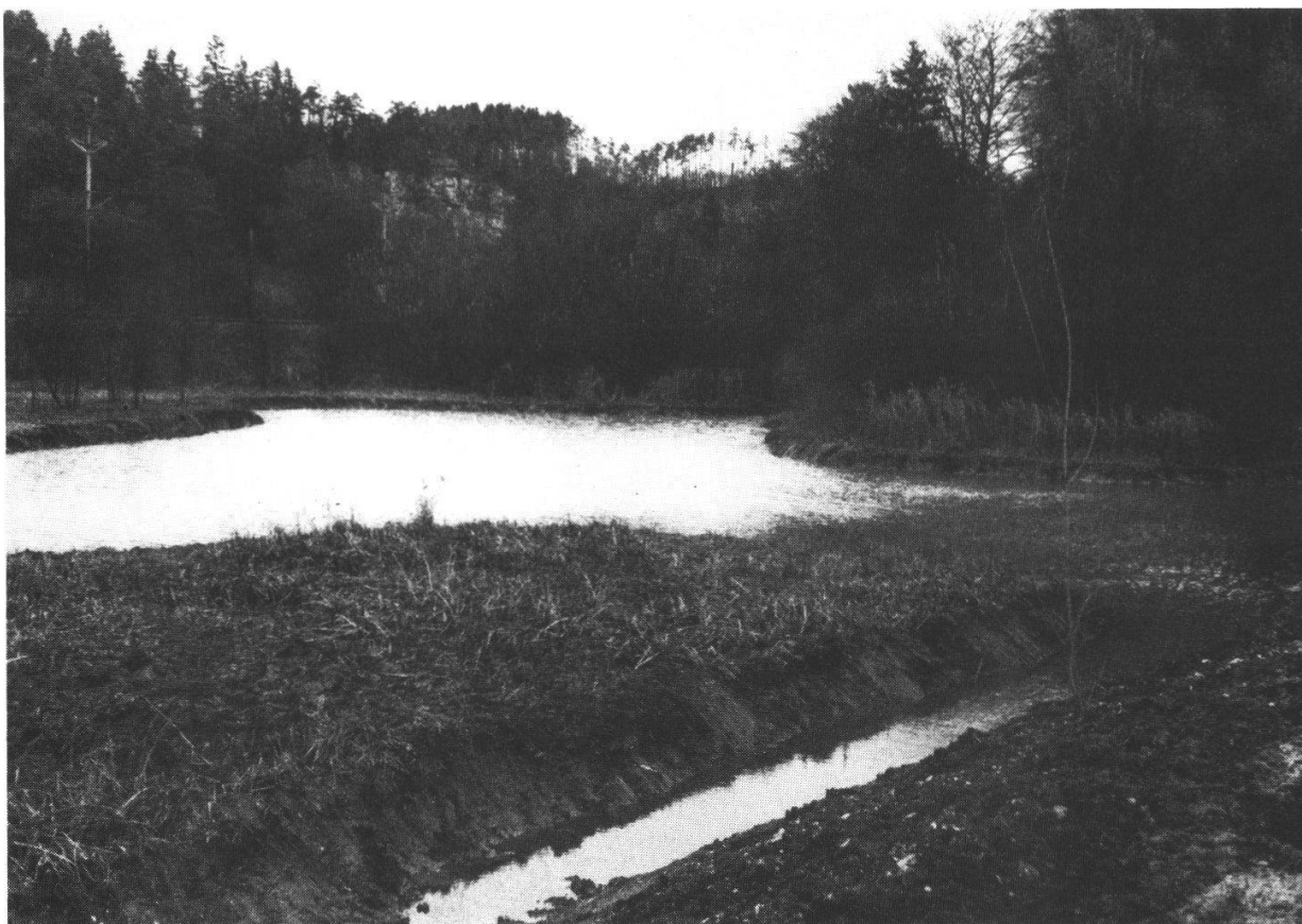
Abbildung 1: Naturschutzgebiet Birshollen, Laufen. Nach den Aushubarbeiten ist eine Wasserfläche von rund 35 a entstanden. Die natürliche Besiedlung durch Wassertiere und -pflanzen hat im Frühling 1978 bereits kräftig eingesetzt. Aufnahme R. Hauri, 24. November 1977

Heute zeigt sich nun wieder eine offene Wasserfläche von rund 35 Aren. Schon 1978 stellte sich das Teichhuhn als Brutvogel ein und Stockenten wurden oft beobachtet. An weitem, im Naturschutzgebiet "Birshollen", angetroffenen Vogelarten verdienen die Dorngrasmücke und die Weidenmeise besondere Erwähnung. Es besteht kein Zweifel, dass sich in kurzer Zeit erneut eine reichhaltige Tier- und Pflanzenwelt feuchter Zonen entwickeln wird. Ein Feuchtbiotop im Laufental ist als besonders wertvoll zu betrachten, da in dieser Gegend stehende Wasserflächen und Sumpfbiete aus geologischen Gründen ausserordentlich selten anzutreffen sind.