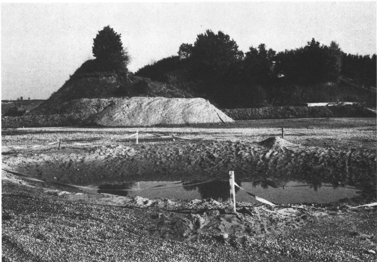
Abbildung 3: Naturschutzgebiet Waldgasse bei Schwarzenburg. Zustand nach Vornahme der Erdbehebungen im Oktober 1978. Die Feinarbeiten sind noch nicht ausgeführt. Im Vordergrund ein neuer Amphibienteich. Aufnahme R. Hauri, 24. Oktober 1978

Um einer möglichst grossen Zahl von Tier- und Pflanzenarten das Überleben zu sichern, wurde es unumgänglich, gewisse Veränderungen in der Grube vorzunehmen. In Zusammenarbeit mit dem Amphibienspezialisten K. GROSSENBACHER, Riggisberg,