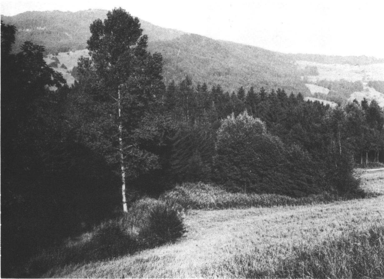
Abbildung 2: Naturschutzgebiet Längmoos, Forst. Uferwald und Riedwiese gegen Nordwesten, im Hintergrund der Gurnigel. Am rechten Bildrand Standort des künftigen Teiches. Aufnahme R. Hauri, 15. August 1978