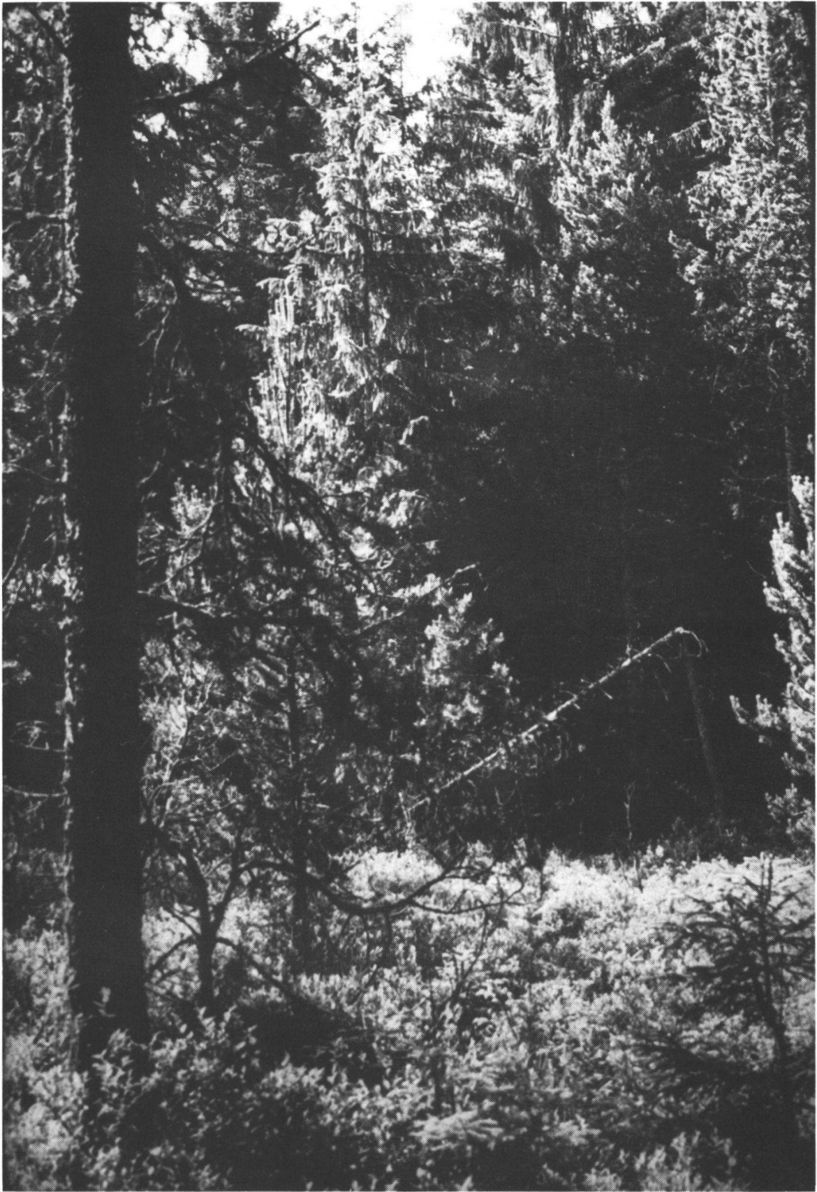
Abbildung 4: Moorwald im Wachseldornmoss. Aufnahme D. Forter, 7. Juli 1977