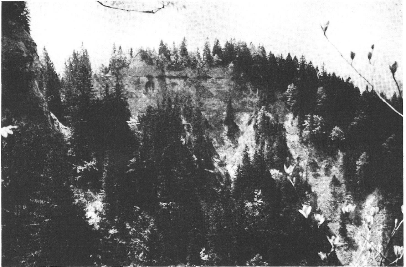
Abb. 15: Der Kessel der Geissgratflue mit den Nagelfluhfelsen. Lebensraum für Tiere und Pflanzen, die feuchte und schattige Lagen ertragen.