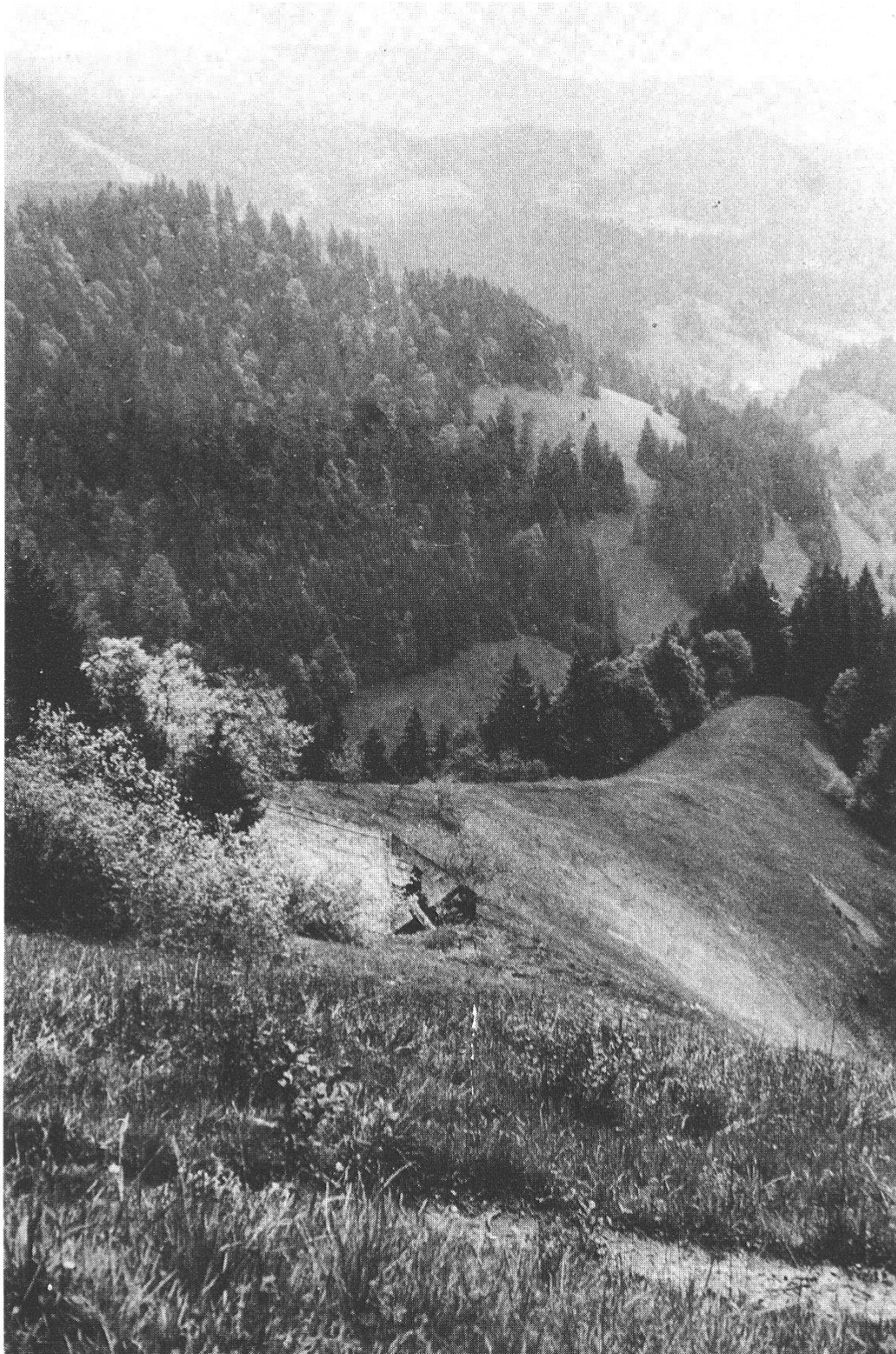
Abb. 16: Das Goldbachschwändeli , nach Südosten geneigt und gut besont, eine Naturwiese, Lebensraum für wärmeliebende Arten.