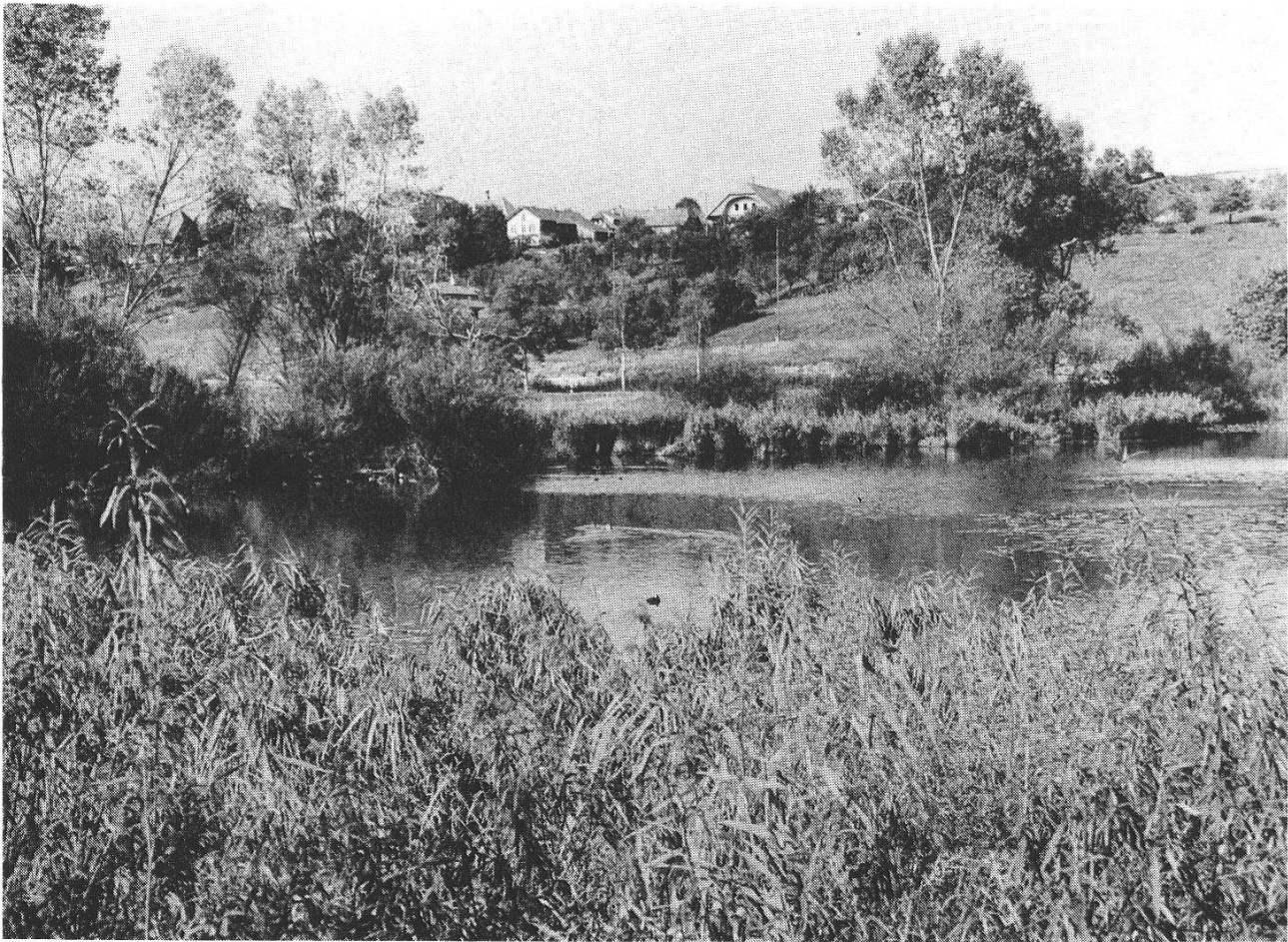
Abb. 14: Kleiner Mossee von SW her. In der stark besiedelten Landschaft sind solche Lebensräume besonders wertvoll.