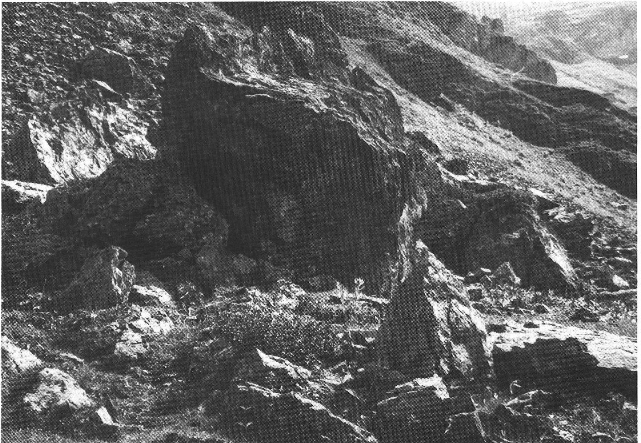
Abb. 1: Oberdüdenalp im Kiental: der Dogger-Felsblock. Standort der Woodsia alpina .

Der zierliche Farn Woodsia alpina hat, wie R. SUTTER (Ber. Schweiz. Bot. Ges. 1977) zeigte, sein Hauptverbreitungsgebiet in der Schweiz in den südlichen und östlichen Silikatketten der Alpen. Die Funde in den Nordalpen werden gegen Westen zu immer spärlicher. Im Berner Oberland sind nur noch vereinzelte Standorte im Lauterbrunnental, im Kiental und im Gasterntal bekannt (Abb. 1).