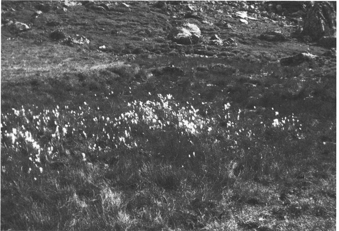
Abb. 3: Kleiner See. Oben rechts der Woodsiablock. Vorn die Verlandungszone mit Eriophorum Scheuchzeri .