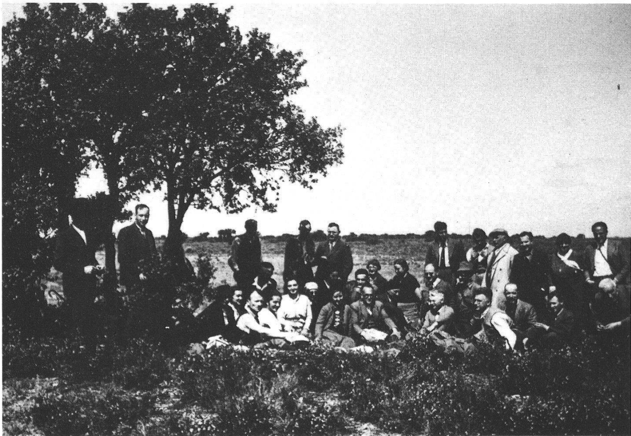
Abb. 1: Exkursion der SIGMA nach Katalonien 30. März bis 10. April 1934

Dort beginnt der "Camino del Rey", ein nach Art der Walliser Bisses an der senkrechten Felswand angebrachter Fussgängersteg. Da er unbegehrbar war, folgten wir der Bahnlinie durch Tunnels und über Viadukte, bis wir auf einer Brücke die rechte Seite der Schlucht erreichen konnten. Unterwegs trafen wir u. a. Alkanna tinctoria und Convolvulus siculus . Am oberen Ausgang der Schlucht blühten Allium roseum , Ophrys lutea , Jasminum fruticans , Anthyllis tetraphylla . Auf gutem Strässchen stiegen wir zum Stausee (Embalse del Guadalhorce, 350 m) empor. Ein Sessel aus Stein erinnert an dessen Einweihung durch König ALFONS XIII am 21. Mai 1921. Vergängliche Frühjahrsblüher wie Dipcadi serotinum , Tuberaria guttata , Omphalodes linifolia grüssten am Weg zum Puerto de las Atalayas.