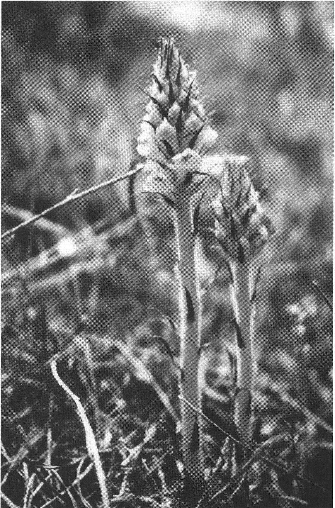
Abb. 3: Orobanche densiflora Reuter Pinienwald bei Barbate de Franco (Cádiz) Foto H. Frey, 1. Mai 1980