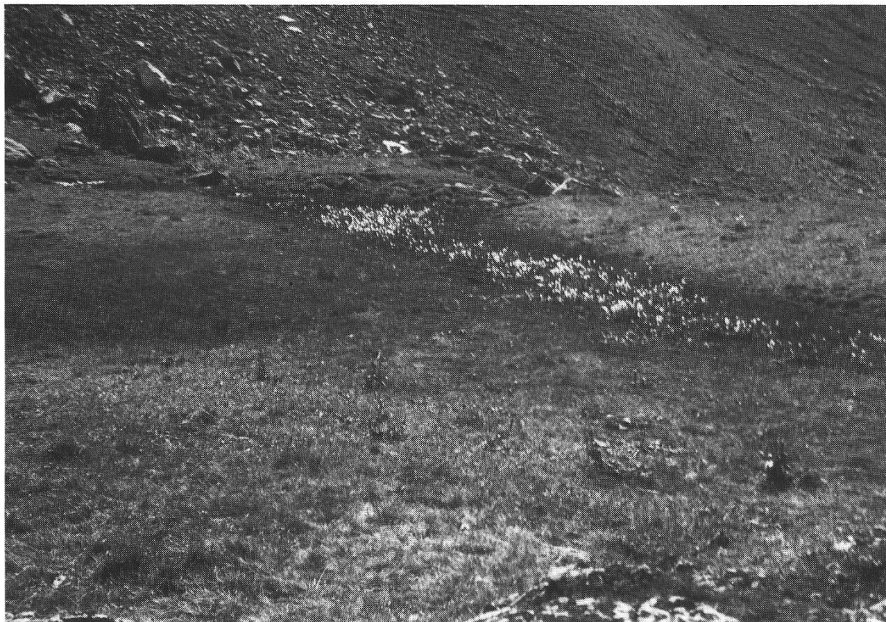
Abb. 2: Oben links der Felsblock mit der Woodsia , davor See und Verlandungszone. Vorn: Sphagnetum (Hochmoor).

Besuche der Woodsia -Standorte im Kiental ergaben interessante pflanzenökologische Beobachtungen. Der erstgemeldete Standort am Schersax auf Doggergestein (RYTZ sen. 1920) konnte zwar seither nicht mehr gefunden werden, wohl aber ein solcher im gleichen Hochtal an der Nordflanke des Dündengrates (1978), allerdings mit ganz wenig Exemplaren. Der reiche Standort auf der oberen Dündenalp bei 1950 m, ein grosser Felsblock in einer Schutthalde aus dunkelbraunem Doggergestein (Aalenien) trägt schöne Exemplare der Woodsia alpina . Beidseitig dieses kleinen Bergsturzgebietes liegen Blöcke aus hellgrauem Malmgestein mit ihrer charakteristischen Flora. Der dunkle Woodsia -Block ist stellenweise tapetenartig mit Flechten überzogen: Rhizocarpon geographicum , Caloplaca , Aspicilia u. a., ausserdem 17 species von Gefässpflanzen: