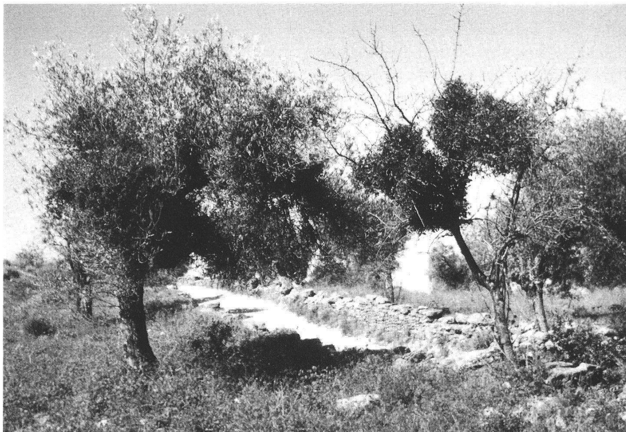
Abb. 2: Von Viscum cruciatum Boiss. befallene Ölbäume auf dem Pinienhügel westlich von Ronda (Ermita de la Cabeza). 28. April 1980

2. Ronda und Umgebung : Verlässt man die Altstadt im Süden durch die Puerta del Almocábar, erreicht man in einer Viertelstunde, unter Umgehung des vom Guadalevín durchflossenen Einbruchkessels, einen von Pinien gekrönten Kamm, an dessen Flanke die Ermita de la Cabeza liegt. Am 28. April 1980 fand ich dort die ungepflegten Ölbäume dicht von dem rotfrüchtigen Viscum cruciatum befallen (Abb. 2). Diese orientalische Art wurde nach MORITZ WILLKOMM wahrscheinlich durch die Araber nach Südspanien eingeschleppt. Dasselbst wuchs neben Cistus albidus , Quercus coccofera , Ulxe , Sarothamnus und einem grossen Echium ein einziges Sträuchlein von Halimium atriplicifolium .