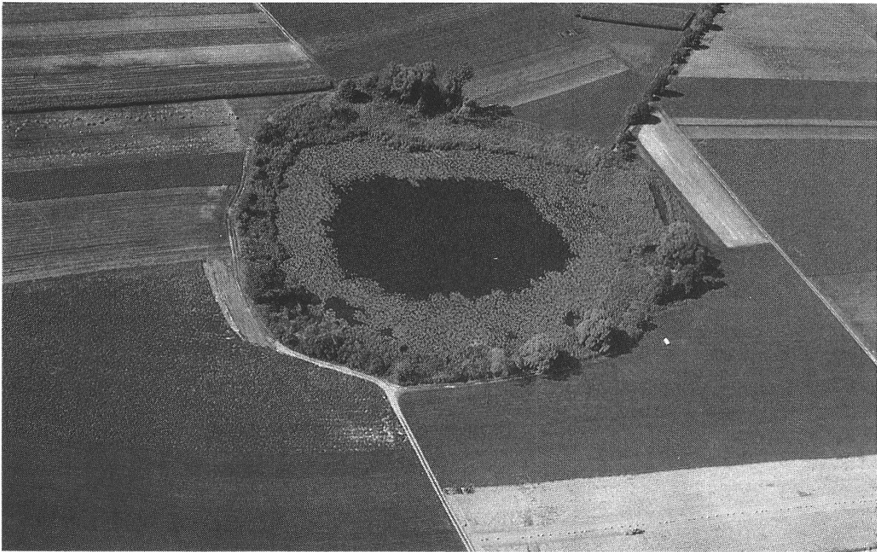
Abbildung 2: Lage des Lobsigensees im Kulturland. Vegetationszonierung von innen nach aussen: Seerosen, Schilf, Gehölze.