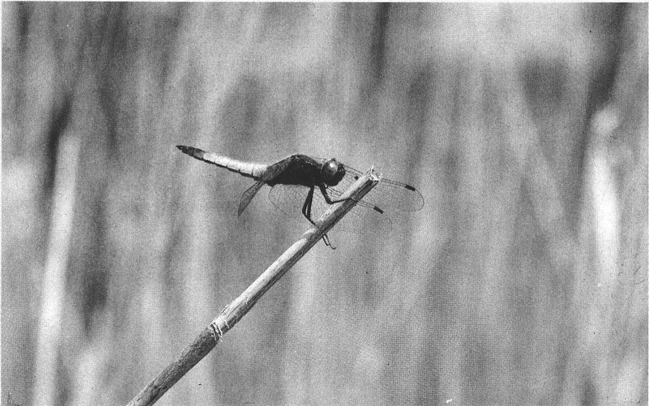
Abbildung 4: Adultes Spitzenfleck-♂. Die Art bildet am Lobsigensee die zahlenmässig stärkste Grosslibellen-Population.