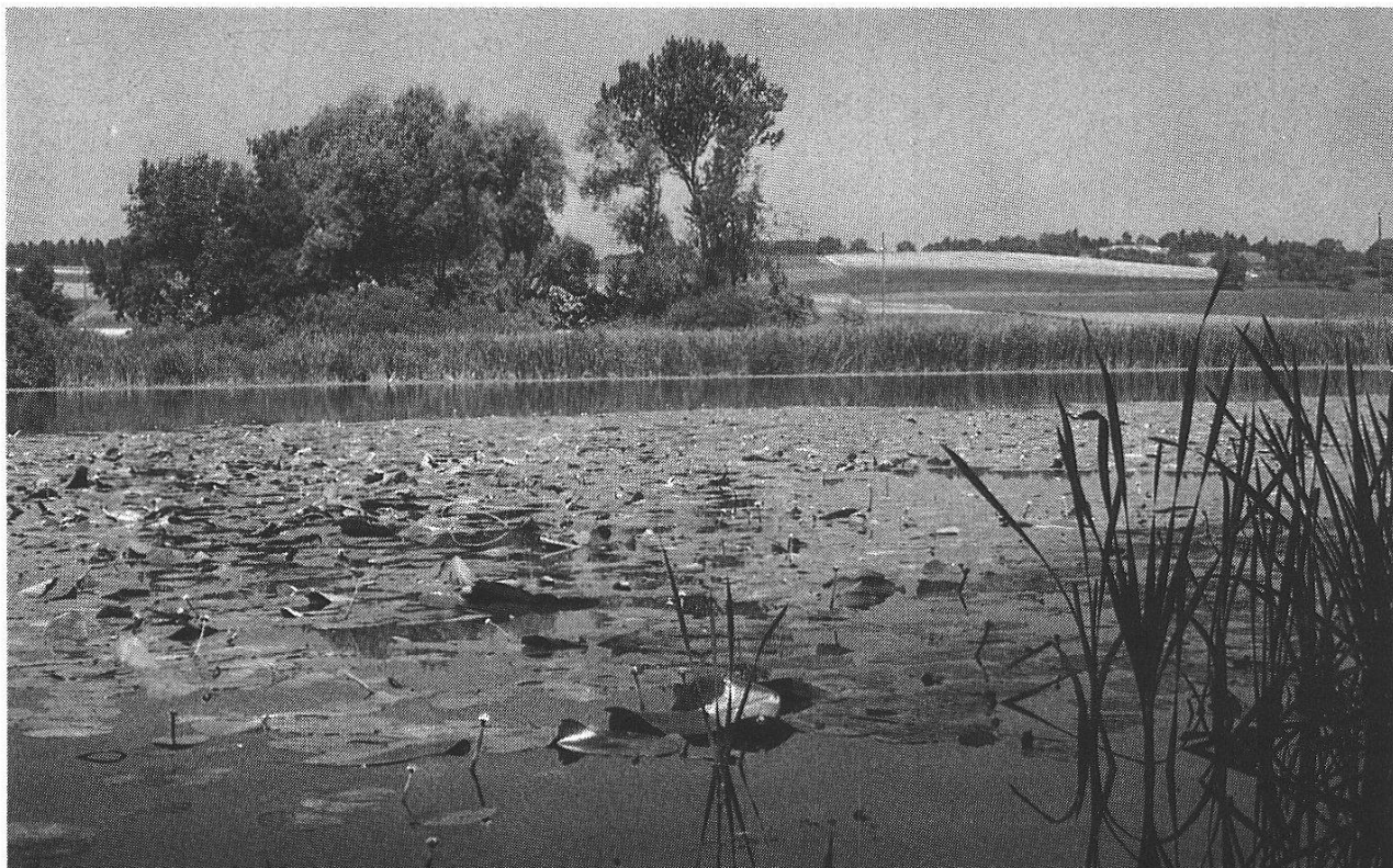
Abbildung 3: Blick auf den See. Kleinseen mit gut ausgebildetem Schilfgürtel sind der bevorzugte Biotop des ziemlich seltenen Spitzenflecks.