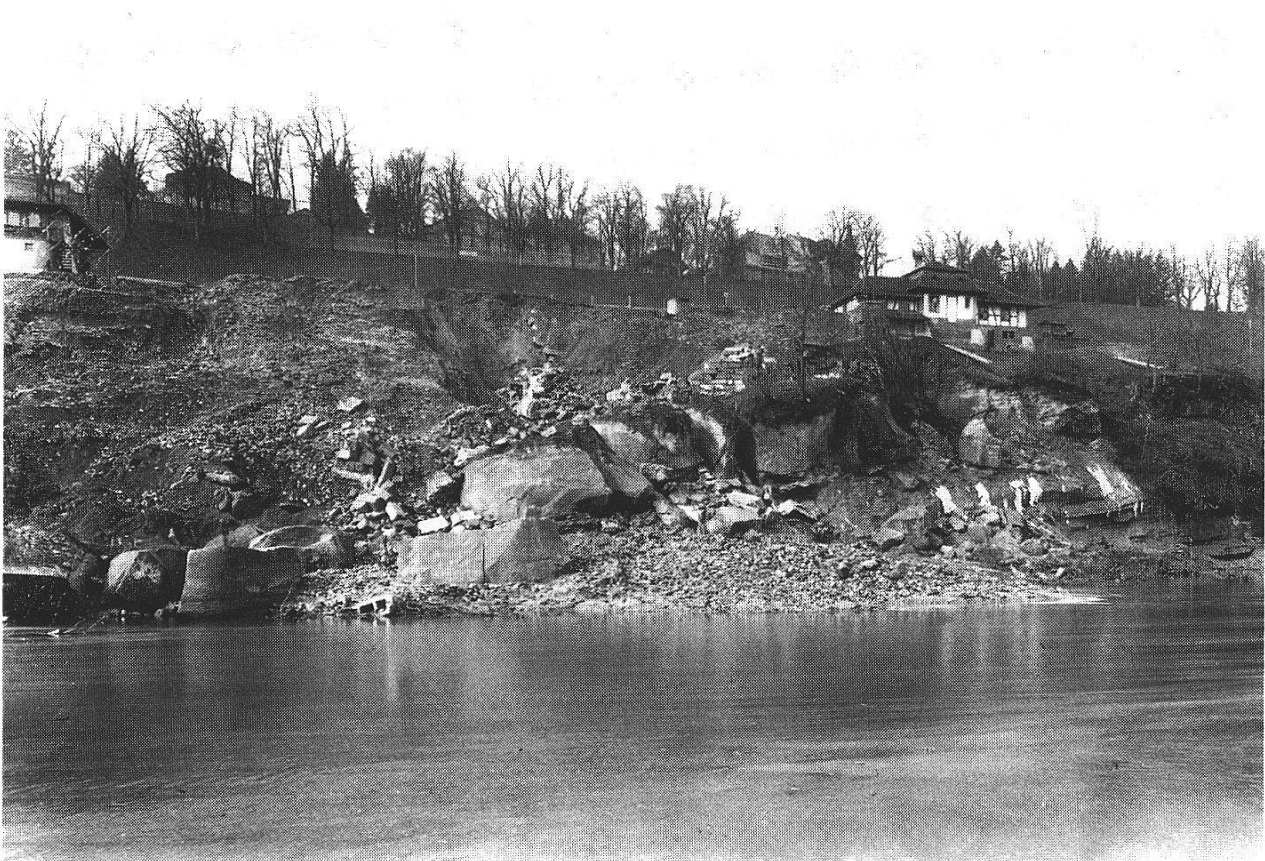
Textfigur 1: Felsrutsch Wasenmätteli (Engehalde) 18. 11. 1913.

Zwischen der Schützenmatte im Süden und der Aaregg im Norden der Engehalde haben sich in den letzten hundert Jahren mindestens an sechs verschiedenen Stellen Fels- oder Lockergesteinsrutschungen ereignet, die im Baugrundarchiv des Tiefbauamtes aktenkundig vermerkt sind, und deren Schäden die Millionen-Franken-Grenze zum Teil erheblich überschreiten. (Textfigur 1)