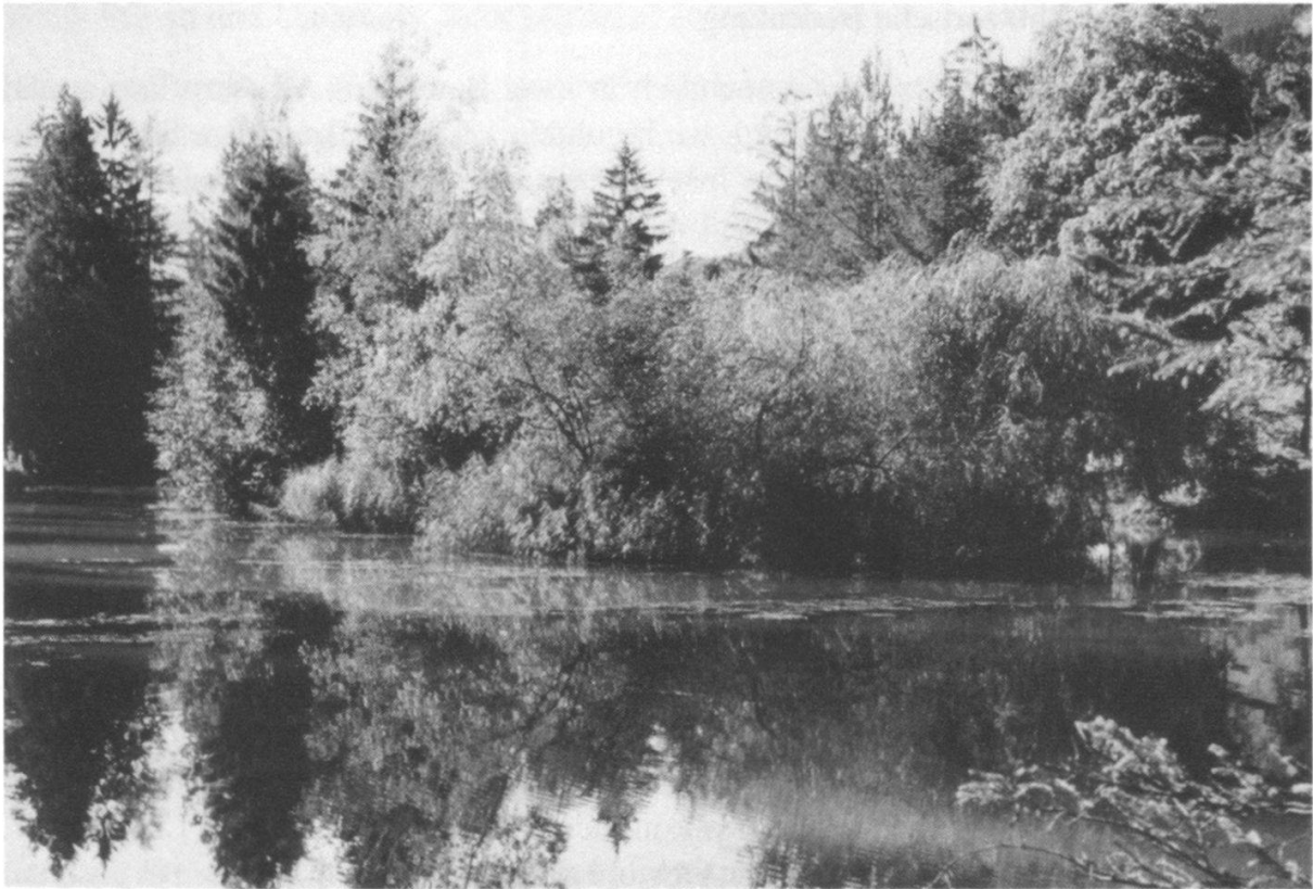
Abbildung 3: Forellensee Zweisimmen, Blick nach Südwesten (Foto R. Hauri, 1989).