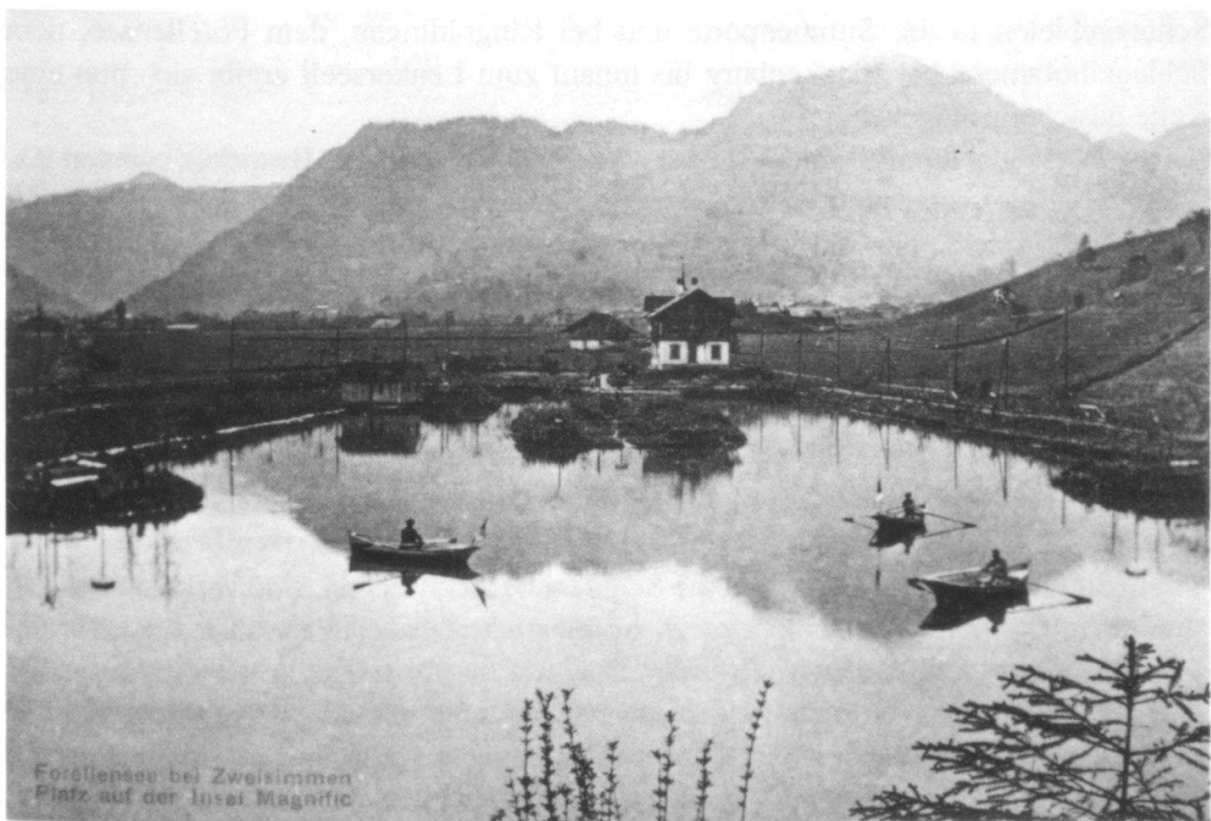
Abbildung 4: Forellensee Zweisimmen um 1906, nach einer alten Postkarte, Blick nach Süden.