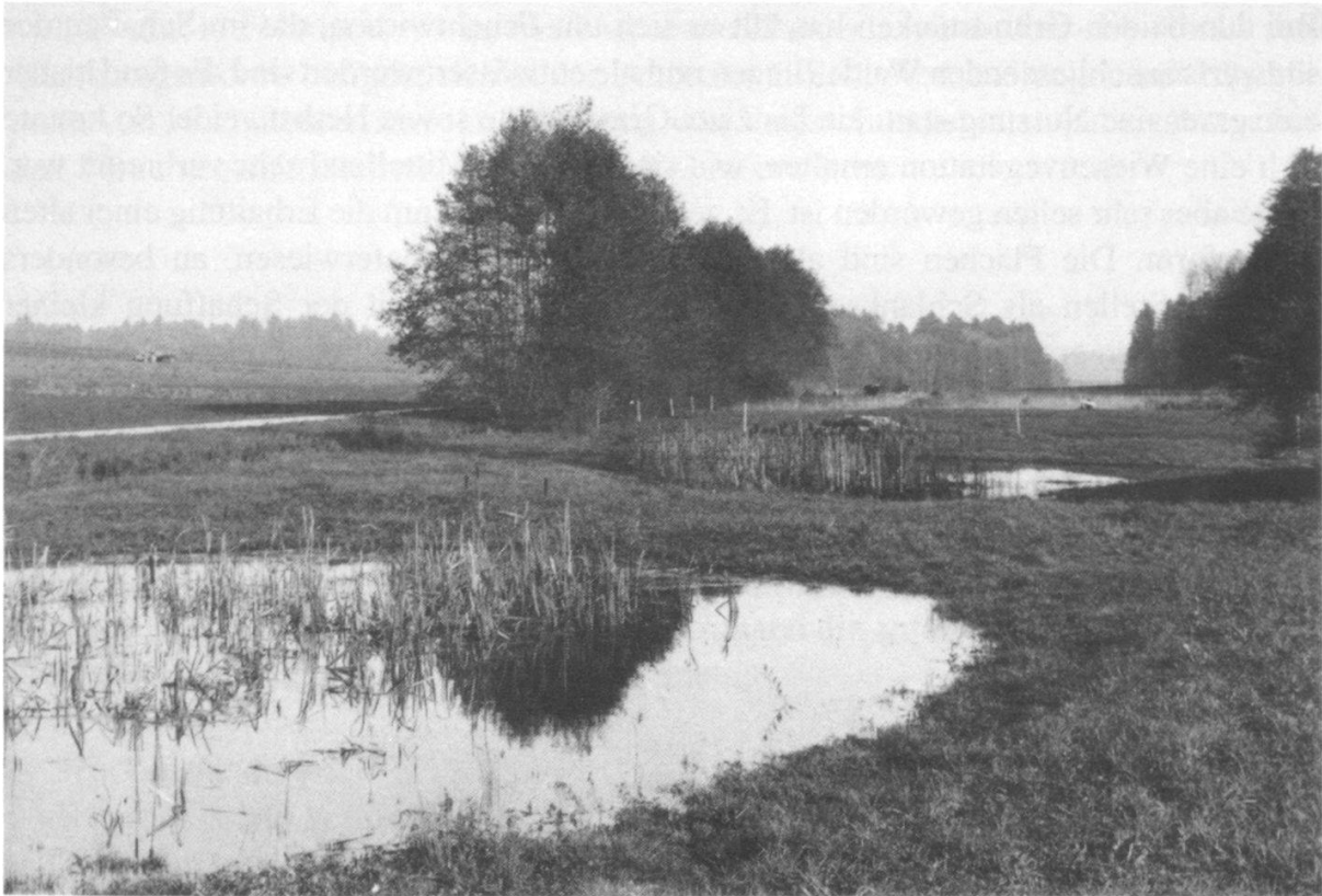
Abbildung 6: Längmoos Grossaffoltern, Blick nach Osten mit den neuen Teichen (Foto R. Hauri, 1992).