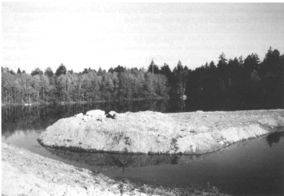
Abbildung 2: Baggersee Heimberg (Foto A. Knecht Roesti, 1992).