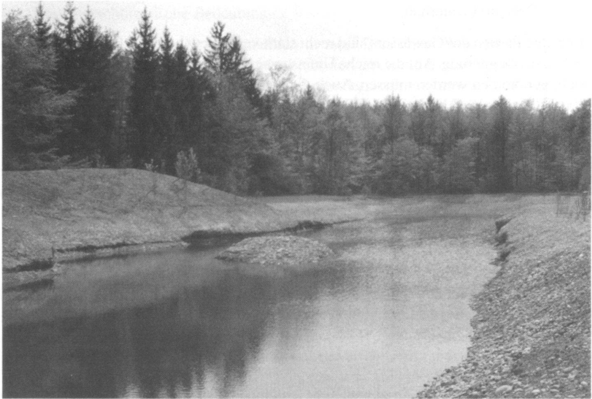
Abbildung 5: Giesse Sibirien.