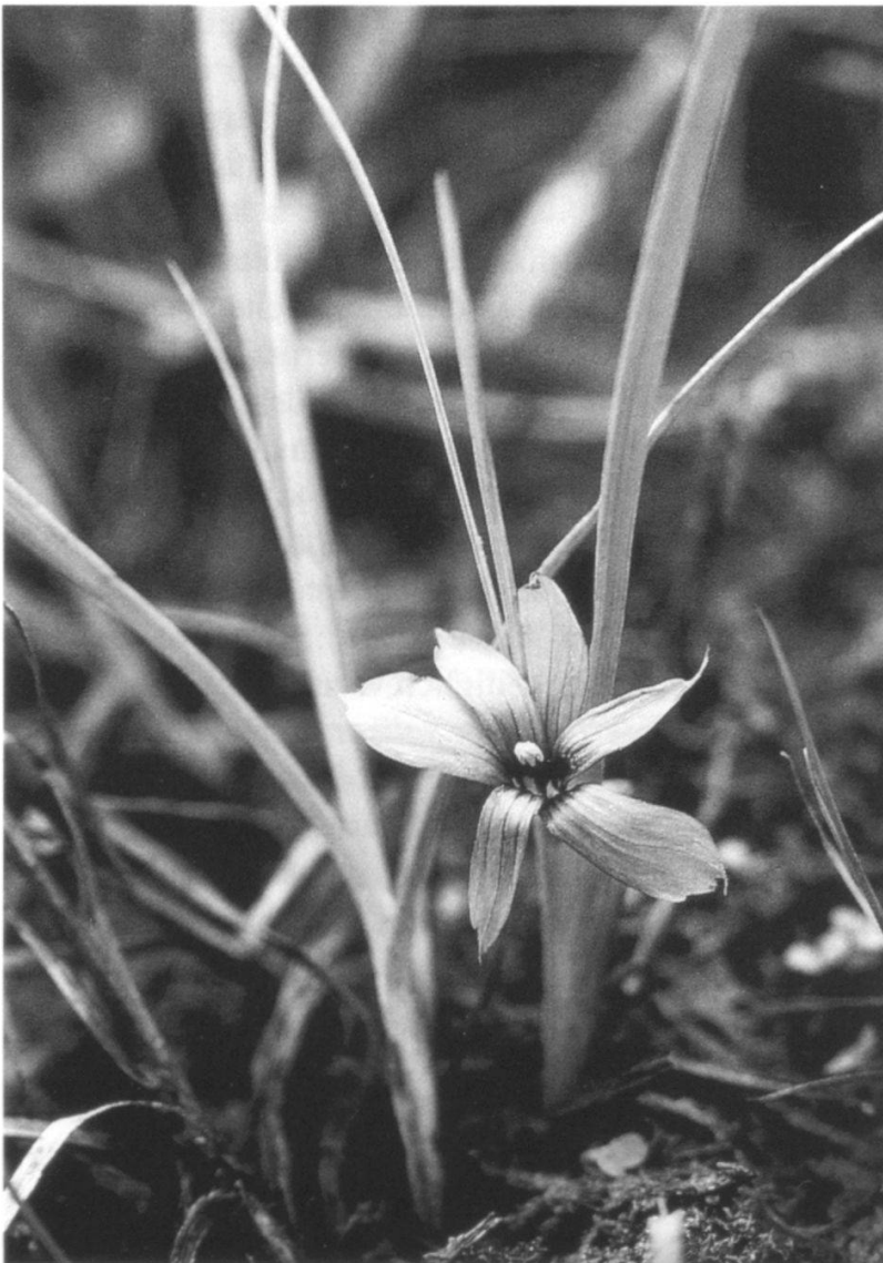
Abbildung 3: Sisyrinchium bermudiana