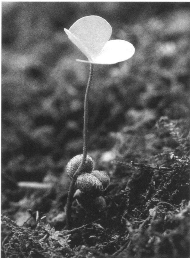
Abbildung 6: Marsilea quadrifolia