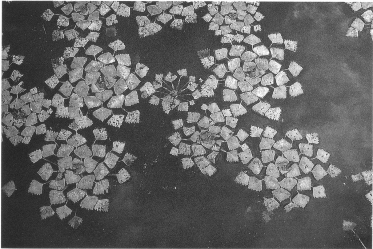
Abbildung 5: Trapa natans