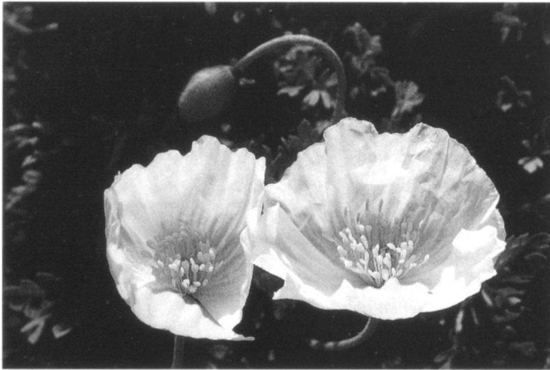
Abbildung 4: Papaver sendtneri