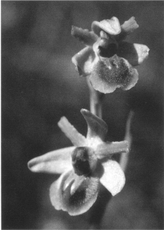
Abbildung 1: Ophrys araneola