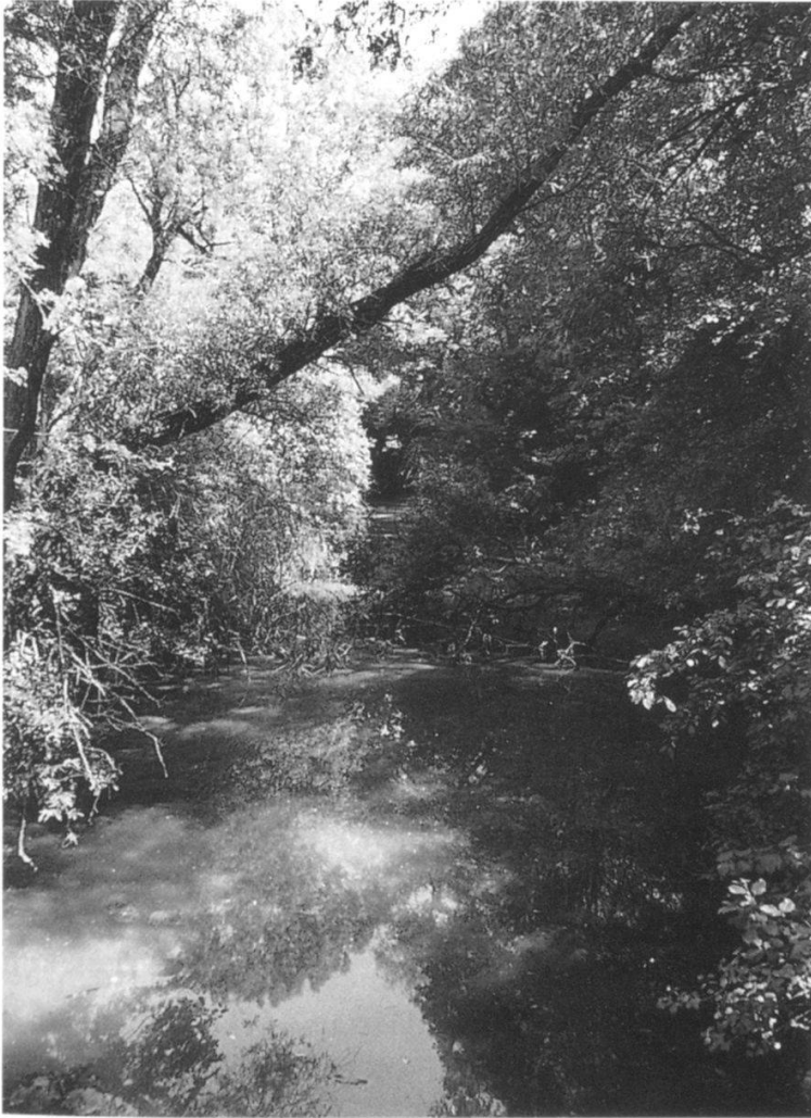
Abbildung 17: Blick in den Widi- kanal (Foto H. Ramseier, Juli 1995).