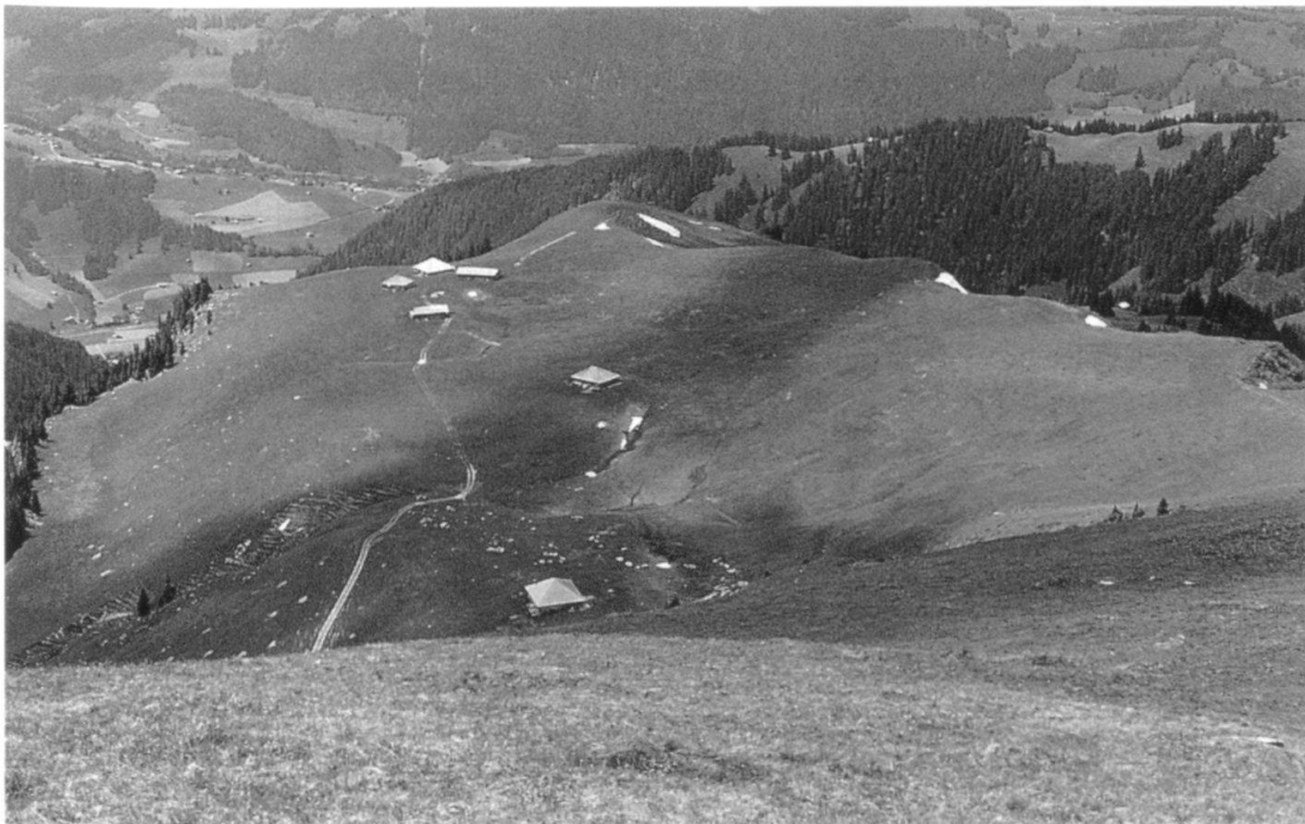
Abbildung 21: Blick vom Grat auf das grosse, intensiv genutzte Läger von Fromatt. Dort ist die Vegetation weiter als an den hüttenferneren, steileren und weniger gedüngten Flächen (Foto M. Jutzeler, Juni 1994).