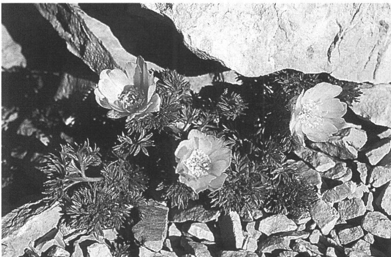
Adonis distorta Sella dei due Corni