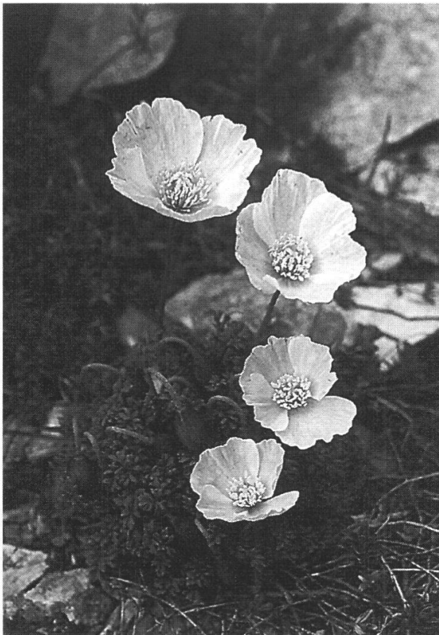
Papaver julicum Majella

2. Nacht im Hotel «Europa Park», Sulmona