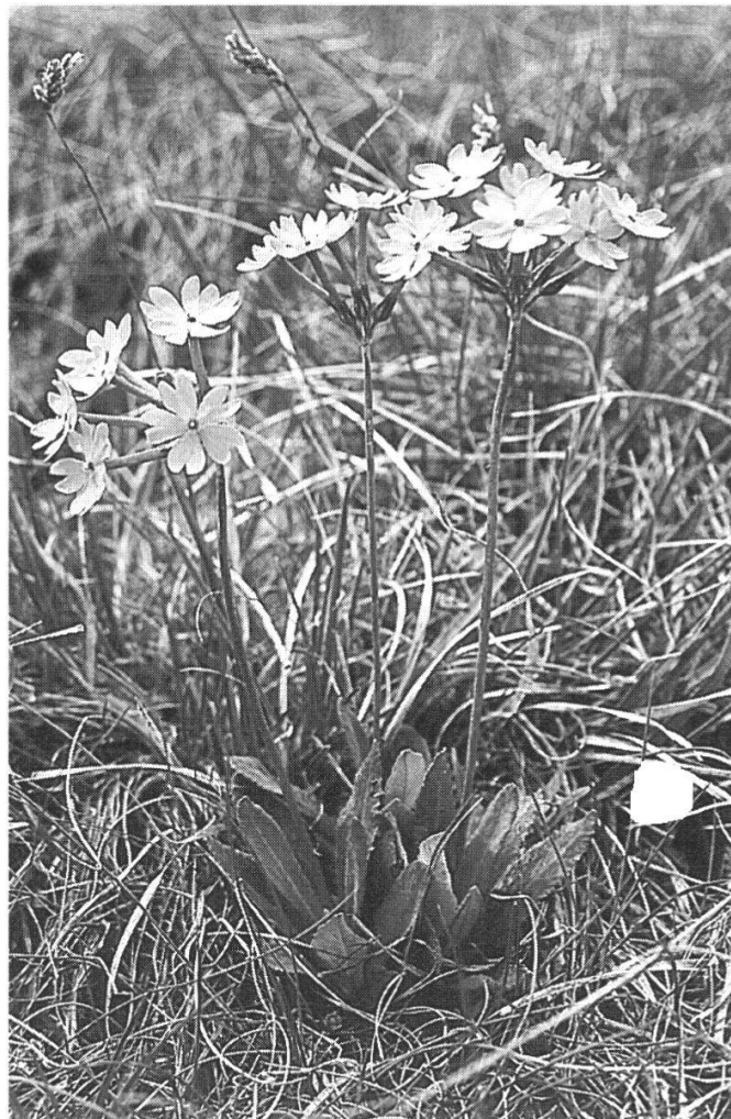
Primula halleri