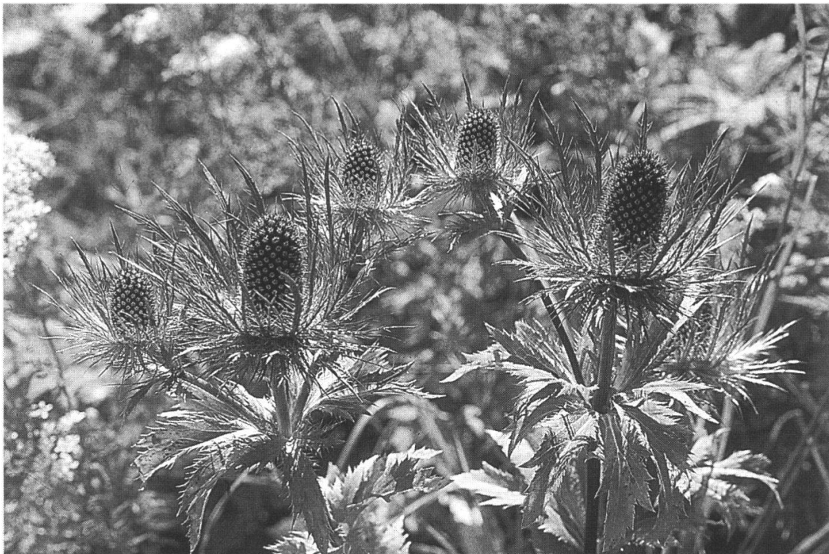
Eryngium alpinum . Lac de Tanay