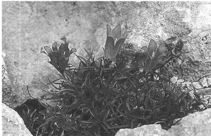
Edraianthus graminifolium Majella