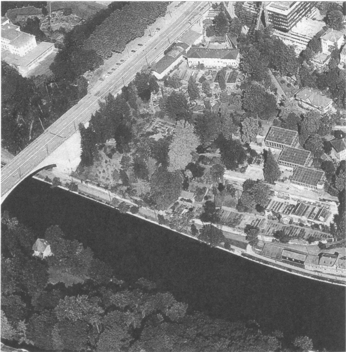
Abbildung 5: Luftaufnahme des Botanischen Gartens von Süden. Sie zeigt das dreieckige Areal zwischen Aare im Vordergrund, Lorrainebrücke oben links und Altenbergrain, an den die grossen Schauhäuser grenzen.

Viele verschiedene Besucher, Studierende, Forschende und Sicherholende, erfreuen sich an dieser grünen, gut gestalteten Oase in der Stadt und interessieren sich für die grosse Mannigfaltigkeit der Pflanzen. Sie werden die Schönheiten der vielgestaltigen Natur auch in Zukunft auf ihr Gefühl und ihren Verstand einwirken lassen.