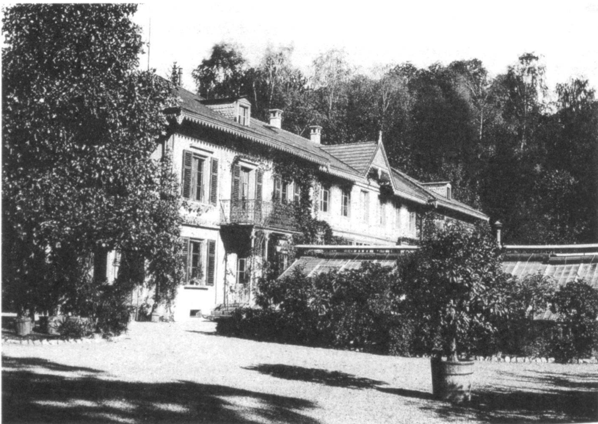
Abbildung 1: Institutsgebäude in der Zeit zwischen 1886 und 1906. Links der Flügelbau für das Institut, rechts jener für den Garten, dazwischen im Parterre die Orangerie (verdeckt), im 1. Stock die Aufstockung für das Institut. Im Vordergrund ein kleines Schauhaus, zu jener Zeit wohl als Sukkulentenhaus genutzt.

1906 brachte an Stelle der Orangerie ein Verbindungsbau mit zwei Geschossen zwischen den beiden Flügeln eine lang ersehnte Erweiterung des Instituts. Es war ein Backsteinbau mit Labors und Büros. Im Hof hinter dem Institut wurde damals ein Anbau für einen Hörsaal errichtet, mit Fenstern auf drei Seiten und einem Glastach, das durch eine Store verdunkelt werden konnte.