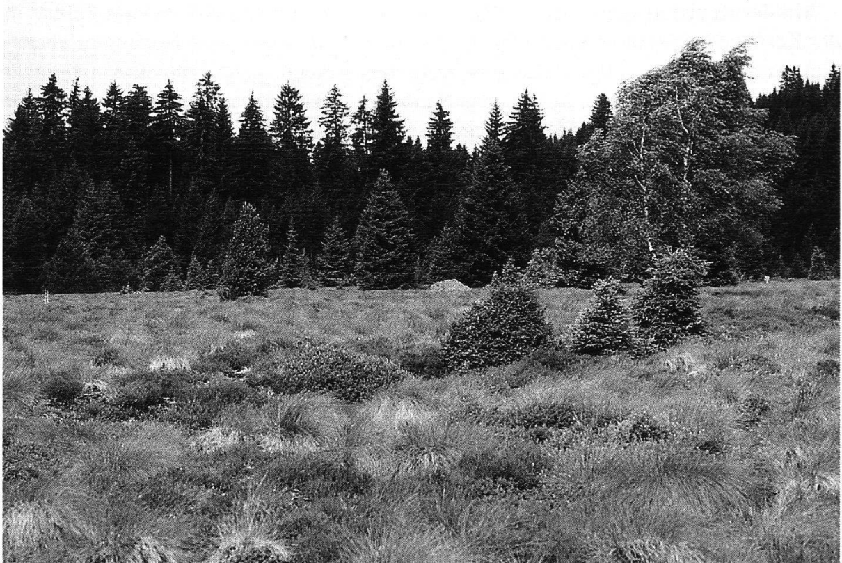
Abbildung 9: Hochmoorkernzone im Naturschutzgebiet «Tourbière de la Chaux».