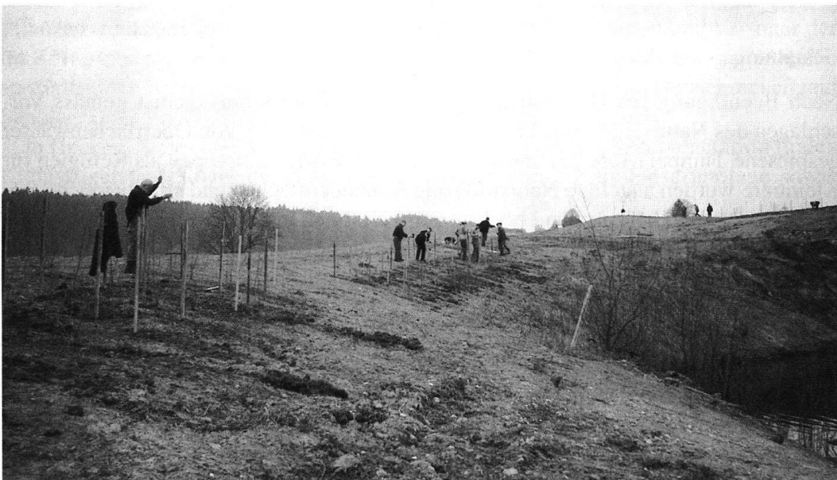
Abbildung 14: Heckenpflanzaktion unter tatkräftiger Mithilfe der Seeländer Patentjäger. Mit der nötigen Entwicklungszeit entstehen deckungsreiche Refugien für Tiere der Kulturlandschaft. (Foto P. Augustin, April 1999)