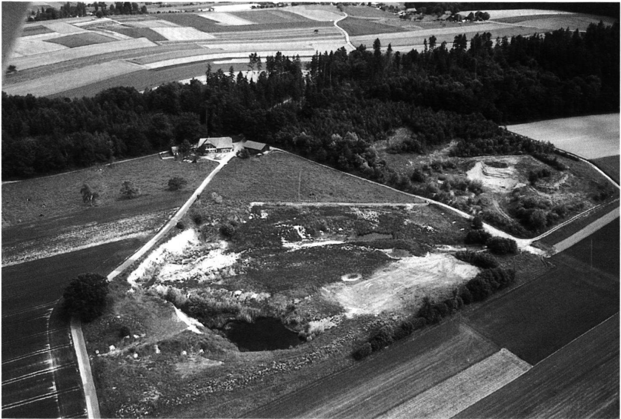
Abbildung 11: Das seit 1986 bestehende Naturschutzgebiet (oben rechts) konnte um eine Fläche von 3,1 ha erweitert und durch zahlreiche Strukturelemente aufgewertet werden. (Foto H.U. Sterchi, Mai 2000)

Auf Kiesflächen und an wenig bewachsenen, gut besonnten Böschungen siedeln Pflanzen trockener, magerer Standorte sowie typische Pionierarten und Vertreter der im Kulturland selten gewordenen Ackerbegleitflora. Reptilien und eine ganze Reihe spezialisierter Wirbelloser wie grabende Wildbienen und Wespen, Heuschrecken und Sandlaufkäfer finden hier ihre bevorzugten Lebensraumstrukturen.