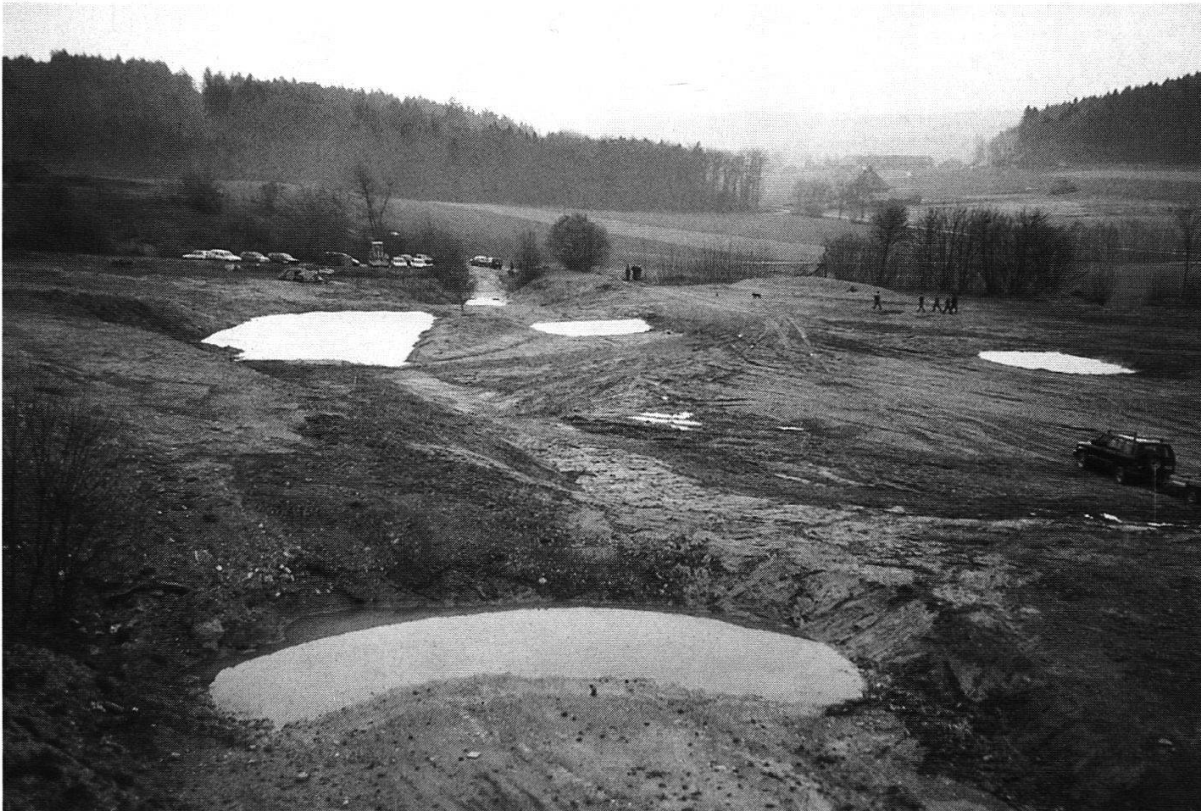
Abbildung 13: Bei den Terraingestaltungen wurden zahlreiche Tümpel neu angelegt. Magere und nährstoffreichere Standorte sind eng verzahnt und beinhalten ein grosses Potential zur Entwicklung artenreicher Pflanzenbestände.