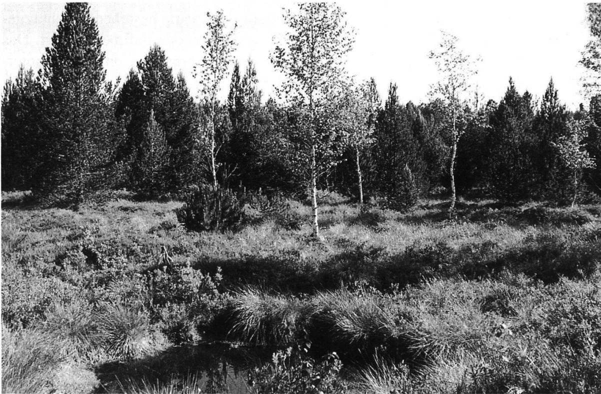
Abbildung 10 : Naturschutzgebiet Bellelay. Primäres Hochmoor im östlichen Teil mit typischer Vegetation. (Foto Ch. Rüfenacht, Juli 2000)

Nach der auf (politischen) Druck des ansässigen Hockeyklubs erfolgten Ausbaggerung des Etang de la Noz vor drei Jahren und nach den getroffenen provisorischen Massnahmen zur Verhinderung einer erneut schnellen Verschlammung – das Abwasserproblem der Gemeinde Genevez (Kanton Jura) harrt nach wie vor einer Lösung – sind konkrete Regenerations- und Aufwertungsmassnahmen aus naturschützerischer Sicht im jetzigen Zeitpunkt nicht vorgesehen.