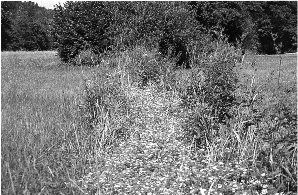
Abbildung 20: Wiesenbach in der Brunnmatte. (Foto E. Grütter, Juli 1999)

bilden Lebensräume für Fische, Krebse, Amphibien, Reptilien (z.B. Ringelnatter), Vögel (z.B. Rohrsänger, Rohrammer) und Insekten (z.B. Libellen, Tag- und Nachtfalter, Heuschrecken). Für verschiedene seltene und gefährdete Arten stellen sie die letzten Rückzugsgebiete in der Kulturlandschaft dar, und für einzelne spezialisierte Arten (z.B. Libellen) sind sie sogar die einzigen besiedelbaren Biotope. Diese Gewässer haben auch die Funktion von Verbindungselementen, entlang welchen Pflanzen und Tiere wandern und sich ausbreiten können.