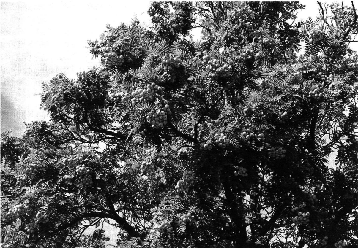
Abbildung 24: Krone eines freistehenden Früchte tragenden Speierlings. (Foto J. Wildermuth, Oktober 2000)

veröffentlicht. Die in ihrer natürlichen Hauptverbreitung mediterrane Art besiedelt ein Areal von der iberischen Halbinsel über Frankreich, Italien, den Balkan bis zur Halbinsel Krim und von Nordafrika bis nach Mitteldeutschland und zu den Steilküsten von Südwales. Nach dem heutigen Kenntnisstand ist der Speierling in der postglazialen Wärmeperiode als wärmeliebendes Florenelement von Südfrankreich entlang des Rhonetales nordwärts in die nordwestlichen Teile der Schweiz eingewandert. Er konnte sich hauptsächlich in den wärmeliebenden, lichten Eichenmischwäldern halten und sich dank der dazumal verbreiteten Nieder- und Mittelwaldbewirtschaftung da und dort auch vermehren.