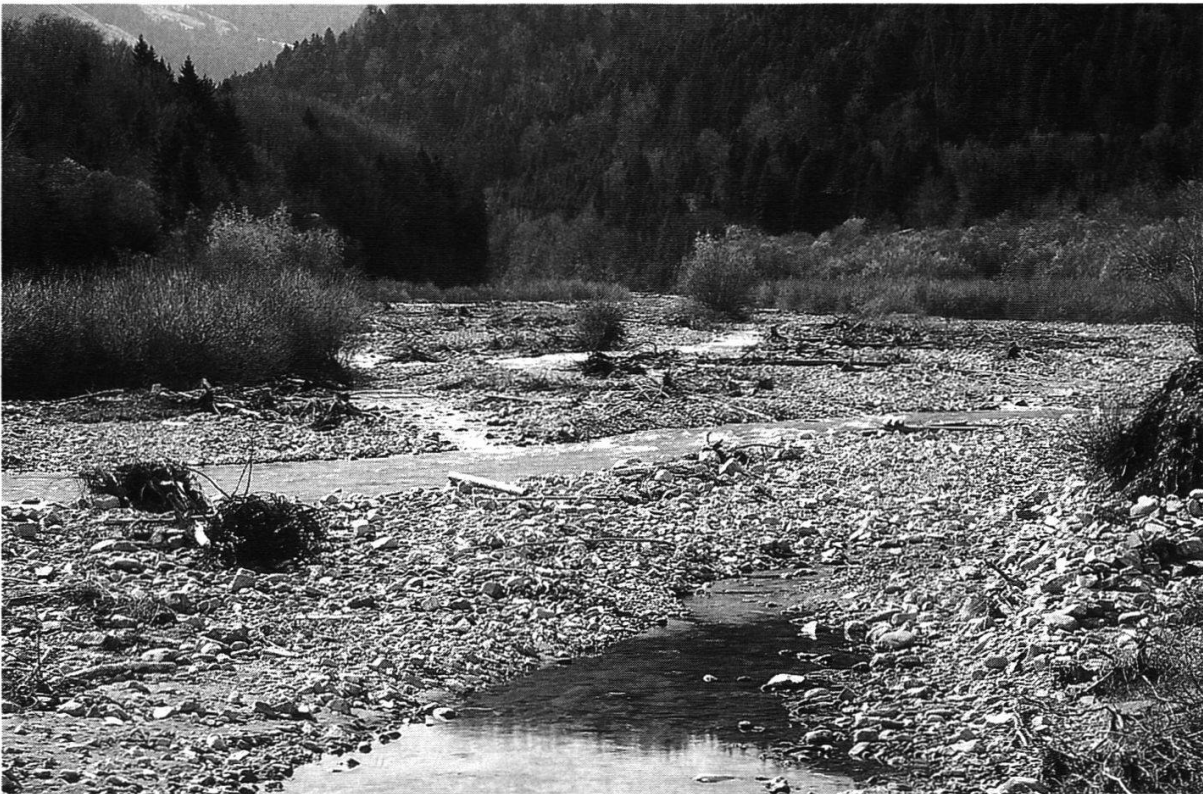
Abbildung 19: Schotterbänke naturbelassener Flusslandschaften sind nicht nur ein beliebter Aufenthaltsort Erholung suchender Menschen, sondern auch Habitat der im Berner Mittelland vom Aussterben bedrohten Schlingnatter. Das Bild zeigt einen Abschnitt des Sensegrabens.

schaften, namentlich an Sense, Schwarzwasser und Gürbe, Schlingnatterpopulationen zu lokalisieren und durch artspezifische Pflegemassnahmen gezielt zu fördern. Im vergangenen Herbst gelang erfreulicherweise die Bestätigung eines älteren Nachweises an der kalten Sense bei Sangernboden.