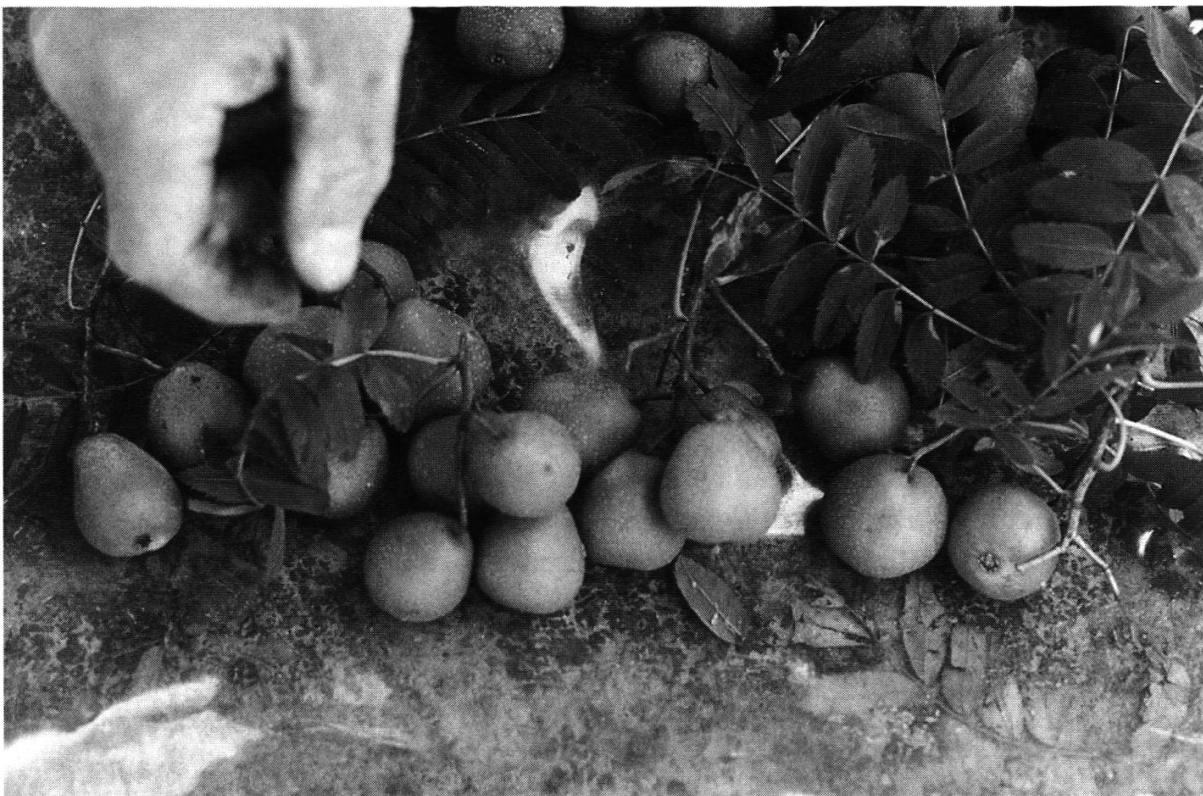
Abbildung 25: Typisch birnenförmige Früchte sowie Fiederblätter des Speierlings. (Foto J. Wildermuth, Oktober 1994)

Die Früchte ( Abb. 25 ) sind variabel in Grösse, Form, Farbe, aber auch in Geschmack und Inhaltsstoffen. Sie variieren von Baum zu Baum, wahrscheinlich aufgrund schon früh einsetzender menschlicher Selektion. Sie sehen aus wie Marzipanbirnchen aus der Confiserie, sind 2 cm bis maximal 4 cm hoch und wiegen 10 bis 38 g. Sie sind meistens gelb-grün, mit oder ohne rote Bäckchen, andere bräunlich und einige zudem fein bläulich bereift, was ihnen ein ausserordentlich schönes und ansprechendes Aussehen verleiht. Sie hängen an Büscheln von bis 15 oder mehr Stück und fallen – meist noch unreif – ab Ende September zu Boden, wo sie in einigen Tagen ausreifen und nun, bräunlich-teigig geworden, geniessbar sind. Der Geschmack der Früchte erinnert an ein feines Birnchen, ist aber sehr speziell.