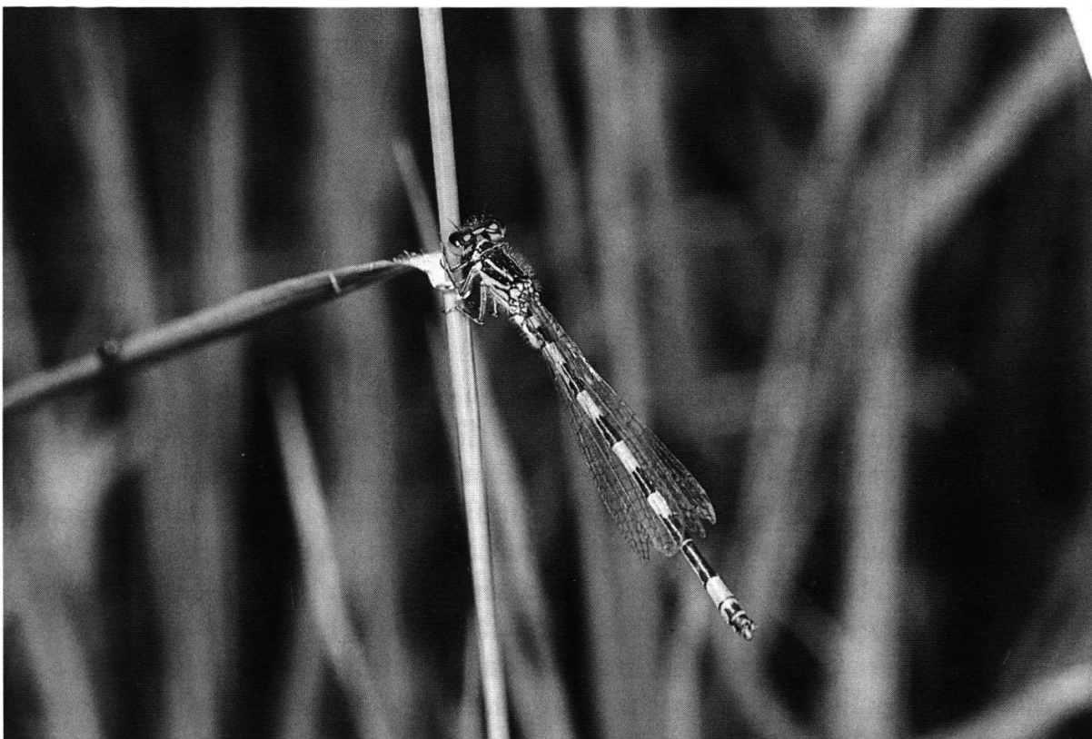
Abbildung 21: Helm-Azurjungfer.

Die Helm-Azurjungfer ( Abb. 21 ) zählt zur Unterordnung der Kleinlibellen ( Zygoptera ), die im Unterschied zu den Grosslibellen ( Anisoptera ) die Flügel in der Ruhehaltung parallel über ihrem Körper halten. Grosslibellen tragen ihre Flügel beim Sitzen kreuzförmig. Die Helm-Azurjungfer aus der Familie der Schlanklibellen ( Coenagrionidae ) ist ein Vertreter der Gattung Azurjungfer ( Coenagrion ), die mit 4 Arten im Kanton Bern vorkommt. Die Männchen dieser Gattung tragen einen blauen Körper mit