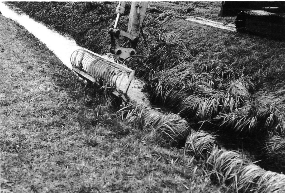
Abbildung 22: Maschinelle Räumung eines Wiesenbächleins mit dem schonenden Mähkorb. (Foto M. Graf, Februar 2000)

Die Räumung der Gewässersohle von aufgelandetem Material ist bei kleinen Gräben häufig notwendig, um deren ursprüngliche Funktion der Ent- oder Bewässerung wiederherzustellen. Eine Räumung stellt für Flora und Fauna des Gewässers jedoch einen schweren Eingriff dar, der grundsätzlich so selten und so schonend wie möglich durchgeführt werden soll. Die Auswirkungen einer Räumung sind in den Monaten August