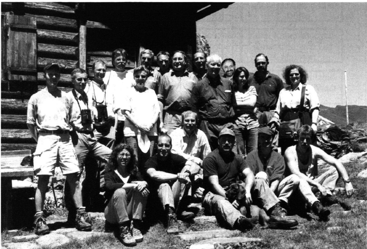
Abbildung 29: Team des Naturschutzinspektorates.