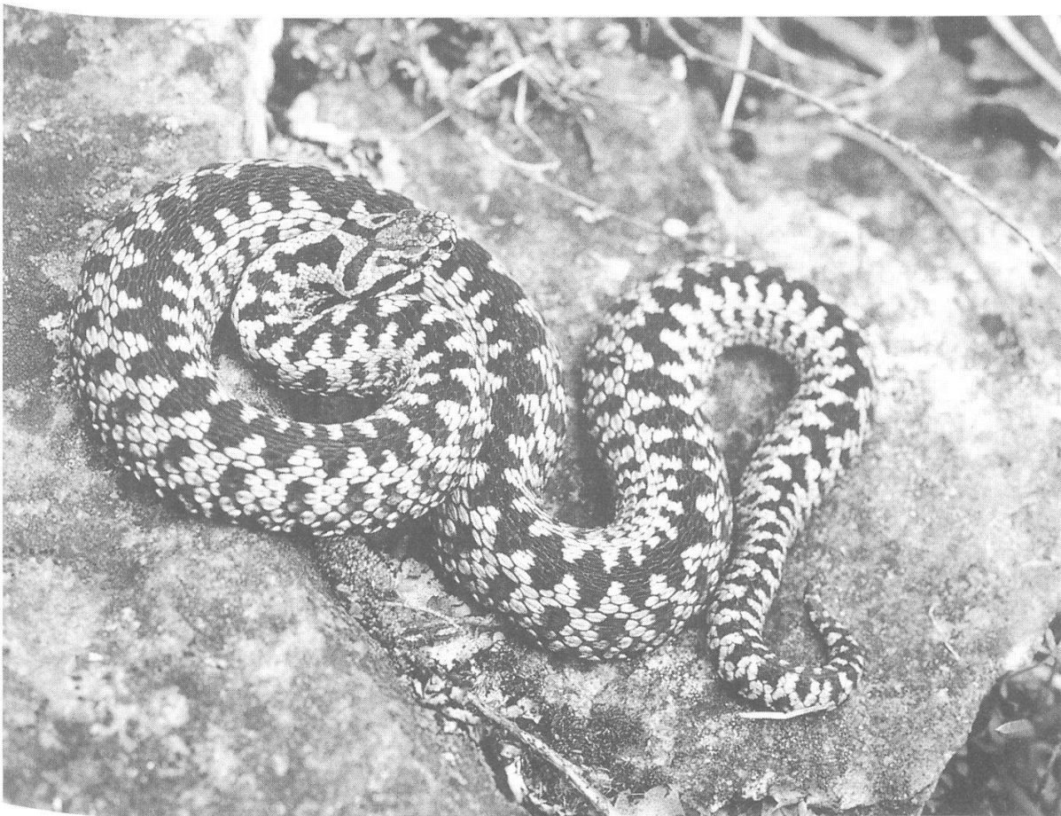
Abbildung 17: Männchen der Kreuzotter, frisch gehäutet, Kandersteg. (Foto: B. Baur, Juli 1987)

Die ersten beiden Kreuzottern sahen wir am 9. Juli 1987. Am Tag vorher hatte es leicht geregnet, morgens um 9 Uhr waren die Weiden noch völlig nass. Es war kühl, die Sonne erreichte jedoch bereits die ganze Fläche zwischen der früheren Sesselbahnstation Sunnbühl und dem Gebiet um die Arvenseeli. Nach unseren heutigen Erfahrungen ideales Kreuzotternwetter. Nach einer Viertelstunde fanden wir bereits eine vollständig erhaltene Oberhaut, welche kurze Zeit vorher von einer Kreuzotter abgestreift worden war. Während wir uns noch über diesen ersten Hinweis freuten, fiel unser Blick auf ein prächtiges, helles Männchen (Abb. 17) mit auffälligem schwarzem Zickzackband, welches trotz der noch kühlen Witterung rasch durchs nasse Gras kroch. Wir waren nun zuversichtlich, dass wir noch weitere Tiere finden würden. Es dauerte aber gut eine halbe Stunde, bis wir auch ein braunes Weibchen (Abb. 18) beobachten und fotografieren konnten, welches aufgerollt hinter einem grösseren Stein, vom Wind geschützt, an der Sonne lag. Im gleichen Jahr sahen wir an drei Tagen nochmals im ganzen fünf Tiere. Wir beschlossen deshalb, das Gebiet so lange als möglich jedes Jahr mindestens einmal und wenn möglich zu verschiedenen Jahreszeiten zu besuchen und die Beobachtungsdaten festzuhalten.