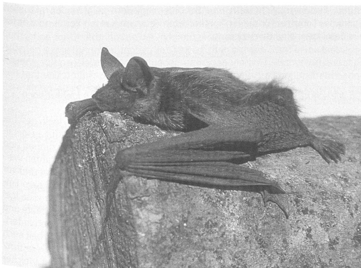
Abbildung 23: Junge Breitflügelfledermaus.

Beim Grossen Mausohr begann die Informationsstelle 1997 damit, Freiwillige für die Betreuung der Wochenstuben zu suchen und auszubilden. Heute werden alle 19 bekannten Wochenstuben des Mausohrs von ortsansässigen Quartierbetreuenden überwacht. Die Aufgabe der Quartierbetreuenden besteht in erster Linie darin, die Koloniebestände jährlich zu zählen, den Quartierunterhalt zu sichern und den Kontakt zu den Eigentümern der Gebäude aufrechtzuhalten. Etliche Quartierbetreuende leisten für diese Aufgabe einen beachtlichen Einsatz. Ebenfalls die Wochenstuben der Breitflügelfledermaus werden im deutschsprachigen Kantonsteil ehrenamtlich durch FRITZ BIGLER, Bolligen, betreut. Dank dieser freiwilligen Betreuung der beiden Arten werden die Arbeit der Informationsstelle entlastet sowie die Schutzanstrengungen dezentralisiert und verbessert.