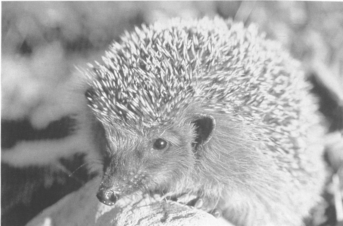
Abbildung 24: Igel nach erfolgreicher Behandlung.

Was würde mit zahlreichen geschwächten, kranken und verletzten Igelnden geschehen, die von der Bevölkerung gefunden werden, wenn nicht einige gut ausgebildete Igelbetreuerinnen und -betreuer in Zusammenarbeit mit Tierärztinnen und Tierärzten diese freiwillig in ihre Obhut nehmen würden? Seit vielen Jahren werden in einigen ehrenamtlich geleiteten Stationen Igel ( Abb. 24 ) betreut und vor dem sicheren Tod bewahrt. In aufwändiger Arbeit und mit unermüdlichem Einsatz, oft auch während der Nacht, an Werk- und Sonntagen, werden viele Igel «aufgepäppelt», mit Vitaminpräparaten gefüttert, Wunden versorgt, innere und äussere Parasiten entfernt, kranke Tiere medizinisch betreut und überwintert. Einziger Lohn ist das befriedigende Erlebnis der Freilassung. Oft ist die Arbeit auch frustrierend und aussichtslos, da die Sterberate der aufgefundenen Tiere trotz aller Bemühungen sehr hoch ist. Deshalb ist es bewundernswert, mit welcher Geduld und Aufopferung, vor allem Igelbetreuerinnen, ihre ganze Freizeit und