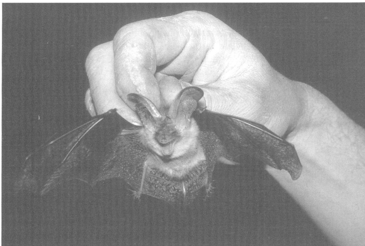
Abbildung 21: Langohr.