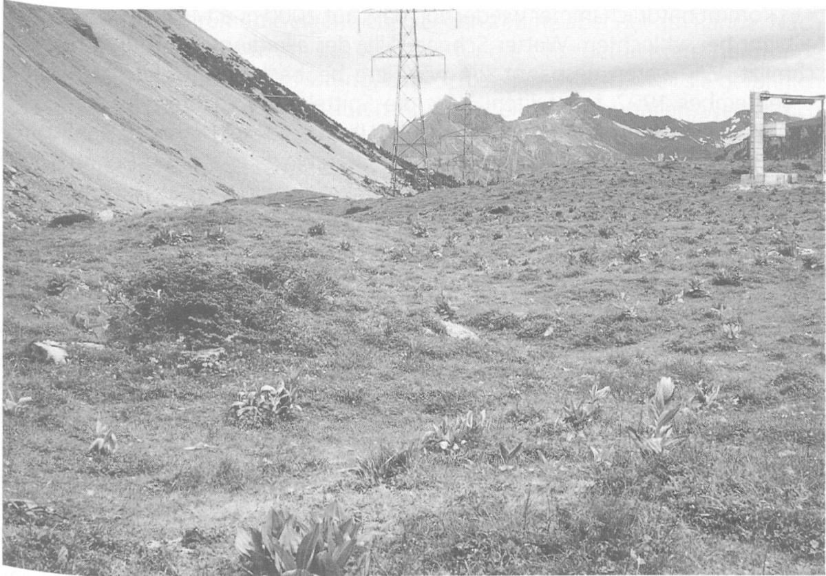
Abbildung 19: Lebensraum der Kreuzotter, Kandersteg. (Foto: B. Baur, Juli 1987)

weniger stark überwachsene Steinhaufen und Blockhalden in Alpweiden. Einzelne Tiere wurden im Frühsommer auch beim Queren von völlig aperen, kurzgrasigen Weiden beobachtet, ruhende Tiere haben wir aber immer nur in der Nähe von steinigen Strukturen beobachtet. Die herumstöbernden Tiere waren wohl auf der Suche nach «Sommerplätzen» mit ausreichendem Angebot an Futtertieren.