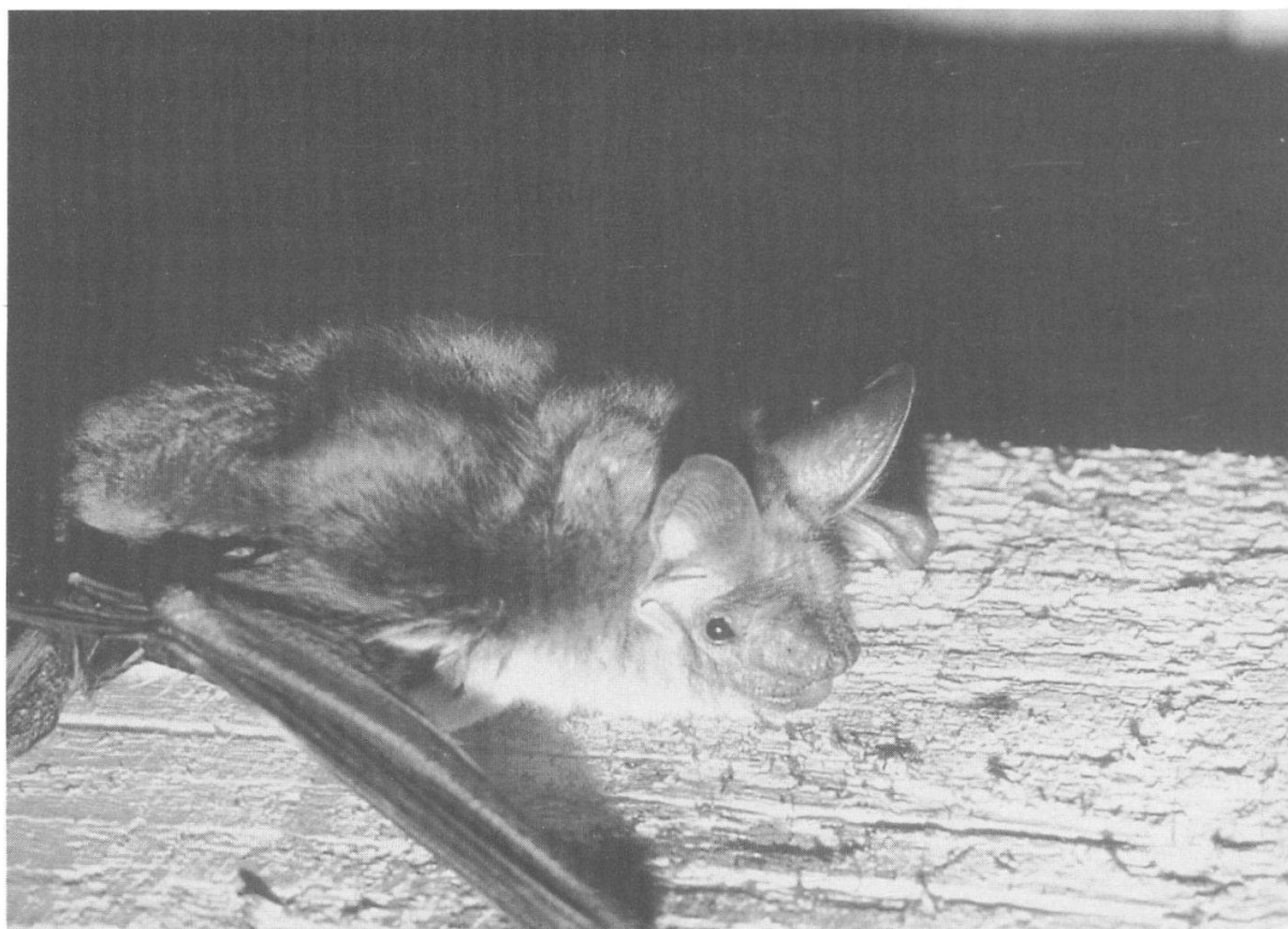
Abbildung 22: Grosses Mausohr.