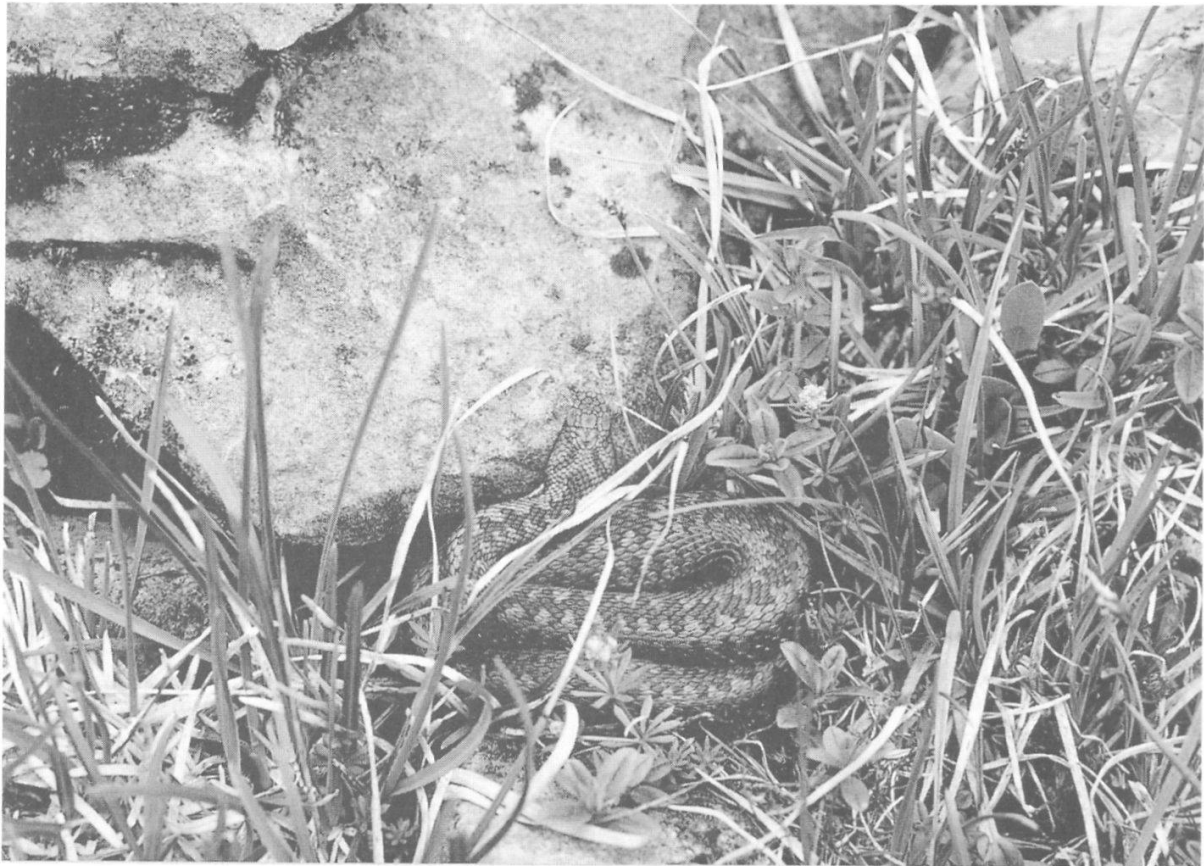
Abbildung 18: Weibchen der Kreuzotter, Kandersteg. (Foto: B. Baur, Juli 1987)