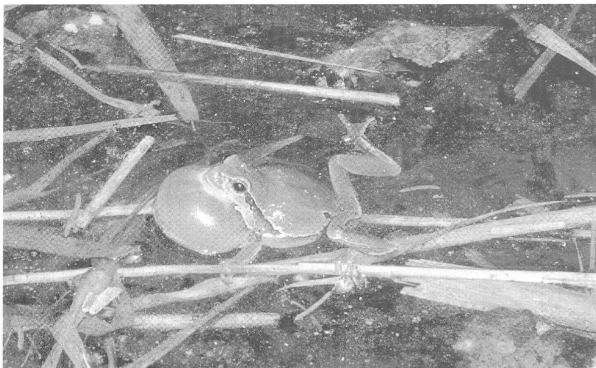
Abbildung 35: Rufendes Laubfroschmännchen.

nachgewiesen werden konnte. Eiablagen in G8 auf der Insel sind nicht auszuschliessen, da das Gewässer und dessen Umfeld dafür ideal wären. Im Verlauf des Sommers gelangen durch den erhöhten Aarewasserstand jedoch häufig Fische ins Gewässer. Dadurch haben die Larven kaum mehr Überlebenschancen. Der Bestand rufender Laubfroschmännchen schwankte in den letzten fünf Jahren zwischen 6 (1998) und 14 (1999). Der Höhepunkt 1999 ist wohl dem stark erhöhten Wasserstand schon vor dem eigentlichen Hochwasser zuzuschreiben, nach dem Hochwasser war die Rufaktivität erloschen. Laubfroschpopulationen zeigen eine ausserordentlich hohe Dynamik und in vielen Fällen hohe Aussterbe- und Wiederbesiedlungsraten im Sinne des Metapopulationskonzeptes (z.B. BORGULA 1995, TESTER & FLORY 1995), so dass sie Hochwasserereignisse trotz ihrer geringen Lebenserwartung verkraften können. Der Laubfrosch ist eine der Zielarten für zukünftige Gestaltungs- und Pflegemassnahmen.