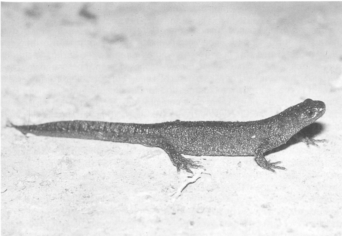
Abbildung 37: Kammmolchweibchen beim Zuwandern vom Hangwald.