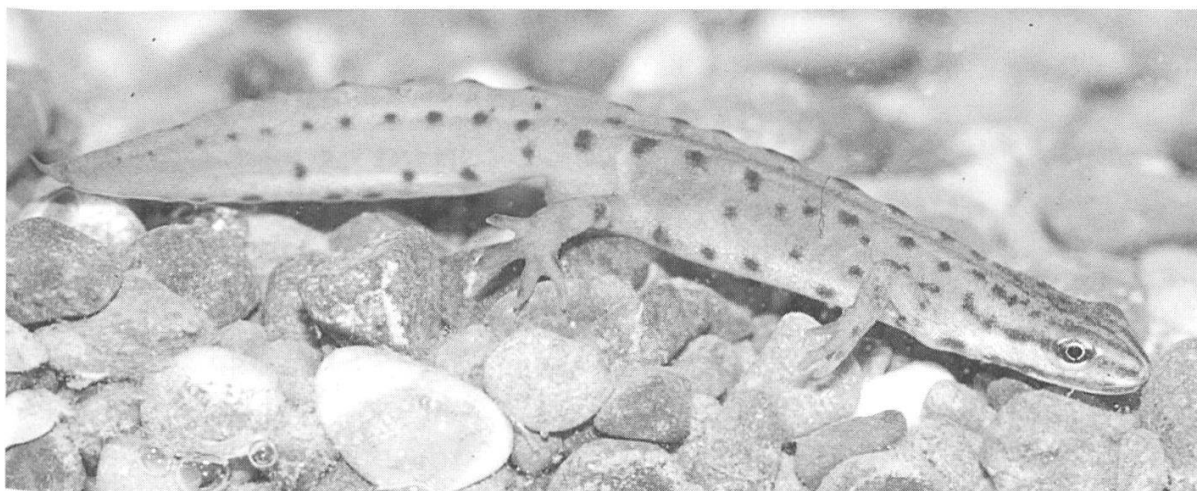
Abbildung 36: Teichmolchmännchen.

Der stark gefährdete Teichmolch (Abb. 36) pflanzt sich in sonnigen, pflanzenreichen Auwaldgewässern, Flachmooren, Verlandungszonen grösserer Gewässer und in Riedflächen offener, meist ebener Landschaften fort. An Land sucht er gewässernahe, feuchte Tagesverstecke auf. Er überwintert im Boden, in Steinhäufen und manchmal auch im Gewässer. Die Auen der Aare zwischen Bern und Thun sind einer der wichtigen Lebensräume dieser Art im Kanton Bern. Aktuelle Nachweise liegen nur aus der Märchligenau und aus Belp vor. Der Teichmolch wurde in der Märchligenau in den letzten fünf Jahren in schwankender Anzahl auf der