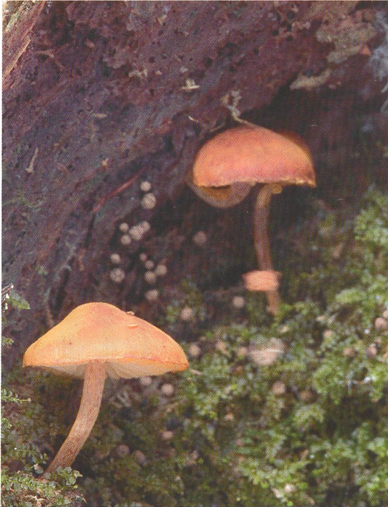
Der Kleinsporige Flämmling ( Gymnopilus bellulus ) ist ein typischer Altwaldpilz auf stark abgebautem Totholz.