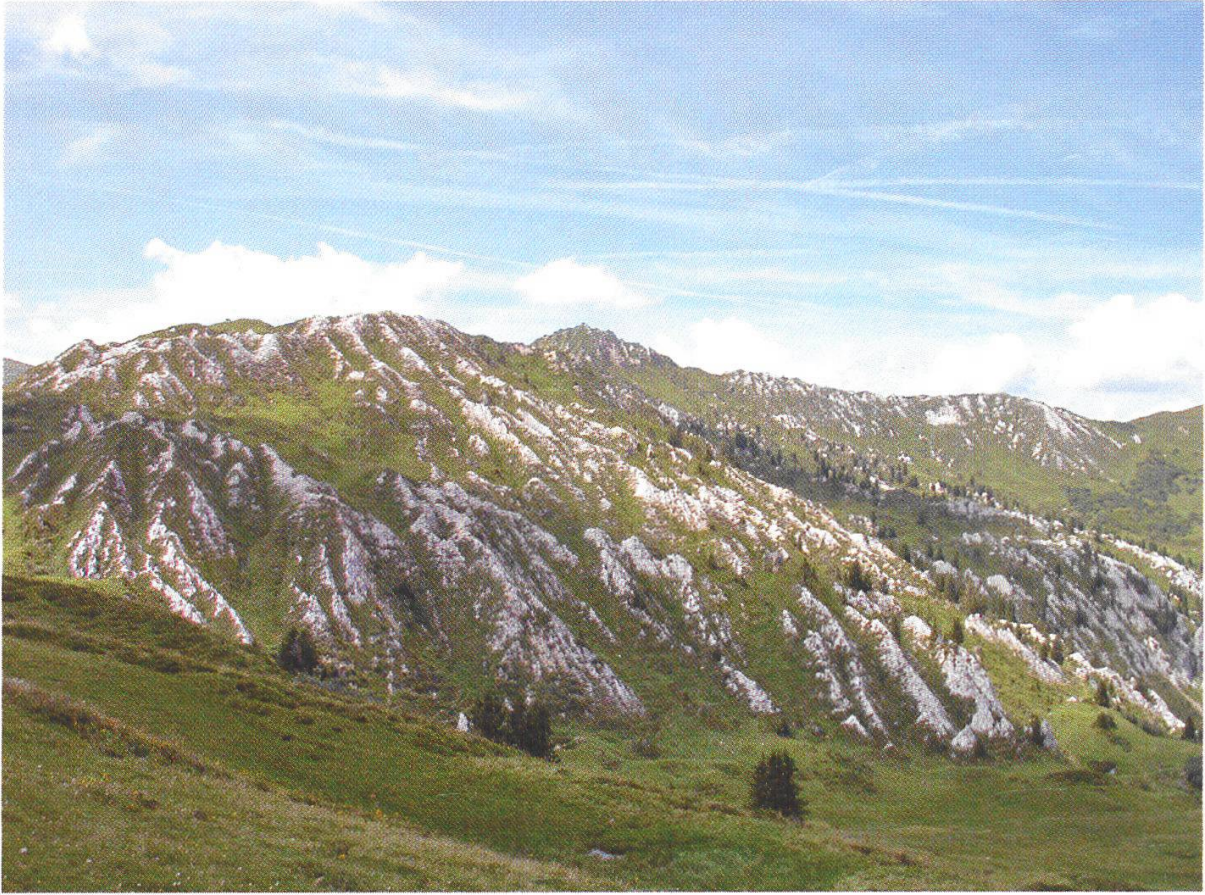
Blick auf die Stübleni in Richtung Trütlibergpass

Hedysarum hedysaroides Hieracium aurantiacum Hypericum maculatum Hypochoeris uniflora Linaria alpina Nigritella nigra Onobrychis montana Oxytropis campestris Parnassia palustris Pedicularis foliosa Pedicularis verticillata Peucedanum ostruthium