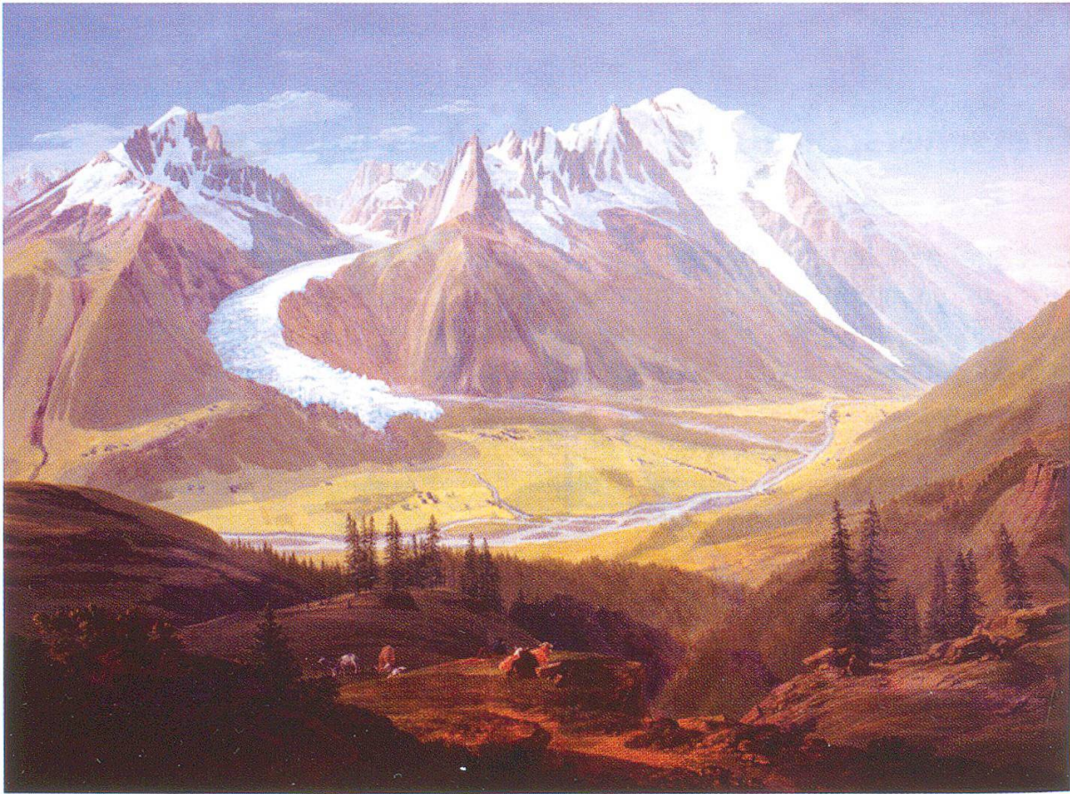
Abbildung 1: Chamonix-Tal mit vorstossendem Mer de Glace, dargestellt von Jean-Antoine Linck («La chaîne du Mont-Blanc vue de la Flégère»); gezeichnet in der Mitte unten «In Ante Linck fec.»; Wasserfarbe und Gouache; 62.0 x 85.5 cm; Musée d'art et d'histoire, Genève, Inv. Nr. 1915-75; Photo H.J. Zumbühl).

programmen als «unique demonstration objects»: auch ohne akademische Bildung können die Veränderungen visuell wahrgenommen und in ihren physikalischen Grundprinzipien – Schneefall und Schmelzen von Schnee und Eis in direkter Abhängigkeit von atmosphärischen Gegebenheiten – qualitativ verstanden werden. Die Aufgabe wissenschaftlicher Programme ist es, quantitative Daten zu liefern, eine Übersicht über die Entwicklung in Zeit und Raum zu vermitteln und Szenarien für die Zukunft als Grundlagen für politische Entscheide zu entwerfen. Solche Szenarien zeigen klar, dass es den Gletschern gar nicht gut geht, ja mancherorts sogar ihr Ende absehbar wird.