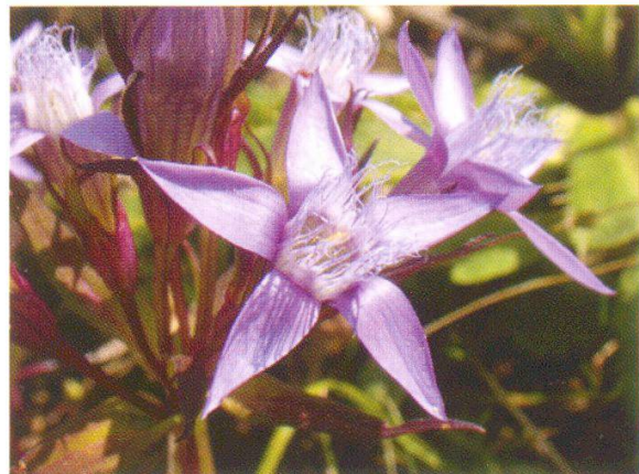
Abbildung 11: Deutscher Enzian ( Gentiana germanica )