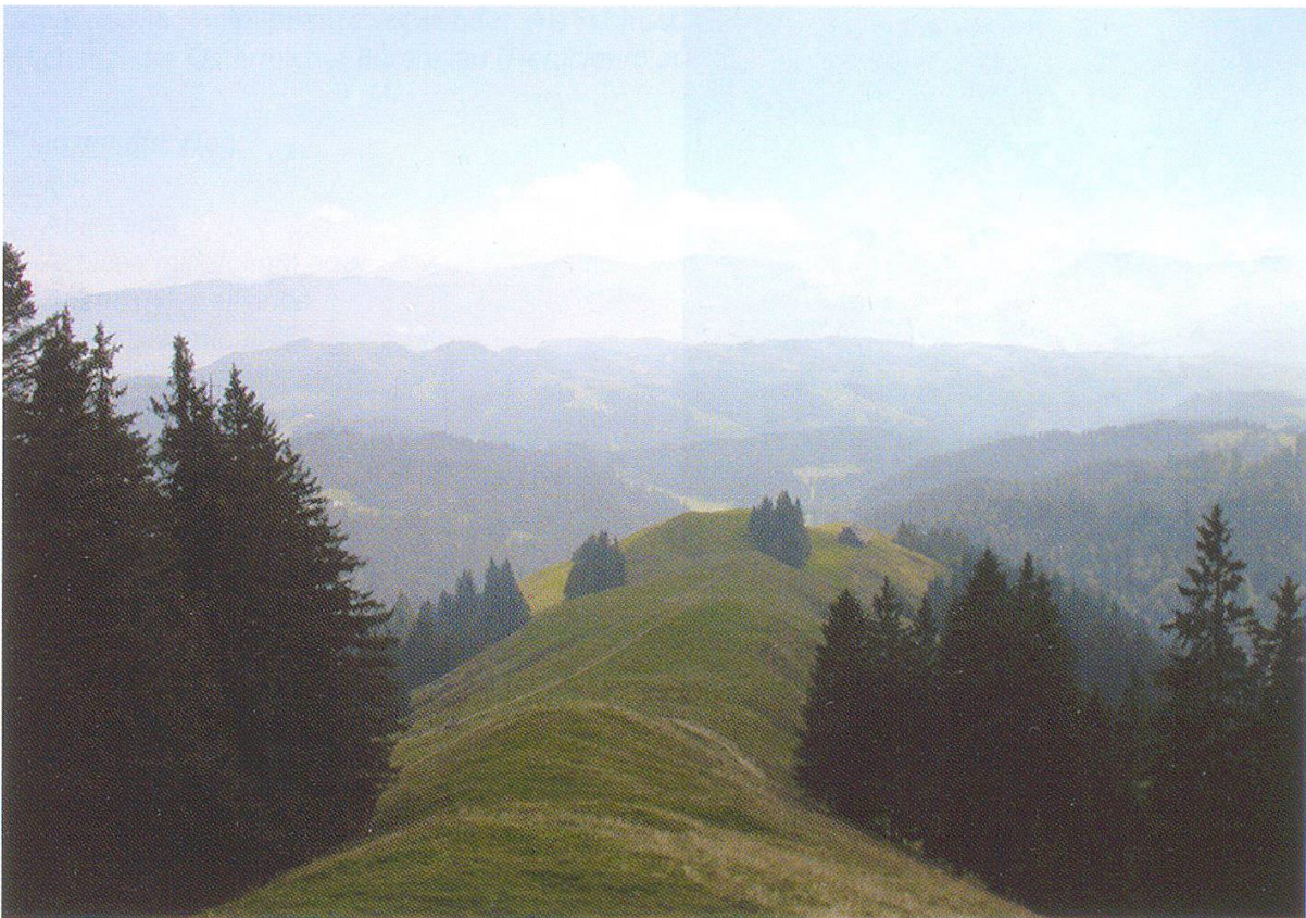
Abbildung 9: Emmentaler Panorama und Berner Alpen.

Die meisten Hirschaften des Hinterarni sind ganzjährig bewohnt. Im Sommer werden Tiere aus dem Unterland gesömmert, im Winter arbeiten die Bewohner im Wald und finden ihr Auskommen mit dem Holzerlös.