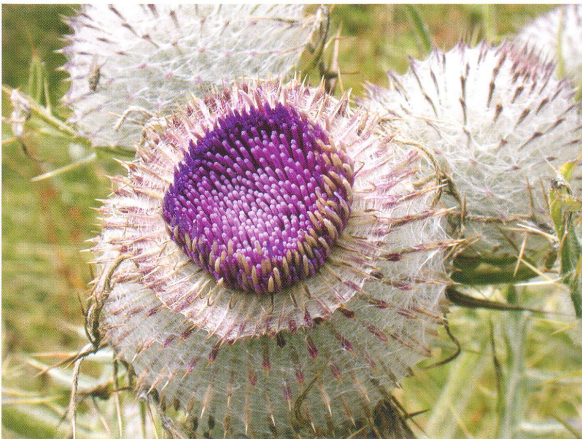
Abbildung 7: Wollige Kratzdistel ( Cirsium eriophorum )

Recht dominant auf dem felsigen Untergrund ist die Horstsegge ( Carex sempervirens ), das Blaugras ( Sesleria caerulea ) und der Schafschwingel ( Festuca ovina ), der auf Kalk teilweise bestandsbildend ist. Wohl immer erfreulich zu sehen, aber auf dem Chasseral nicht wirklich heimisch ist das Edelweiss ( Leontopodium alpinum ). Diese Art wurde, wahrscheinlich mit anderen zusammen, vor längerer Zeit in der Gipfelregion angesalbt. Von einigen der typischen Gipfelarten sind im August noch die Früchte zu sehen wie z.B. vom Immergrünen Felsenblümchen ( Draba aizoides ), dem Milch-