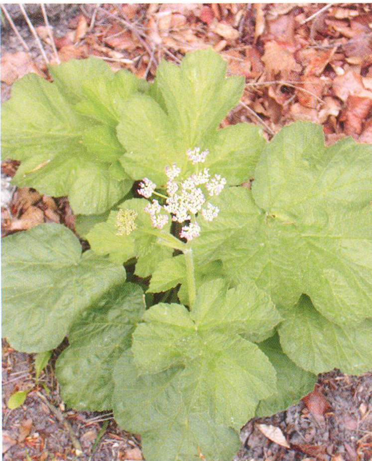
Abbildung 2: Jura-Bärenklau ( Heracleum sphondylium subsp. alpinum )

Wegen des stetig schlechter werdenden Wetters und des dadurch glitschigen Untergrunds sparen wir uns den Aufstieg zum Chellenköpfli, wo eine weitere Rarität der Gegend wächst: das Berg-Steinkraut ( Alyssum montanum ). Interessant beim Abstieg nach Waldenburg die steilen Felsen gleich oberhalb des Dorfs, die mit Buchs ( Buxus sempervirens ) bewachsen sind.