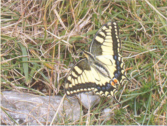
Abbildung 8: Schwalbenschwanz ( Papilio machaon )

Das Vorkommen der Schmetterlinge wurde vor über 150 Jahren schon erfasst. So ist die Entwicklung der Populationen in den vergangenen Jahren leicht zu erforschen. In der Region Bern sind z.B. 50% der damals nachgewiesenen Arten ausgestorben. Auf dem Chasseral sind seit dieser Zeit 18 Arten ausgestorben. Probleme bereiten den Schmetterlingen vor allem die Intensivierung der Landwirtschaft sowie gerade im Gebiet des Chasseral die nach dem Autobahnbau vorgenommenen Ersatzaufforstungen, die einzelne Lebensräume zerstört haben.