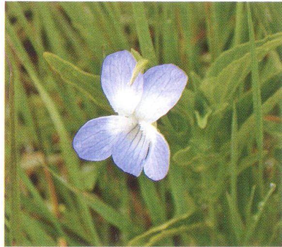
Abbildung 5: Hohes Veilchen ( Viola elatior )