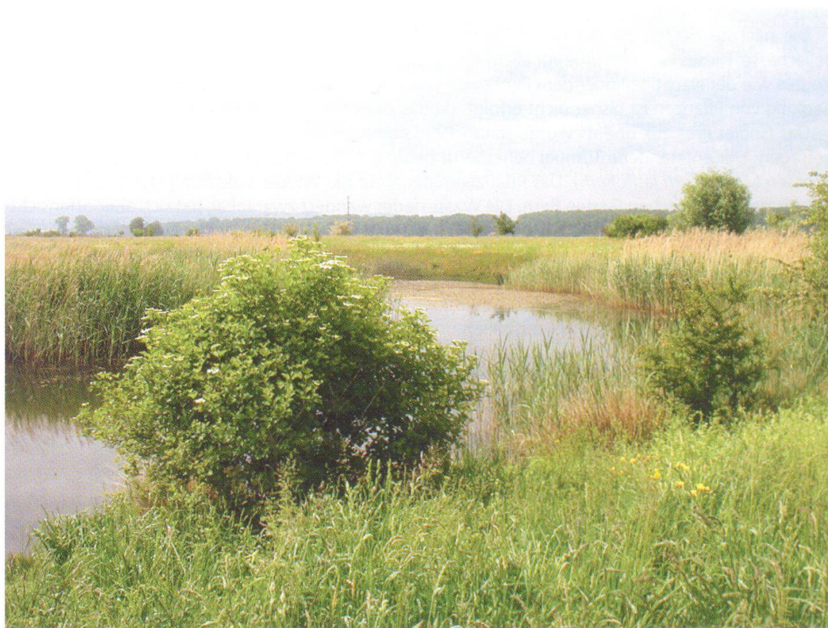
Abbildung 4: Teichlandschaft in der Chrümmi.