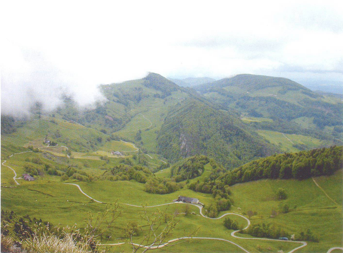
Abbildung 1: Blick vom Passwang gegen Osten.

Ganz oben auf der Jurakrete treten immer mehr die Felsen hervor. Diese Felsflur weist keine geschlossene Pflanzendecke mehr auf. Der Bewuchs ist lückig, Felsen und Pflanzen wechseln sich ab. Die Humusdecke ist sehr dünn und trocknet deshalb schnell aus. Spezialisierte Pflanzen in dieser Umgebung sind der Berg-Baldrian ( Valeriana montana ), die Scheiden-Kronwicke ( Coronilla vaginalis ), die Herzblättrige Kugelblume ( Globularia cordifolia ), der Hirschheil ( Seseli libanotis ), der Berg-Gamander ( Teucrium montanum ) und das Immergrüne Felsenblümchen ( Draba aizoides ). Zum Teil sind