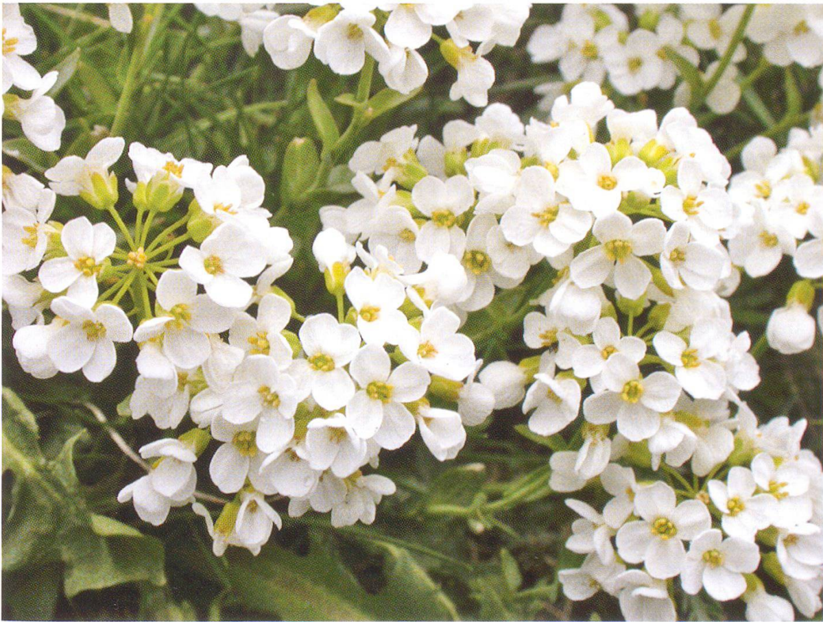
Abbildung 3: Berg-Täschelkraut ( Thlaspi montanum )