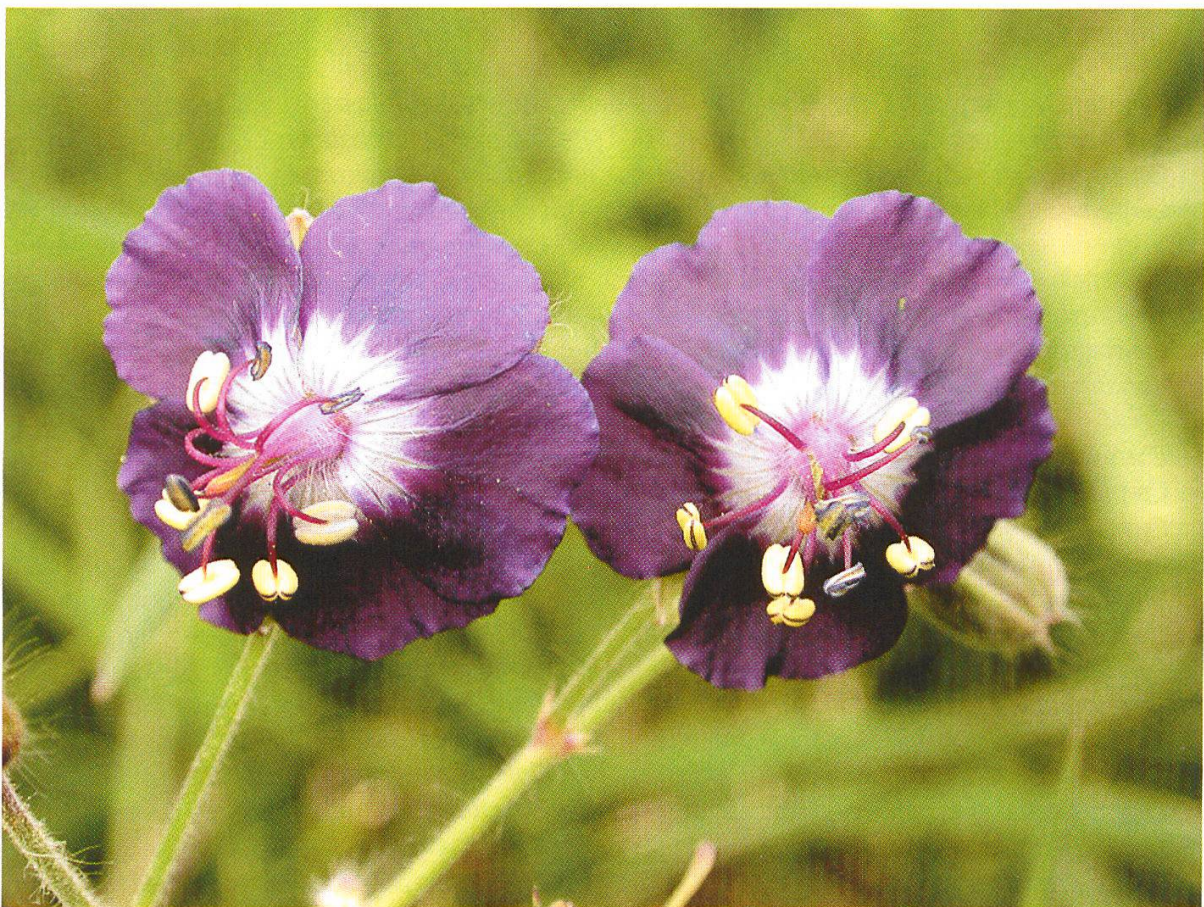
Abbildung 3: Brauner Storchnabel ( Geranium phaeum s.str. )

Ganz andere Lebensräume für die Pflanzen bietet das Gottéron-Tal. Das von steilen Sandsteinfelsen begrenzte Tal enthält eine erstaunliche Anzahl alpiner Arten wie Alpen-Fettblatt ( Pinguicula alpina ) oder den Bewimperten Steinbrech ( Saxifraga aizoides ). Weiter saaneabwärts wechselten wir nochmals ans andere Ufer, um über das Gebiet Palatinat bis nach Grandfey zu gelangen. Dort am Bahntrasse eine letzte Freiburger Schönheit, der Braune Storchnabel ( Geranium phaeum s.str. ). Auch bei ihm ist nicht ganz klar, wie er an diesen Standort gelangt ist, aber der Bahndamm scheint ihm als Standort zu behagen.