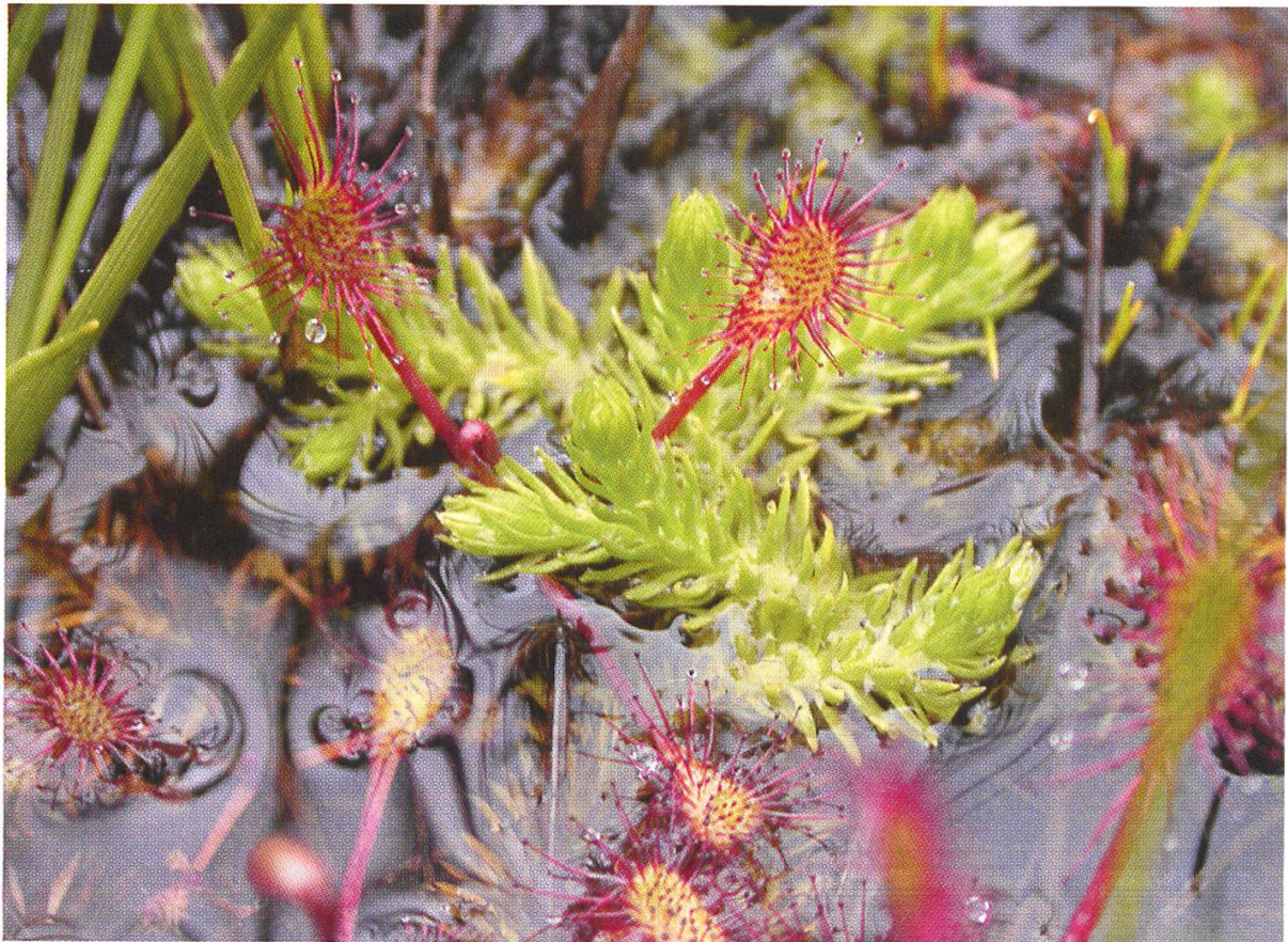
Abbildung 6: Moorbärlapp ( Lycopodiella inundata ) und Breitblättriger Sonnentau ( Drosera x obovata )

Von Salwideli führte uns der Weg Richtung Husegg – Törnliwald. In diesem Gebiet ist das Gelände weniger flach. Dadurch entstehen eher Flachmoore, die nicht nur von Regenwasser, sondern auch