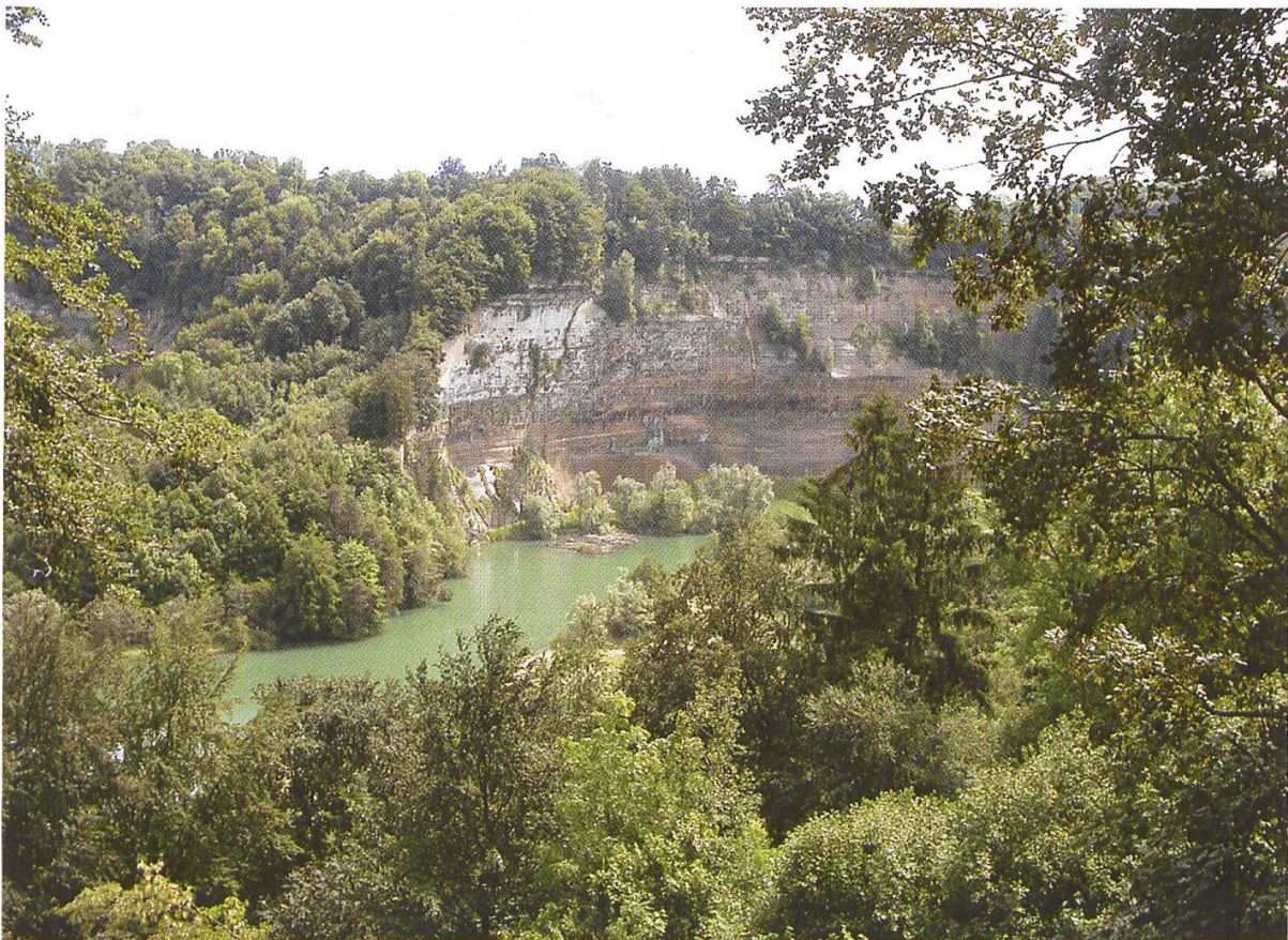
Abbildung 1: Lac de Peyrolles

Beim Weitergehen durch die Stadtgebiete zeigt sich sehr deutlich eine wichtige Schwierigkeit, welche die Erfassung einer Stadtflora mit sich bringt: Viele Grünflächen sind bepflanzt und werden