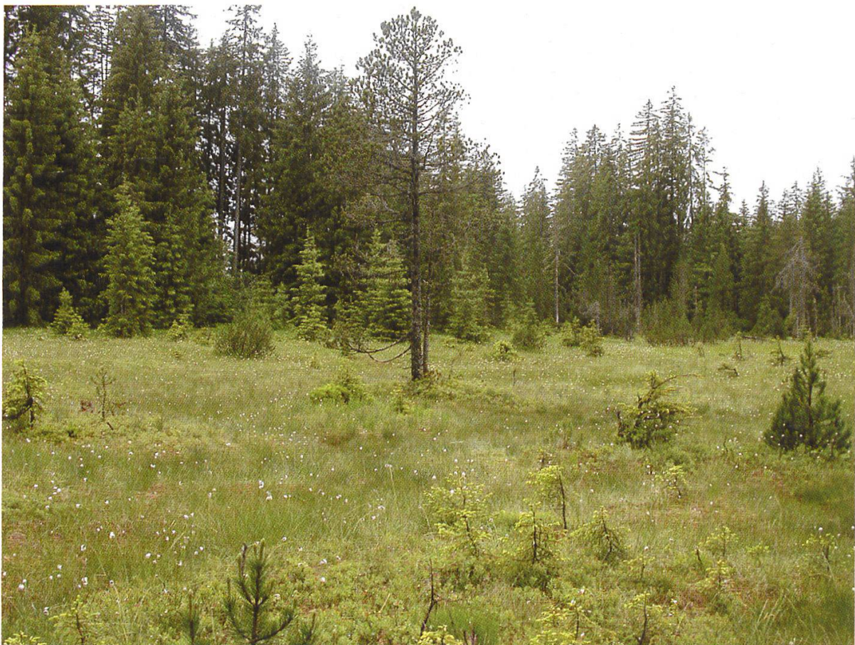
Abbildung 4: Hochmoor im Gebiet Salwideli

Nicht weit ausserhalb der Berner Kantonsgrenze Richtung Innerschweiz liegt Sörenberg, die grösste Gemeinde des Kantons Luzern. Sie liegt im Süden des Entlebachs, eingebettet zwischen Briener Grat im Süden, Schrattenfluh im Westen und der Kette mit Glaubenbielen, Nünalpstock und Hagleren im Osten und Norden. Die Region Entlebuch, die Schweizer Landschaft mit der grössten Dichte an Moorflächen, umfasst ca. 400 km 2 , davon ist mehr als die Hälfte geschütztes Moorgebiet. Seit 2001 ist das Entlebuch ein von der Unesco anerkanntes Biosphären-Reservat, das erste der Schweiz. Ziel dieses Labels ist die nachhaltige Entwicklung eines Gebiets, die sowohl der Natur als auch den Menschen Überlebenschancen geben soll.