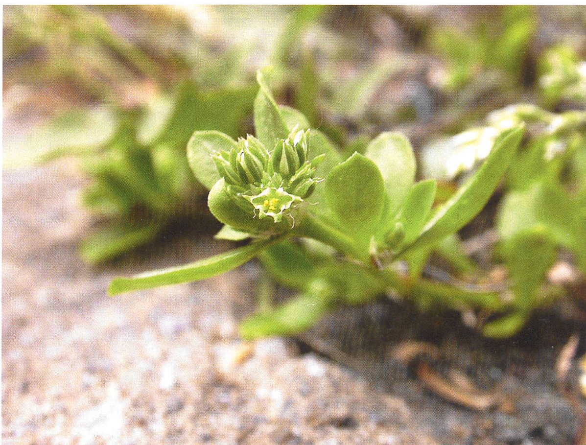
Abbildung 2: Vierblättrige Nagelkraut ( Polycarpon tetraphyllum )

Die Flusslandschaft unterhalb des Stauwehrs gehört zur Domäne der Maigrauge oder Magerau. Nicht nur das Kloster ist immer noch in Betrieb sondern auch der dazu gehörende Landwirtschaftsbetrieb. Begrenzt wird die Flusslandschaft durch mehr oder weniger senkrechte Sandsteinfelsen, welche durch die Mäanderschlaufen des Flusses in viele verschiedene Expositionen ausgerichtet sind. In diesen unterschiedlichen Milieus fühlen sich auch viele subalpine oder sogar alpine Pflanzen wohl, wie z. B der Bewimperte Steinbrech ( Saxifraga aizoides ).