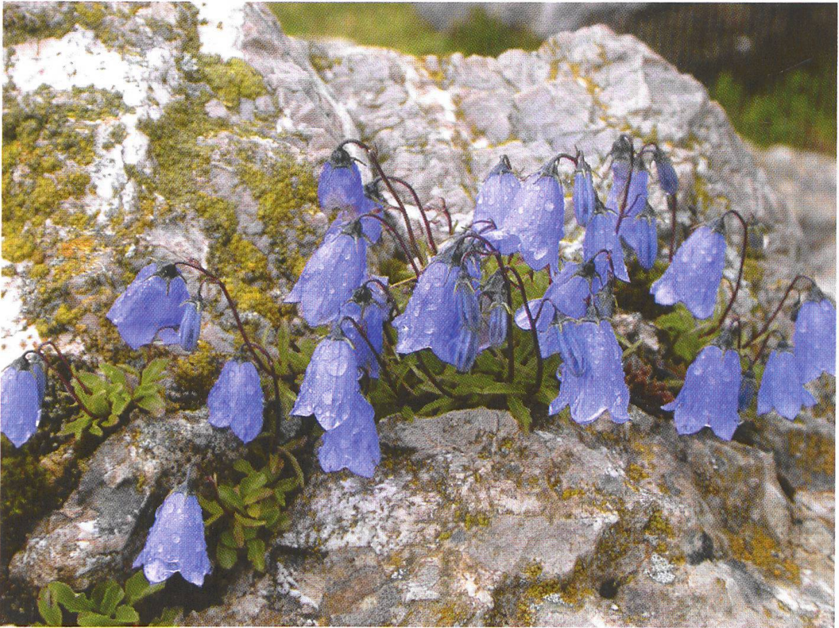
Abbildung 7: Niedliche Glockenblume ( Campanula cochleariifolia )

Anders als die Blumen verkriechen sich viele Tiere bei schlechtem Wetter. So zeigen sich in den feucht-kühlen Vormittagsstunden nur vereinzelte Bewohner der Alpweiden zwischen Gantrischhütte und Gantrischseeli. Unter ihnen die Gebirgsschrecke ( Miramella alpina ), eine Kurzfühlerschrecke, die sich auf den subalpinen bis alpinen Lebensraum spezialisiert hat und dort vor allem in krautiger Umgebung vorkommt. Sie gehört zu den Knarschrecken, macht aber nur leise Geräusche, ähnlich einem Knacken. Diese Laute gehören zum Balzspiel, dem eine bis zu einer Stunde dauernde Paarung folgt. Das Weibchen legt danach die Eier in den Boden ab. Die Generation für das nächste Jahr überwintert als Ei im Boden.