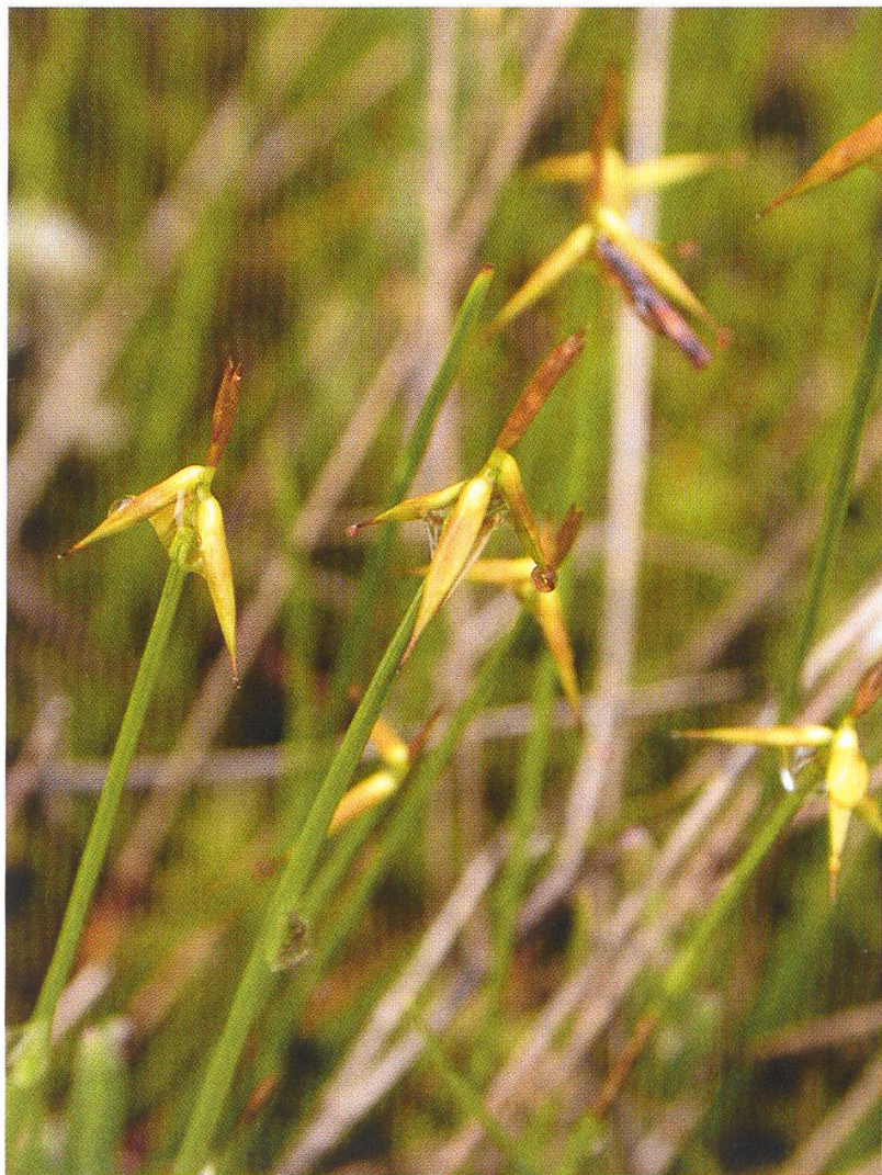
Abbildung 5: Armblütige Segge ( Carex pauciflora )

Geologisch ist das Gebiet um Sörenberg sehr interessant, weil es sich aus unterschiedlichen Gesteinen zusammensetzt. Nördlich des Dorfs Sörenberg liegen die beiden Gipfel Hagleren und Nünalpstock. Die Hagleren ist zu ihrem Namen gekommen, weil sie im Kreuzungspunkt zweier Hagelzüge liegt und deshalb sehr oft Hagelschlag ausgesetzt ist. Beide Gipfel bestehen aus instabilem Schlierenfels, der sich vor allem bei starken Regenfällen mit Wasser voll saugt. In der Folge kann es zu Hangrutschen oder Bergstürzen kommen. Am Nünalpstock sind 1910 ca. 5 Mio. m 3 abgerutscht und haben die Waldemme aufgestaut. Trotz diesem Ereignis sind in diesem Hang mittlerweile Ferienhäuser gebaut worden. Ganz anders beschaffen ist der massive Kalk der Schratzenfluh, der durch viele typische Kalk-Erosionsformen wie Karrenfelder, Dolinen etc. auffällt. Die Schratzenfluh ist Namensgeberin für die Gesteinsart Schratzenkalk. Interessant auch der Giswilerstock im Osten von Sörenberg. Er besteht aus Dolomit, der ursprünglich aus der Gegend des heutigen Tessins stammt.