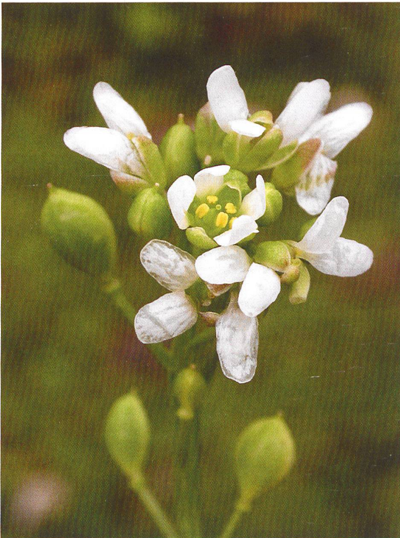
Abbildung 8: Pyrenäen-Löffelkraut ( Cochlearia pyrenaica )

In den von Gräsern dominierten Weiden sind auch die Parasiten der Gräser nicht weit. So treffen wir auf die Gräser parasitierenden Klappertopf-Arten Zottiger Klappertopf ( Rhinanthus alectorolophus ) und Kleiner Klappertopf ( Rhinanthus minor ), sowie den Zottigen Augentrost ( Euphrasia hirtella ). Sie sorgen quasi wieder für einen Ausgleich unter den verschiedenen Pflanzenarten, indem sie als Halbparasiten von den sonst stark dominierenden Gräsern profitieren. Interessant ist, dass es sich dabei immer um einjährige Arten handelt, die kaum eigene Wurzeln ausbilden. Werden die Weiden zu einem frühen Zeitpunkt gemäht, verschwindet der Klappertopf ziemlich schnell. Da die Pflanze leicht giftig ist, wird sie vom Vieh nicht gefressen. Systematisch wurden diese Arten aus der früheren Familie der Braunwurzgewächse ( Scrophulariaceae ) neu zu den Sommerwurzgewächsen ( Orobanchaceae ) gestellt. Ein grosser Teil der ebenfalls früher zu den Braunwurzgewächsen gehörenden Gattungen gehört neu zu den Wegerichgewächsen ( Plantaginaceae ), z.B. die Gattung Ehrenpreis ( Veronica ). Von den schweizerischen Arten verbleiben lediglich die Gattungen Braunwurz ( Scrophularia ) und Königskerze ( Verbascum ) und Schlammkraut ( Limosella ) in der ursprünglichen Familie.