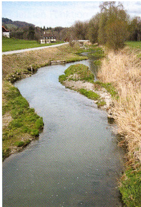
Die renaturalisierte Gürbe, wie sie sich heute gibt. Ein gelungenes Beispiel zu Hochwasserschutz, Naherholungsreich und ökologischen Nischen.