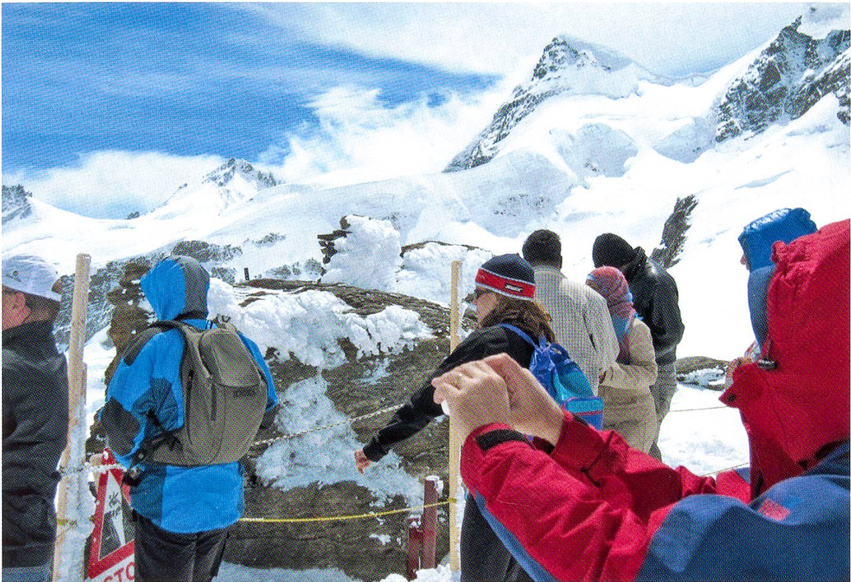
Eindrückliche Stimmung im Schnee und Eis während der Inqua-Exkursion zur Hochalpinen Forschungsstation Jungfrauoch. Für NGB-Mitglieder wird diese Exkursion am 10. November 2012 angeboten.