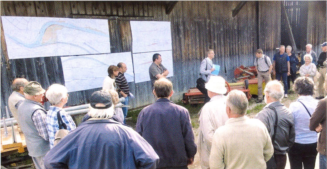
Begrüssung zum Jubiläumsanlass durch den NGB-Präsidenten und die Leiter der Jubiläums-Exkursion «Gezähmtes Wasser – Gürbereneraturierung».