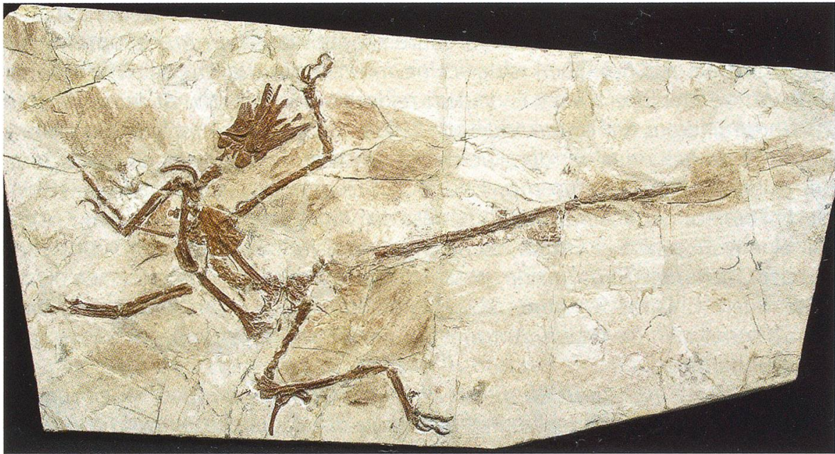
Abbildung 3: Vierflügeliger Dromaeosaurier der Gattung Microraptor . An den Hinterbeinen sind verlängerte Schwungfedern erkennbar; auch der lange Schwanz ist befiedert. Original im Naturhistorischen Museum Bern; der Schädel dieses Exemplars ist nicht erhalten; er wurde entsprechend dem Holotyp nachmodelliert.

gruppe der Vögel, die auch an den Hinterbeinen Schwungfedern trugen (Abb. 3). Dass diese Tiere in Bäumen lebten und wohl Gleitflieger waren, erscheint plausibel, denn die langen Federn an den Läufen wären bei der Fortbewegung am Boden hinderlich gewesen. Daraus zu schliessen, dass die Vögel aus einem vierflügeligen Vorfahren entstanden sein müssten (Zheng et al. 2013), ist nicht angebracht, denn schliesslich sind die vierflügeligen Formen mit einer vermutlich stark spezialisierten Lebensweise rund 20 Mio. Jahre jünger als der zweiflügelige Archaeopteryx .