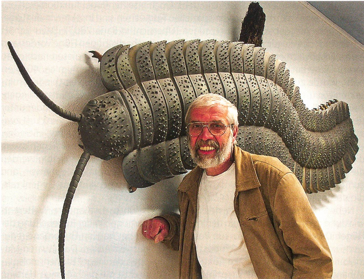
Abbildung 2: Gigantismus bei paläozoischen Arthropoden: lebensgrosse Rekonstruktion von Arthropleura. Die Tergiten (Rückenschilder) aller Körpersegmente tragen beidseits ein Paranotum. Diese Auskragungen wurden als mögliche Vorstufen der Insektenflügel betrachtet. (Foto: TU Bergakademie Freiberg).

den Flügeln an. Deshalb können Libellen ihre vier Flügel unabhängig voneinander schlagen, was insbesondere den Grosslibellen ihre extreme Manövrierfähigkeit verleiht. Bei allen anderen Insekten ziehen die Flugmuskeln das «Dach» des flügeltragenden Thoraxsegments und mit diesem die Flügelbasis nach unten (ventral), wodurch die Flügel nach oben gedrückt werden. In der evolutiven Weiterentwicklung der Flügel und der Flugbewegungen zeigt sich die Tendenz, Vorder- und Hinterflügel einer Seite als Einheit schlagen zu lassen. Dazu haben verschiedene Gruppen (z.B. Hautflügler und Schmetterlinge) Strukturen entwickelt, welche die Flügel miteinander verhaken. Käfer und Zweiflügler erreichen das Ziel auf andere Weise: Bei Käfern sind nur die Hinterflügel als Flugorgan ausgebildet; die harten Vorderflügel (Elytren) bilden beim nicht fliegenden Tier einen Schutz für die Hinterflügel und den weichen Körper. Bei Dipteren dagegen ist der Hinterflügel zum Schwingkölbchen «verkümmert» und dient nur noch der Flugstabilisierung.