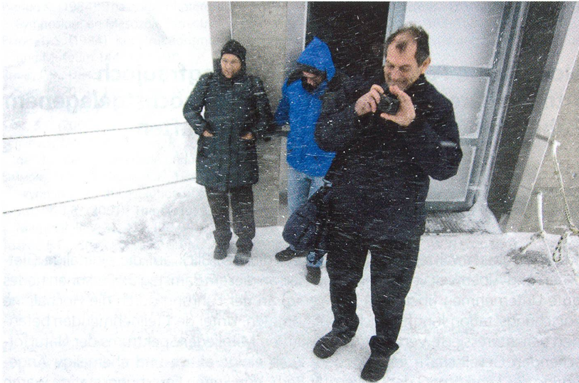
Draussen tobte der Sturm – Fotoapparat festhalten!