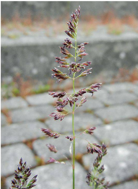
Abbildung 1: Schmalblättriges Rispengras ( Poa angustifolia ) im Neufeldstadion.