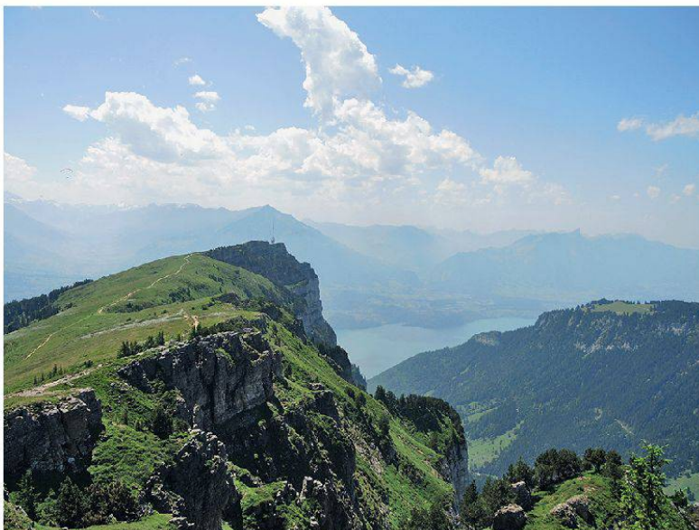
Abbildung 7: Niederhornkette mit Blick auf Niesen, Stockhorn und Thunersee.

Obwohl oder vielleicht gerade weil als Wandergebiet sehr häufig begangen, sind in der Datenbank von Infoflora kaum aktuelle Fundortsangaben aus dem Gebiet Niederhorn – Gemmenalphorn vorhanden. Ein typisches «schwarzes Loch» also, obwohl topographisch alles andere als ein Loch, lockt doch diese Gipfelregion mit einem fantastischen Panoramablick in die Berner Hochalpen, Richtung Jura und Emmental.