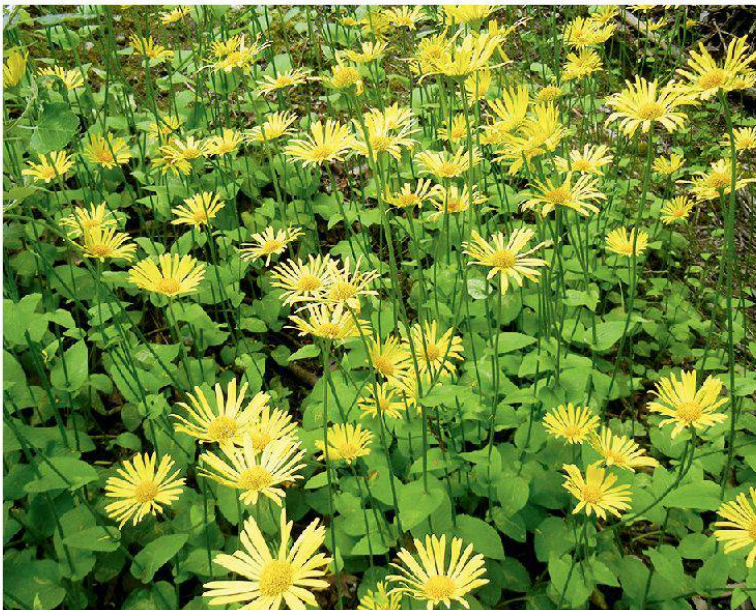
Abbildung 2: Eine verwilderte Population der Gemswurz ( Doronicum sp.) bei der ARA Neubrugg.