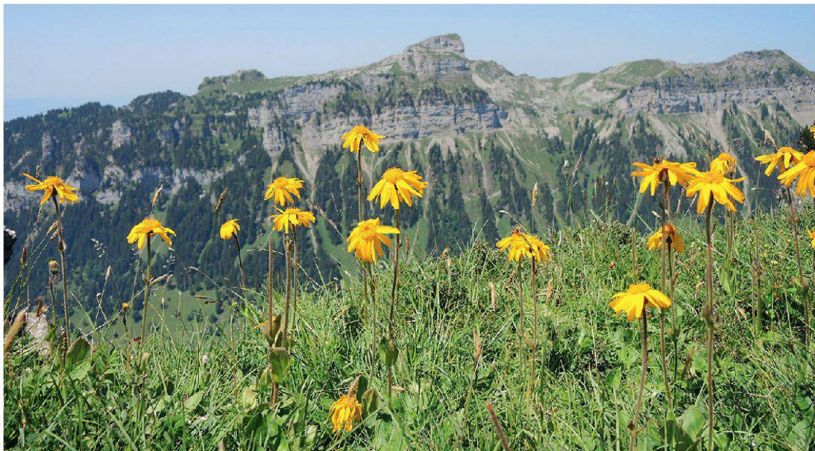
Abbildung 8: Arnika ( Arnica montana ).

Die Flächenzuteilung des Welten-Sutter-Atlas beruht auf topographischen Kriterien und floristischen Gemeinsamkeiten. Es wurden möglichst zusammengehörende Regionen zusammengefasst. Unterschieden wurde ausserdem nach Tal- und Bergregionen, allerdings mit unterschiedlichen Zahlen bezüglich Höhenmetern. Die damaligen Artenlisten sowie die Schätzung der Häufigkeit einer Art beruhten auf Expertenkenntnissen. Die Kartierfläche (Nr. 575) umfasst das Gebiet Niederhorn, Gemmenalphorn, Sieben Hengst und Sigriswiler Rothorn mit der Höhenmetern 1800–2061 m ü.M. und einer Fläche von insgesamt 6,4 Quadratkilometern. Darin sind im Atlas 339 Arten nachgewiesen, mit 2 Nachträgen seit 1982. Nur ca. 20% dieser Arten wurden in der Datenbank von Infoflora in den letzten Jahren bestätigt. Ausserdem gibt es zu den im Atlas aufgelisteten Arten keine genaueren Fundortsangaben. Deshalb ist der Atlas in manchen Belangen wenig hilfreich, z.B. wenn eine neue Rote Liste erstellt werden soll.