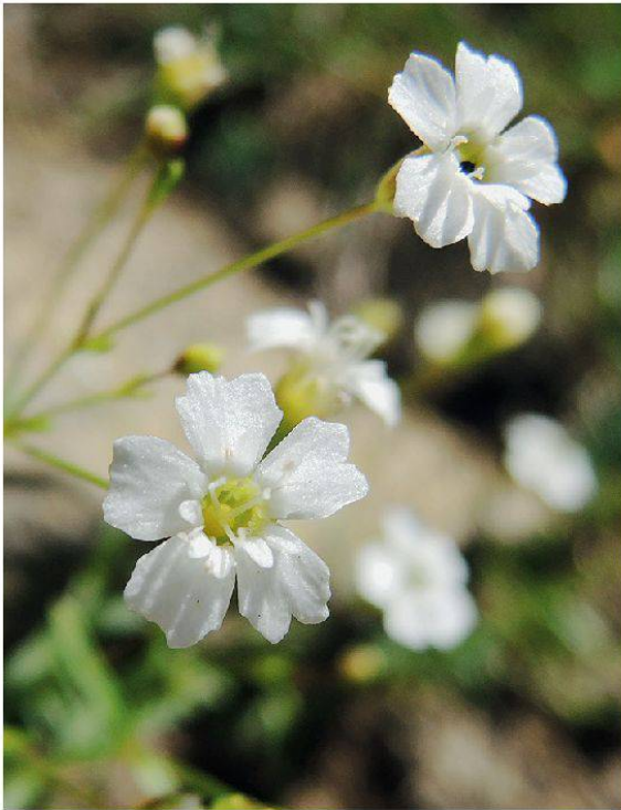
Abbildung 9: Der am Niederhorn erstmals beobachtete Strahlensame ( Silene pusilla ).

Pflanzen, die wir erfassen konnten – mit «neu» sind Arten gekennzeichnet, die im Gebiet erstmals kartiert sind: