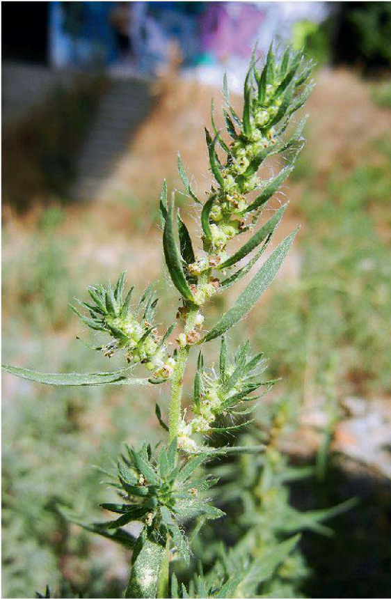
Abbildung 13: Besen-Radmelde ( Bassia scoparia ) unter der Autobahnbrücke im Wylerguet.