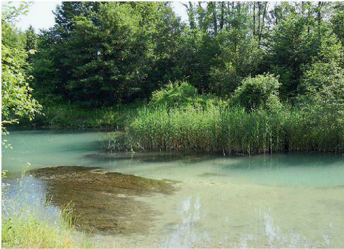
Abbildung 4: Alte Aare mit Wasserpflanzen.

Nach dem Erkunden der Wasserpflanzen in einem Teil des alten Aarelaufs sehen wir uns auch noch verschiedene Kleingewässer im Gebiet an und suchen mit dem Grappin nach Wasserpflanzen. Die Suche ist nicht immer von Erfolg gekrönt, aber in einem kleinen, vor 4–5 Jahren als Amphibienweiher angelegten Tümpel entdecken wir sogar Armleuchteralgen ( Chara spec. ).