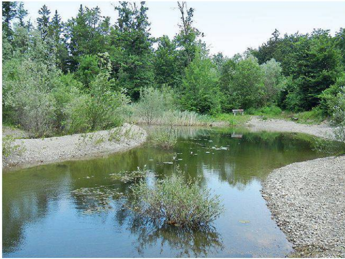
Abbildung 3: Renaturierter Arm der Alten Aare.

fischer Pflanzenmenge kann auch die Grösse des Gesamtbestandes an Wasserpflanzen geschätzt werden.