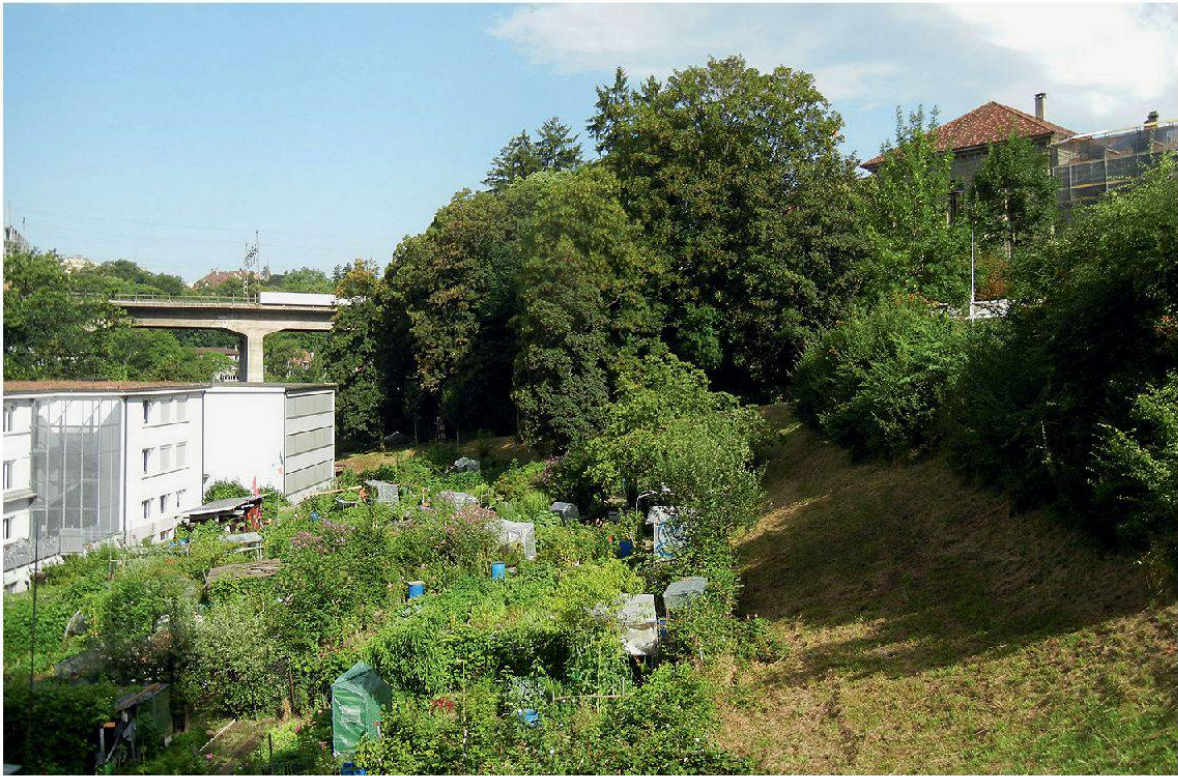
Abbildung 10: Einblick ins Lorraine-Quartier mit Schrebergärten und Autobahn.

Rund um den früheren Lorraine-Bahnhof entstand ein Arbeiterquartier, durchschnitten von der Eisenbahnlinie. Der Lorrainehof ist mit Entstehungsjahr 1705 das älteste Gebäude im Gebiet. In den letzten 20 Jahren hat sich die Lorraine stark verändert und ist zu einem stark überbauten, multikulturellen Quartier geworden. Grünflächen bestehen vor allem aus mesophilen Säumen in sonnigen Lagen und auf nährstoffreichem Boden. Diese Voraussetzungen bewirken nicht unbedingt eine grosse Artenvielfalt, da grosse Konkurrenz zwischen den Pflanzen herrscht.