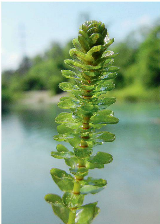
Abbildung 6: Kanadische Wasserpest ( Elodea canadensis ).

Zum Abschluss der Exkursion durchqueren wir die Feuchtwiesen zwischen der Alten Aare und Lyss, wo wir wunderschön blühenden Sumpf-Stendelwurz ( Epipactis palustris ) und Blutweiderich ( Lythrum salicaria ) antreffen.