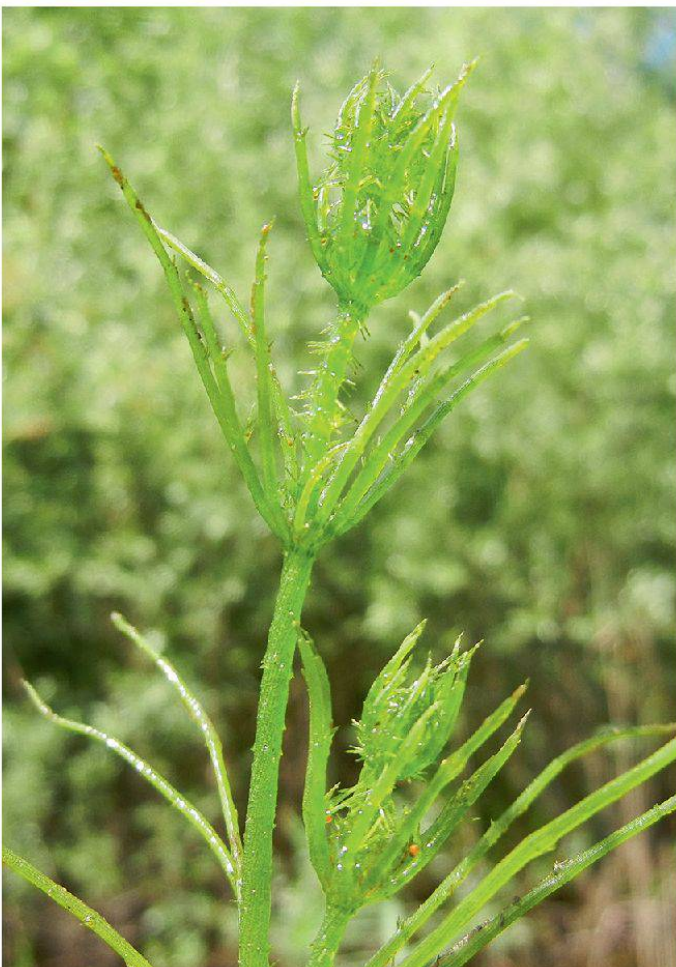
Abbildung 5: Arملهuchteralge ( Chara sp. ).

Nach dem Erkunden der Wasserpflanzen in einem Teil des alten Aarelaufs sehen wir uns auch noch verschiedene Kleingewässer im Gebiet an und suchen mit dem Grappin nach Wasserpflanzen. Die Suche ist nicht immer von Erfolg gekrönt, aber in einem kleinen, vor 4–5 Jahren als Amphibienweiher angelegten Tümpel entdecken wir sogar Armleuchteralgen ( Chara spec. ).