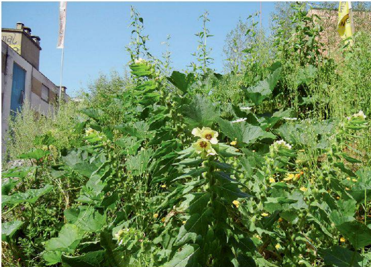
Abbildung 11: Schwarzes Bilsenkraut ( Hyoscyamus niger ) im Central-Park.

Häufigere Arten sind dann die Kleinblütige Königskerze ( Verbascum thapsus ) oder der weltweit verbreitete Portulak ( Portulaca oleracea ), dessen genaue Herkunft nicht mehr mit Sicherheit festgestellt werden kann. Portulak ist ein Kulturfolger des Menschen und wird in der asiatischen Küche als Gemüse oder Salat verwendet. Weltweit ist Portulak eines der gefürchtetsten Unkräuter in der Landwirtschaft. Er ist an 8. Stelle der weltweit am häufigsten vorkommenden Arten. Seine langlebigen Samen sind auch nach 12 Jahren noch keimfähig und zudem salzwasserbeständig. Als Kulturpflanze in Garten, Topf und Küche gibt es auch viele Portulak-Zuchtformen.